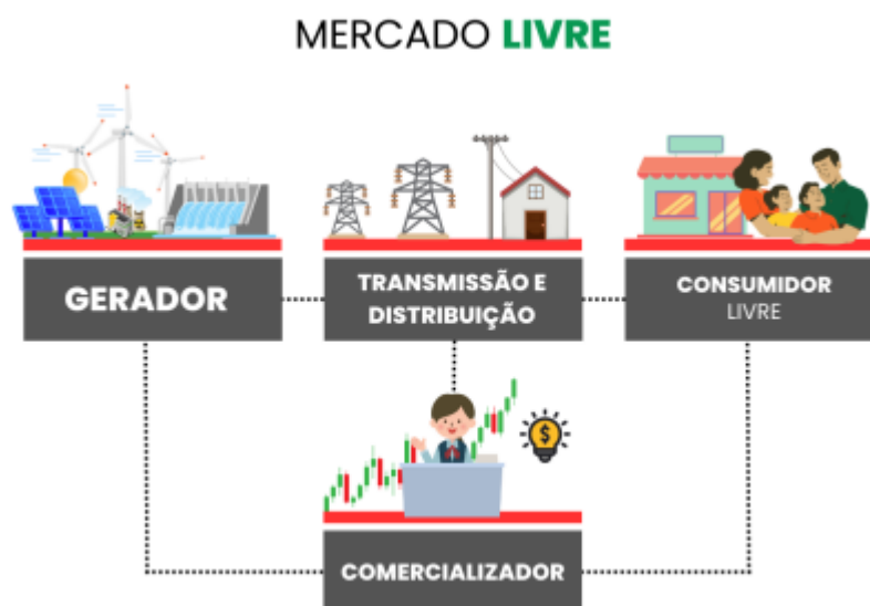
Figura 4 - Esquemáticação mercado livre