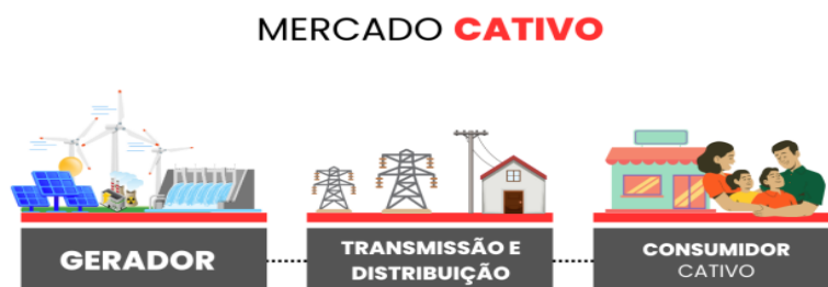
Figura 3 – Esquematização mercado cativo

consumidores a preços regulados pela ANEEL. Este mercado também é conhecido como mercado cativo (ABRACEEL, 2023), de acordo com a figura 3.