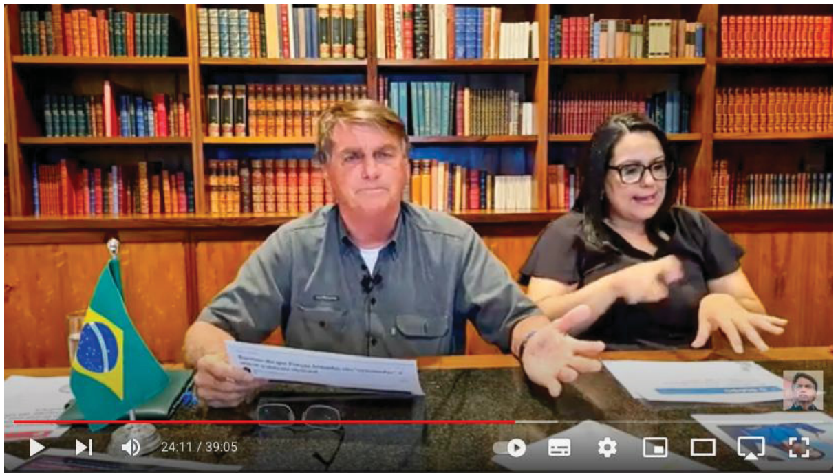
Figura 1: Jair Bolsonaro e a intérprete de Libras Elisângela em live do YouTube no dia 28 de abril de 2022

Todas as transmissões ao vivo de Bolsonaro seguiram um padrão ao longo de 2022. O então presidente ficava sentado em uma mesa e, como parte do cenário, havia sempre uma bandeira do Brasil. Seja pendurada ao fundo, na parede, ou em cima da mesa, quando as lives ocorriam na biblioteca do Palácio da Alvorada, residência oficial dos presidentes brasileiros.