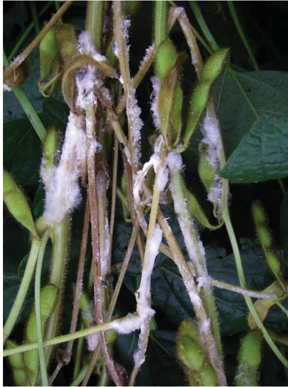
Figura 1 - Micélio de Sclerotinia sclerotiorum na soja