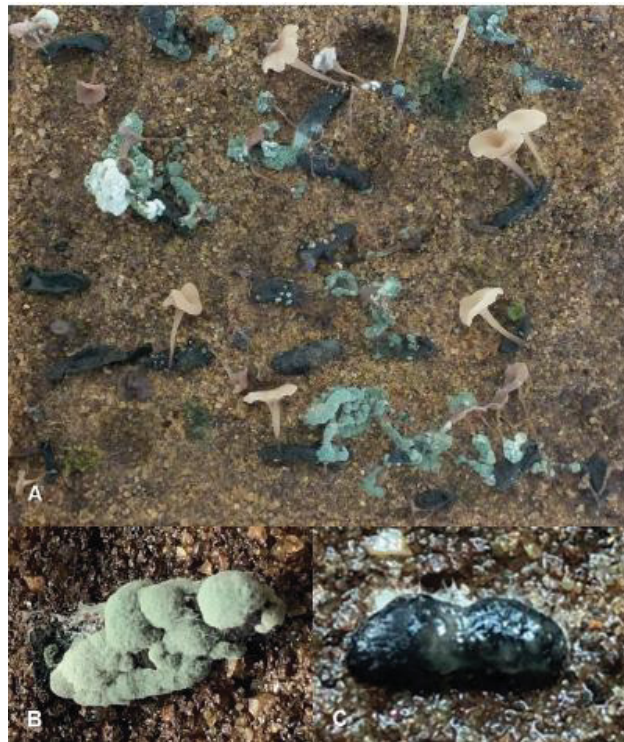
Figura 3 - Escleródios e apotécios de Sclerotinia sclerotiorum infectados por Trichoderma sp. (A e B) e escleródio recoberto por exsudato bacteriano (C)

O principal objetivo para usar Trichoderma spp. no controle de S. sclerotiorum é reduzir o número de escleródios no solo, fonte de inóculo primários (SILVA et al., 2022a). Assim, Trichoderma spp. parasita os escleródios de S. sclerotiorum , resultando assim numa redução da formação de apotécios e consequentemente numa diminuição da liberação de ascósporos, levando assim a uma redução da taxa de infecção (FIGURA 3) (CANUTO DA SILVA et al., 2024).