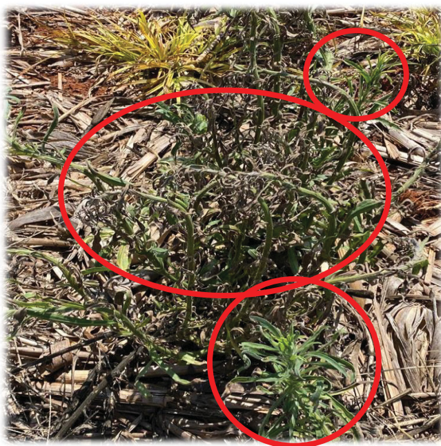
Figura 3. Plantas do Tratamento com Araddo apresentando epinastia e outras não.

O Tratamento com 2,4-D representado pela Figura 2, mostra visualmente a irregularidade de controle, onde foram observadas plantas controladas, plantas com sintomas de rápida necrose com 6 a 8 HAA (BACCIN 2020) e plantas que não apresentaram nenhum sintoma visível da ação do auxínico. Já a Figura 3 retrata uma condição parecida para o Tratamento com Araddo, onde vemos plantas com e sem sintoma de epinastia, que é um dos indicadores de sucesso na ação do herbicida auxínico, na mesma parcela de tratamento: