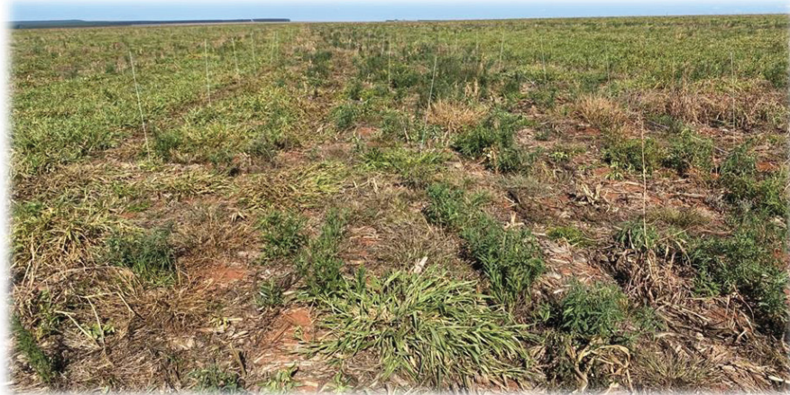
Figura 1. Panorama geral da área.

A área onde o estudo foi conduzido já havia passado por problemas de infestação de plantas daninhas, especialmente a buva ( Conyza sp. ). Três meses antes estudo, foi realizada uma aplicação do herbicida 2,4-D para o controle da buva, no entanto, a eficácia foi limitada, com um controle estimado em apenas 20%. Essa baixa eficácia motivou a realização do presente estudo para avaliar estratégias alternativas e combinadas de controle (Figura 1).