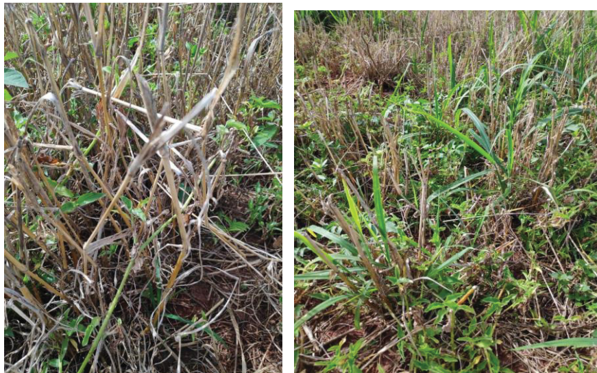
Figura 4. Tratamento em mistura de Triclon + Select (à esquerda) e mistura de 2,4-D + Select (à direita) resultado para capim amargoso considerando antagonismo.

Em relação ao efeito antagônico dos herbicidas auxínicos em misturas, pesquisas anteriores apontam essa redução de eficácia, afetando o herbicida ACCase em ambos os casos (CARVALHO et al., 2021; POLITO et al., 2021; WEBSTER et al., 2019). Alvarenga et al. (2018) explicam que essa interação se deve a uma incompatibilidade fisiológica, descrita por Green (1989) como uma oposição biológica entre os compostos nas plantas, o que diminui a eficiência de um ou de ambos os produtos. Na Figura 4 temos os tratamentos com maior (esquerda) e menor (direita) porcentagem de controle de capim amargoso, Tratamento com Triclon + Select e 2,4-D + Select respectivamente: