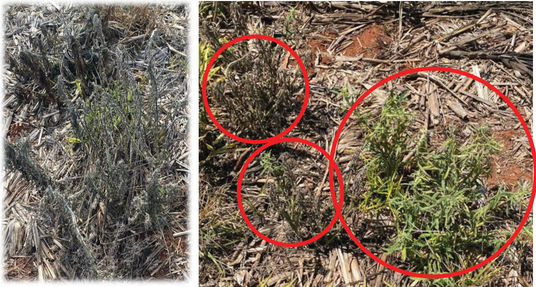
Figura 2. Tratamento com Triclon (à esquerda) e tratamento com 2,4-D à direita) para buva.

O Tratamento com 2,4-D representado pela Figura 2, mostra visualmente a irregularidade de controle, onde foram observadas plantas controladas, plantas com sintomas de rápida necrose com 6 a 8 HAA (BACCIN 2020) e plantas que não apresentaram nenhum sintoma visível da ação do auxínico. Já a Figura 3 retrata uma condição parecida para o Tratamento com Araddo, onde vemos plantas com e sem sintoma de epinastia, que é um dos indicadores de sucesso na ação do herbicida auxínico, na mesma parcela de tratamento: