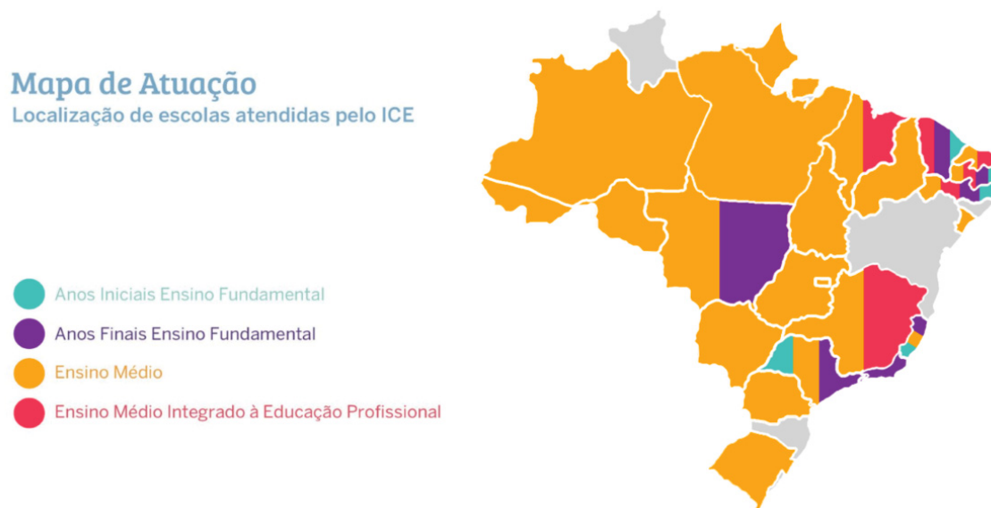
Figura 6 – Mapa de atuação do ICE no Brasil