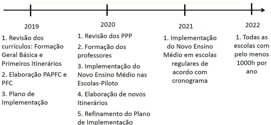
Figura 2 – Cronograma para implementação do NEM

Após a aprovação da Lei nº 13.415/2017, dos Pareceres e das Resoluções que as normatizaram e da homologação da BNCC, foi instituído pelo MEC, um cronograma para a implementação do Novo Ensino Médio, conforme mostra a imagem abaixo. Essa imagem foi elaborada pelo MEC, a partir das indicações de prazos contidas no Parecer nº 3/2018.