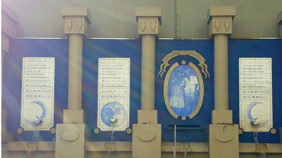
FIGURA 4 – FONTE AS MOCINHAS DA CIDADE, NA REGIÃO CENTRAL DE CURITIBA/PR.

Homenagem ao casal Nhô Belarmino e Nhá Gabriela, símbolos da música caipira paranaense 20 . FONTE: Disponível em: < https://bit.ly/42ep8bd >. Acesso em: 22 jan. 2024.