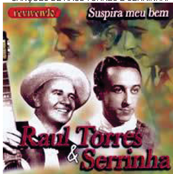
FIGURA 7 – CAPA DO DISCO SUSPIRA MEU BEM , DE 2000, UMA COLEÇÃO DE RESGATE DAS CANÇÕES DE RAUL TORRES E SERRINHA.