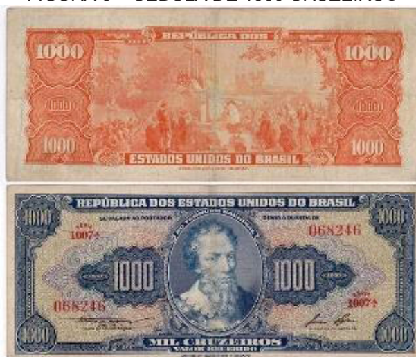
FIGURA 6 – CÉDULA DE 1000 CRUZEIROS

Frente: efigie de Pedro Álvares Cabral; verso: primeira missa no Brasil. A cédula recebeu o apelido de abobrinha ou flor de abóbora .