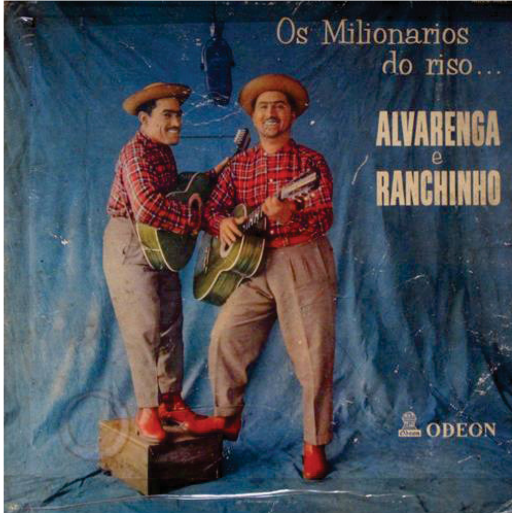
FIGURA 2 – CAPA DO DISCO OS MILIONÁRIOS DO RISO, DE 1957, PELA GRAVADORA ODEON, COM ARQUÉTIPO PADRÃO DAS PRIMEIRAS DUPLAS CAIPIRAS.