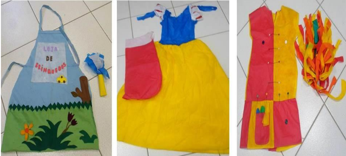
FIGURA 7: Figurinos do Programa de Extensão Mundo Mágico da Leitura.