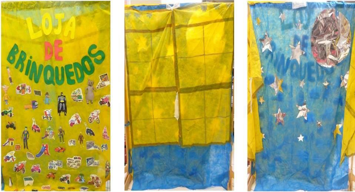
FIGURA 5: Cenário da peça.