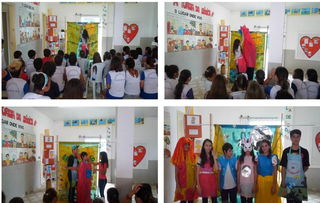
FIGURA 8: Estreia da peça nas instituições parceiras.

As apresentações aconteceram nas cinco instituições educacionais parceiras do Programa de Extensão “O Mundo Mágico da Leitura”, totalizando onze apresentações. Segundo os próprios estudantes, no decorrer das apresentações, eles ficaram cada vez mais seguros do que estavam fazendo.