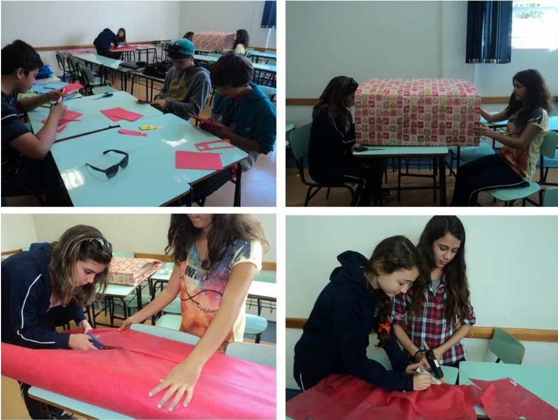
FIGURA 3: Construção do cenário e dos figurinos da peça.