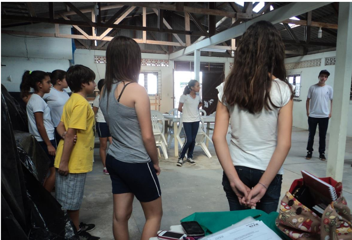
FIGURA 1: Prática teatral – jogo dos nomes

Na prática, formávamos rodas, participávamos de jogos simples ou complexos, entre inúmeras outras atividades. A FIGURA 1 apresenta o “jogo dos nomes”, um jogo simples realizado apenas para que cada um dos participantes se apresentasse dizendo nome, idade e do que gostava de fazer.