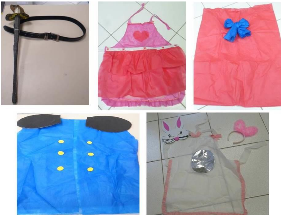
FIGURA 6: Figurinos confeccionados pelos estudantes do curso de extensão.