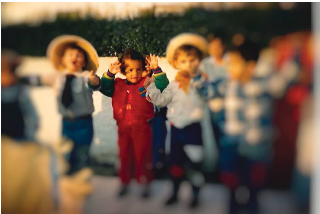
FOTOGRAFIA 1 – Festa junina, 1988.

Contudo hoje, quando volto no tempo, me lembro da creche que frequentava na infância, na qual o público era formado majoritariamente por crianças brancas. O número de cadeiras era inferior ao número de crianças, lembro que com frequência a professora me tirava da cadeira e me colocava para comer no chão, o meu lugar à mesa era sempre destinado a uma criança branca, havia apenas duas crianças negras na escola. Lembro de um dia que a professora, no horário do almoço, me trancou dentro de um cômodo e me esqueceu lá, sem comer, só fui tirada de lá no final da tarde e ela me disse que a culpa era minha por ter ficado presa, já que eu permaneci quieta durante todo o tempo. Só depois de muitos anos que eu percebi todo o racismo e classicismo dessa situação, e por isso tomo uma frase de Neusa Santos Souza (2021), “não nascemos negros, nos tornamos negros”.