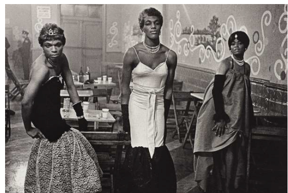
Diane Arbus (USA), Three transvestites in evening dress at a longe, N.Y.C, 1961.