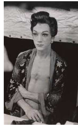
Diane Arbus (USA), Seated female impersonator in an open kimono, Hempstead, L.I., 1959.