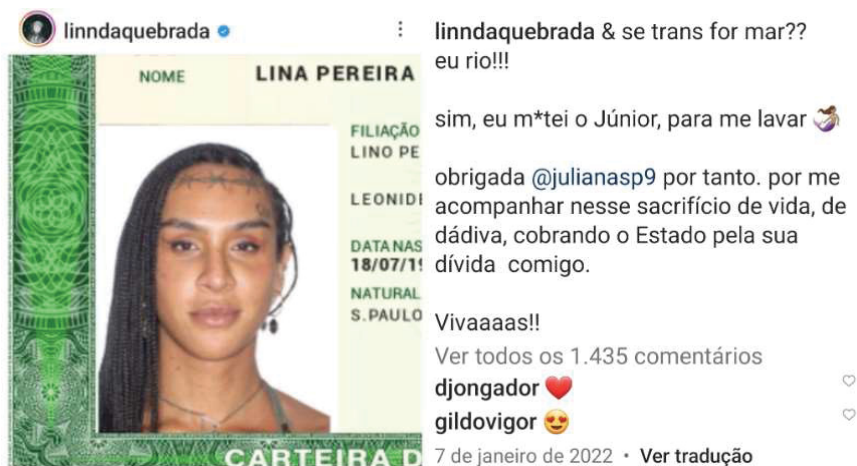
IMAGENS 1 e 2 (captura de tela)

Em outra postagem, em 7 de janeiro de 2022, ela apresenta sua carteira de identidade com a legenda poética “& se trans for mar?? eu rio!!!”. Ela lavou-se.