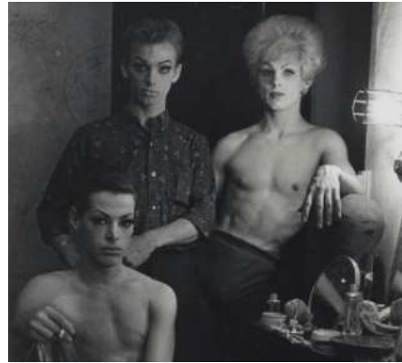
Diane Arbus (USA), Three Female Impersonators, N.Y.C, 1962.

Quantas vozes silenciadas Por tua fala rebuscada Quantas vidas em sequela Por tuas paredes austeras