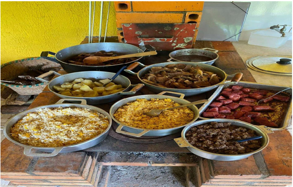
(do almoço feito pela faxinalense Sônia Przyvitowski, no dia 22 de outubro de 2023)