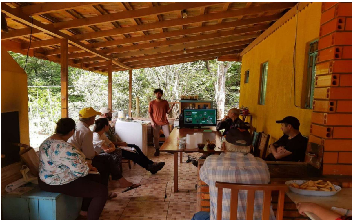
(Foto registrada por Amanda Murakami, de momento da oficina, em 22 de outubro de 2023)