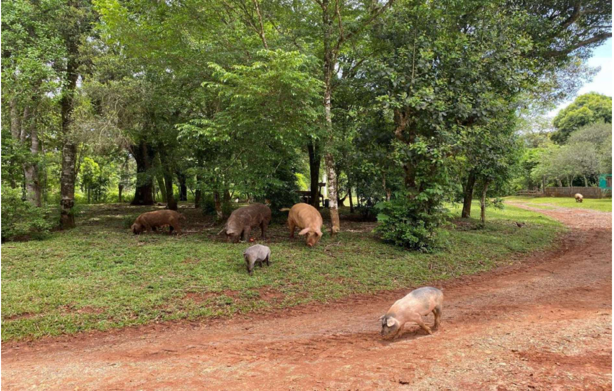
(Foto registrada por Giovanna Menezes, dos porcos criados à solta, no dia 22 de outubro de 2023)