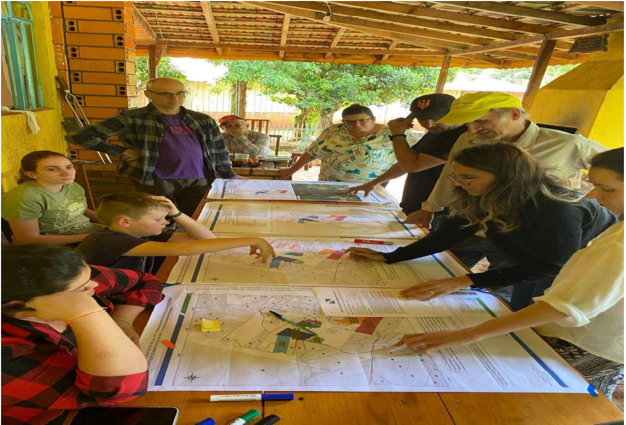
(Foto registrada por Giovanna Menezes, da oficina com mapas, no dia 22 de outubro de 2023)