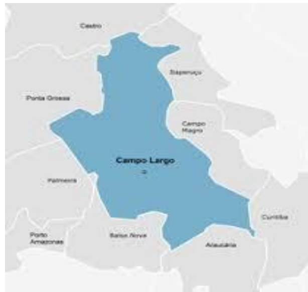
FIGURA 2 – CAMPO LARGO E SUAS DIVISAS