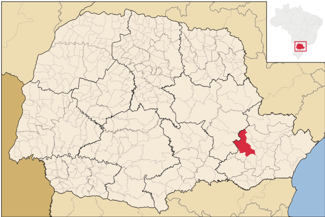
FIGURA 1 – CAMPO LARGO – MAPA DO ESTADO DO PARANÁ