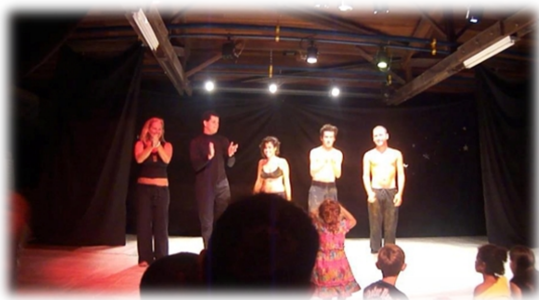
Imagem 07 - Apresentação Síntese da Oficina “Dança pela Dança – Laboratório do Movimento” Centro Cultural da UFPR Litoral – Matinhos-PR – Foto: Graciele Lukasak(2012)

Como dito anteriormente, no 3º período do Curso de Licenciatura em Artes, eu pensava em propor um espaço para desenvolver a dança. A minha intenção naquela época era simplesmente dançar, ter um espaço para isso. Eu não encontrava um grupo com uma prática constante de dança que eu me identificasse. Pensei que propondo um ICH teria esse espaço para experimentar dança, porém, naquele momento eu não consegui formalizar uma proposta mais concreta desses anseios, mas não descartei a ideia.