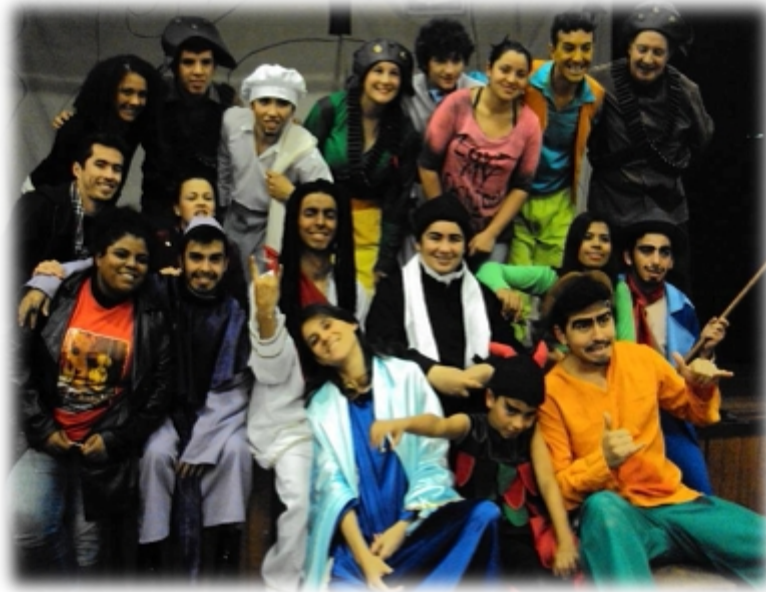
Imagem 01 - Criação e Execução da Sonoplastia do “O Auto da Compadecida” de Ariano Suassuna – Fotografia: Arquivo Pessoal(2011/2012)