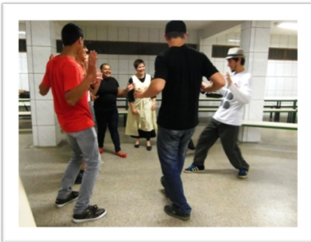
Imagem 19 – Aplicação de Aula de Dança-educação no Colégio Estadual José Bonifácio

“Há escolas que são gaiolas e há escolas que são asas. Escolas que são gaiolas existem para que os pássaros desaprendam a arte do voo. Pássaros engaiolados são pássaros sob controle. Engaiolados, o seu dono pode levá-los para onde quiser. Pássaros engaiolados sempre têm um dono. Deixaram de ser pássaros. Porque a essência dos pássaros é o voo. Escolas que são asas não amam pássaros engaiolados. O que elas amam são pássaros em voo. Existem para dar aos pássaros coragem para voar. Ensinar o voo, isso elas não podem fazer, porque o voo já nasce dentro dos pássaros. O voo não pode ser ensinado. Só pode ser encorajado.” (ALVES, 2010, p.100).