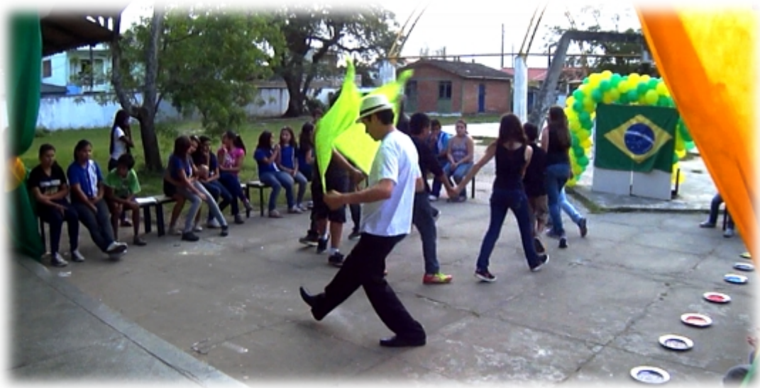
Imagem 16 – Dança-Teatro “Mestiçagem” em comemoração a Semana da Pátria do Colégio Estadual Vidal Vanhoni com alunos do Ensino Fundamental - Foto: Arquivo Pessoal(2012)