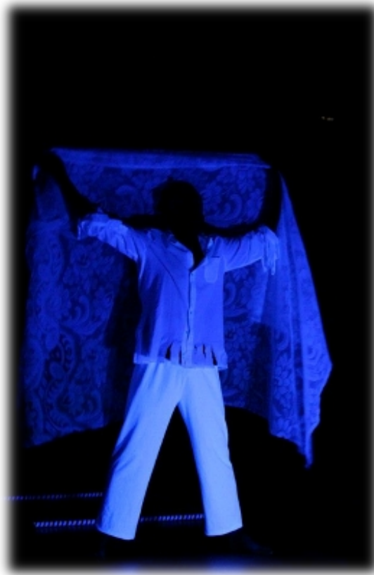
Imagem 08 - Performance “Ninguém me conhece” Vivências em Dança Curso de Licenciatura em Artes UFPR Litoral Matinhos-PR – Foto: Janete Pereira(2013)

É fascinante, poder se apropriar do discurso, técnica ou conceito de um artista que é mais conhecida pela sua música e agregar esses conceitos a um trabalho de dança(Imagem 08), ressignificando elementos do discurso e dos conceitos de arte que estão imbricados no trabalho do artista no seu trabalho.