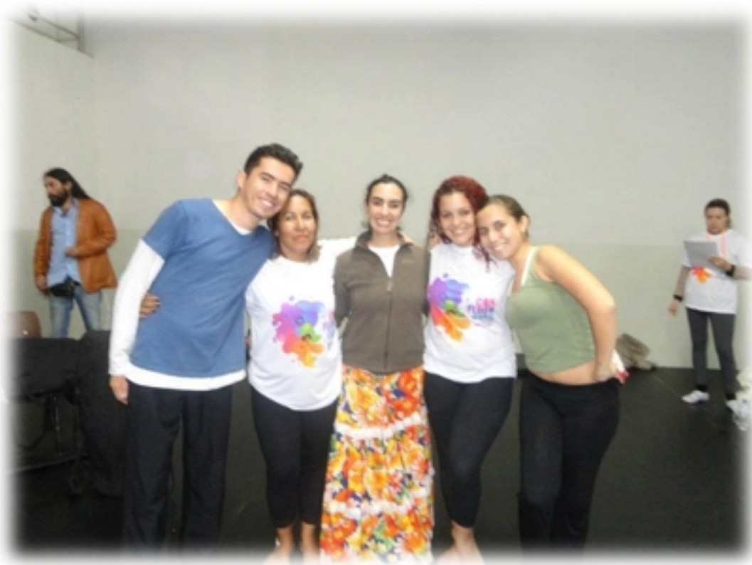
Imagem 06 - Oficina "O Corpo nas Danças Brasileiras" no Simpósio de Arte-educação da UNICENTRO em Guarapuava-PR