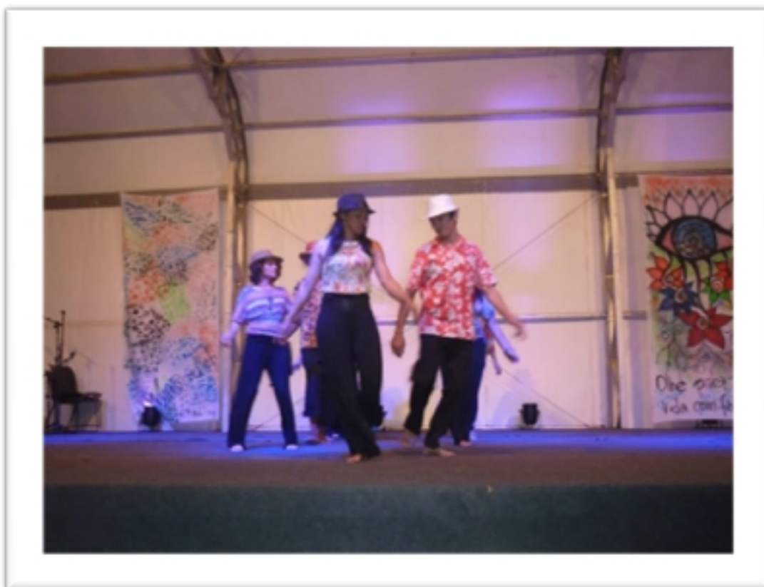
Imagem 11 – Apresentação Síntese do ICH Biodança e Expressões Culturais no FICH

Essa vivência na ICH resultou em uma investigação pessoal, a apresentação não foi o que eu esperava, mas só de ver a alegria das pessoas de estar se movimentando de uma forma artística e nos ritmos propostos já foi muito significativo. Pode influenciar alguém para o contato com movimento em uma prática de dança, e testemunhar o impacto desse movimento nas vidas das pessoas vai poderá estimulá-las a entrar num movimento que é parecido com o meu, de repensarem suas próprias vidas, e de buscarem o autoconhecimento.