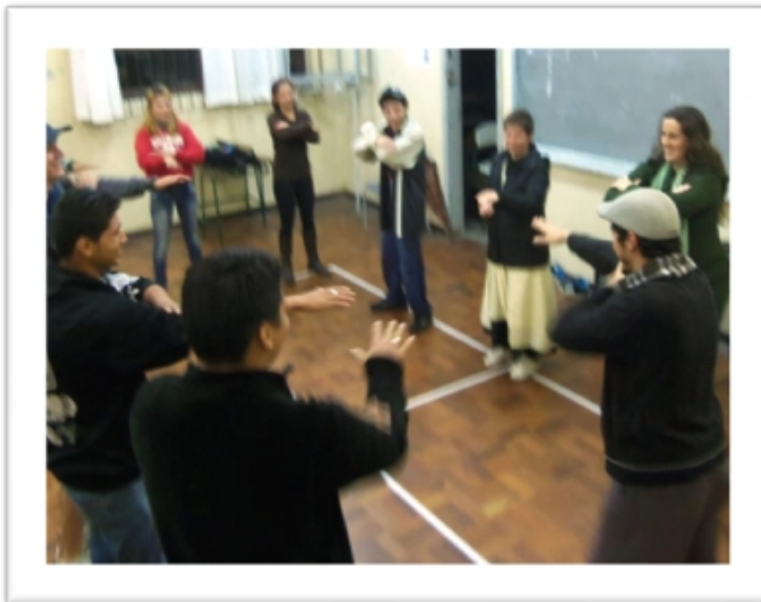
Imagem 20 – Aplicação de Aula de Dança-educação no Colégio Estadual José Bonifácio Foto: André Carvalho(2013)

contemporânea, com a abordagem de viewpoints, laban, técnicas de improvisação, composição coreográfica, pilates como preparação para a dança, entre outras experiências. Nesse período, atuei nos colégios Alberto Gomes Veiga e José Bonifácio ambos em Paranaguá como “Professor Dançante” no 1º ano do Ensino Médio (Imagens 19 e 20).