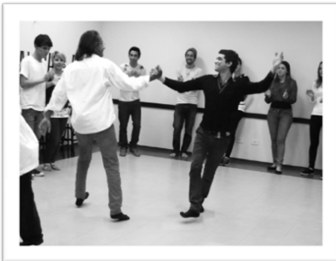
Imagem 09 – Dinâmica do Encontro de Biodança

de cada um e sem conhecer a Biodança, acreditava que ela contribuía para o grupo desenvolvendo a expressividade, espontaneidade e a criatividade em si, fazia com que os participantes se sentissem à vontade com seus e com outros corpos no mesmo espaço, para o autoconhecimento.