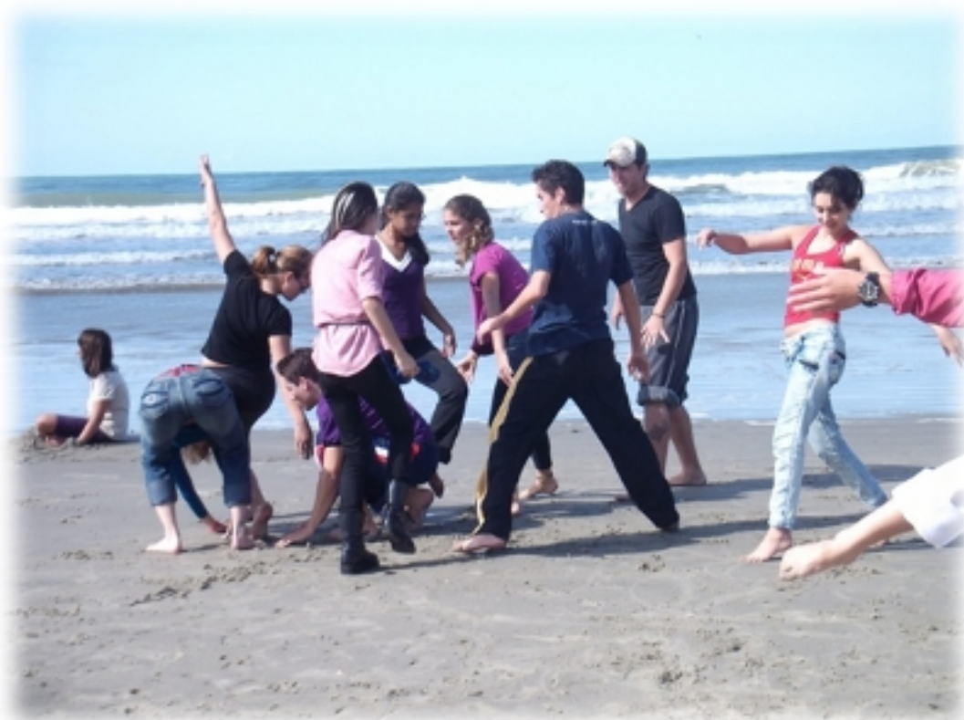
Imagem 04 - Projeto Perfume Iniciação a Dança Contemporânea pelo Ballet Teatro Guaíra Curso de Licenciatura em Artes Matinhos-PR - UFPR Litoral

Finalizamos a proposta com uma intervenção na praia (Imagem 04), onde caminhamos até a frente do mar, e improvisamos junto aos bailarinos movimentos improvisacionais e uma dinâmica de criação de formas esculturais através do corpo.