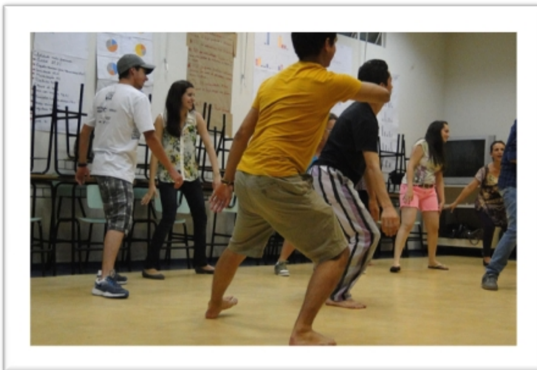
Imagem 10 – Dinâmica de Improvisação de Movimentos “Dança Coral” Laban

técnica singular, impossibilitada de acontecer naquele momento com corpos ainda tão imaturos para a minha proposta de investigação (Imagem 10).