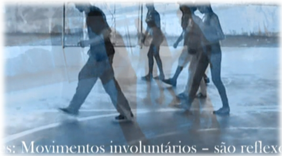
Imagem 15 – Videodança Síntese do Bimestre dos alunos do Ensino Fundamental e Médio no Colégio Estadual Sertãozinho – Foto: Arquivo Pessoal(2011)