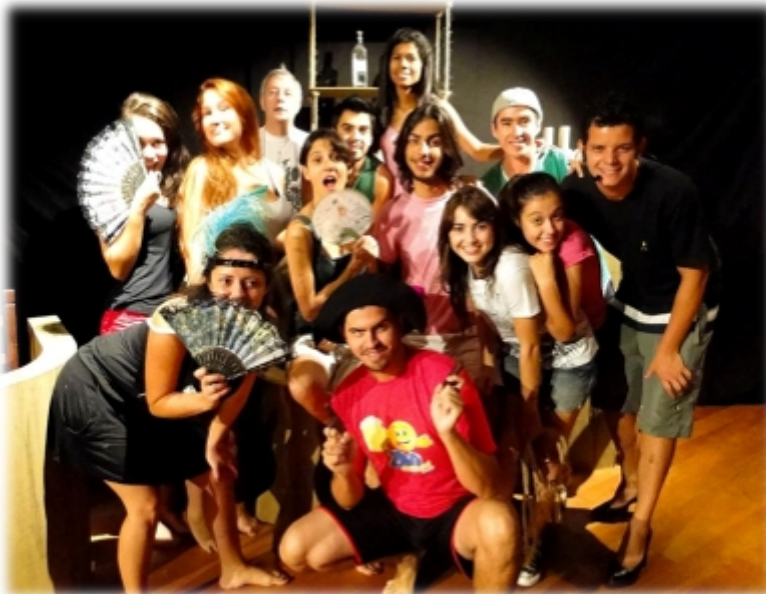
Imagem 02 - Criação e Execução da Sonoplastia do “Tribobó Litoral City” de Maria Clara Machado

Ser amante do movimento e ter vontade de me expressar corporalmente me ajudavam na hora de interpretar propostas dessa natureza. Integrar as vivências da igreja à minha trajetória artística era algo que não estava nos meus planos, mas organicamente aconteceu nesse, e em outros processos que vivenciei.