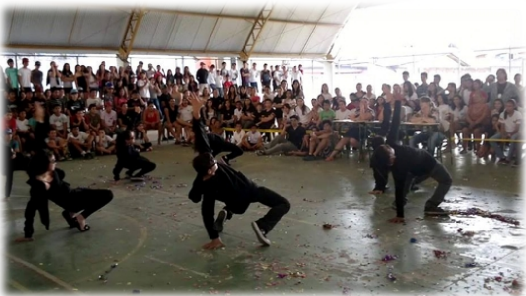
Imagem 18 – Dança “Matrix” na Semana de Integração com a Comunidade com alunos do Ensino Fundamental no Colégio Maria de Lourdes Morozowski