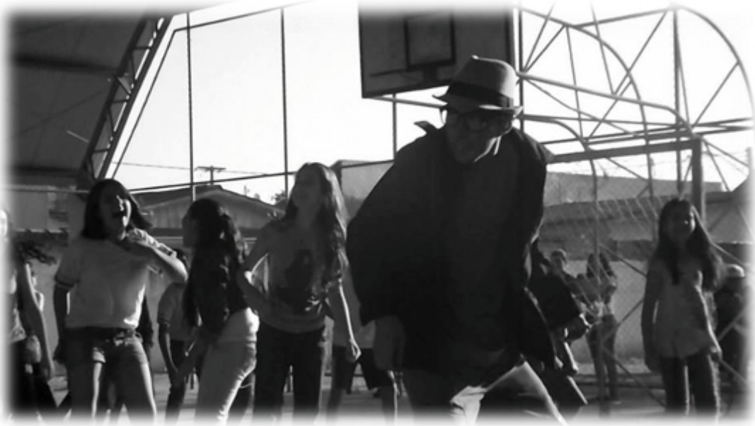
Imagem 17 – Flashmoob “Dance Sempre” com alunos do Ensino Fundamental no Colégio Maria de Lourdes Morozowski