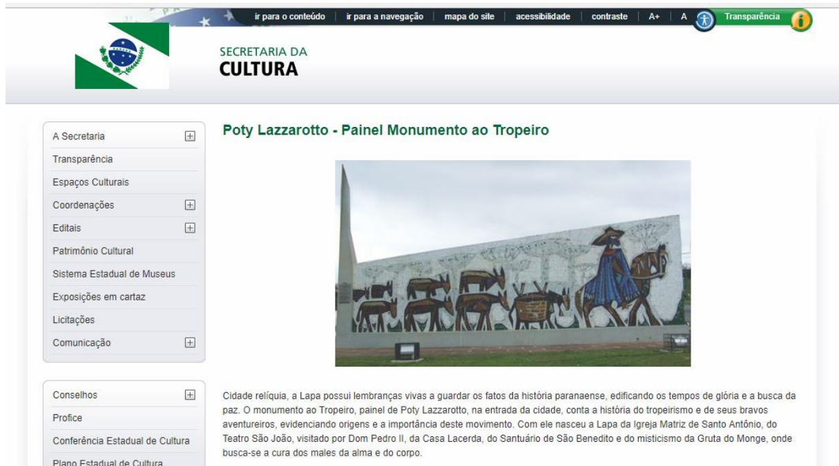
FIGURA 19 – SITE DA SECRETARIA DE CULTURA APRESENTANDO “MONUMENTO AOS TROPEIROS”