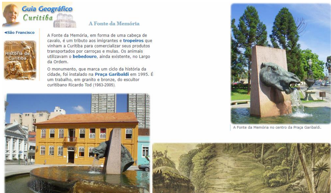
FIGURA 22 – FONTE DA MEMÓRIA