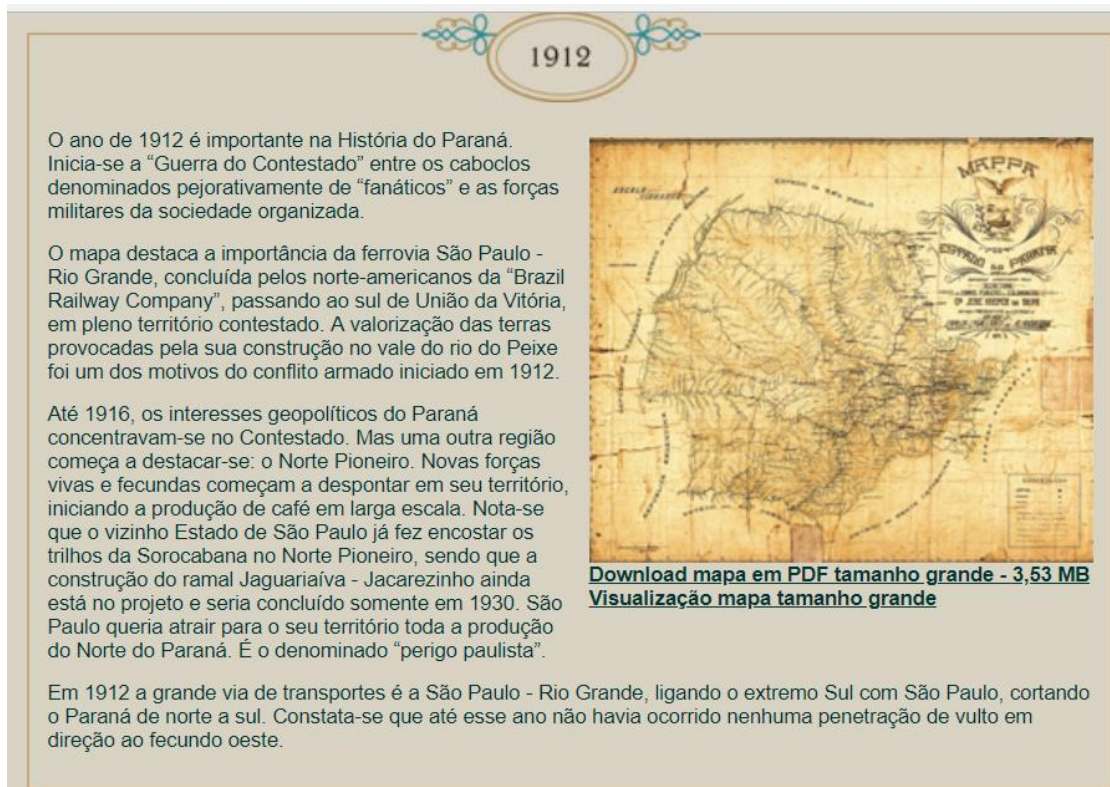
FIGURA 6 - SEÇÃO “COLETÂNEA DE MAPAS HISTÓRICOS DO PARANÁ”, ANOS 1911-1921.

LEGENDA: Na imagem pode-se ver o texto de referência assim como a miniatura do mapa e os links, tanto para visualização como para download.