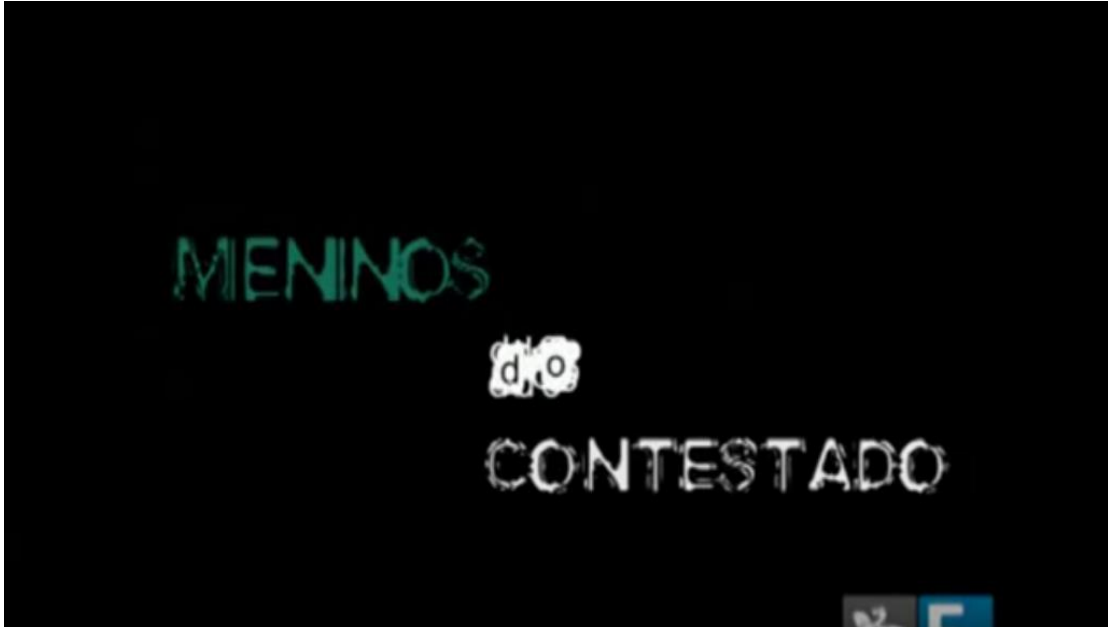
FIGURA 11 - DOCUMENTÁRIO MENINOS DO CONTESTADO