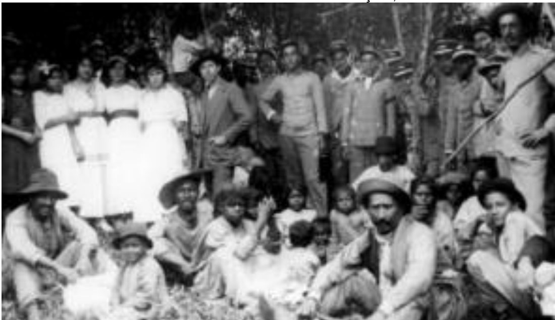
FIGURA 10 - REBELDES APÓS RENDIÇÃO, 1915.