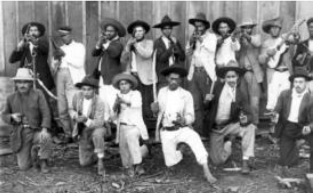
FIGURA 9 - GRUPO DE VAQUEANOS, 1914.