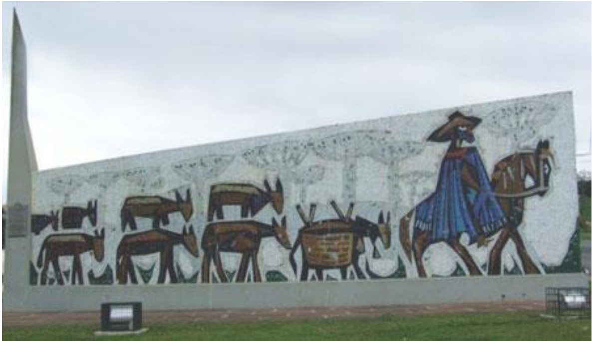
FIGURA 20 – MONUMENTO AOS TROPEIROS