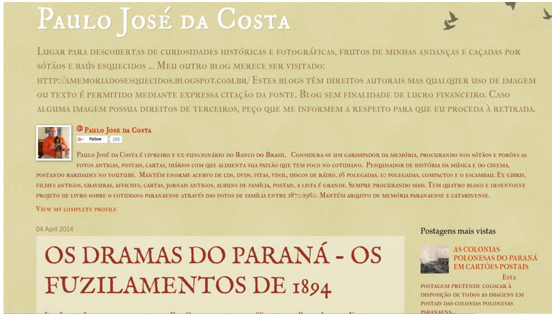
FIGURA 13 - BLOG PAULO JOSÉ DA COSTA