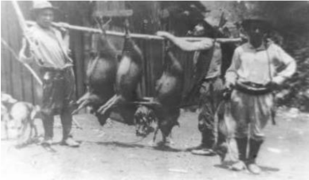
FIGURA 18 - TROPEIROS E PEÕES EXIBINDO A CAÇA, DE AUTOR DESCONHECIDO.