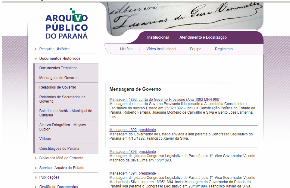
FIGURA 1 - SEÇÃO MENSAGENS DO GOVERNO NO SITE DO ARQUIVO PÚBLICO DO PARANÁ.