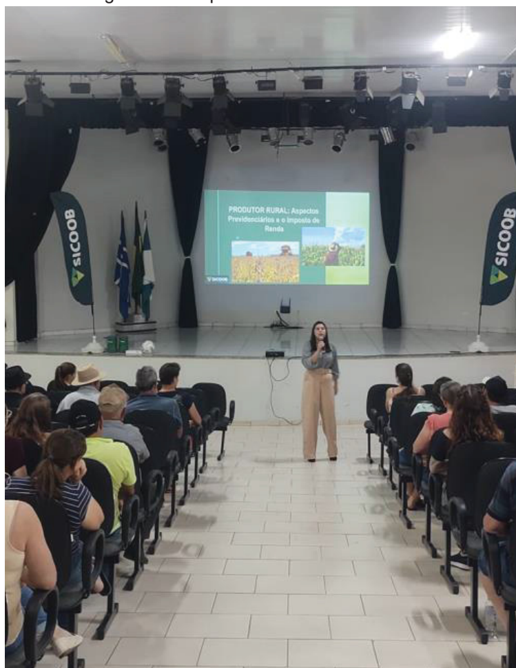
Imagem 2 – Cooperados no evento do Sicoob.