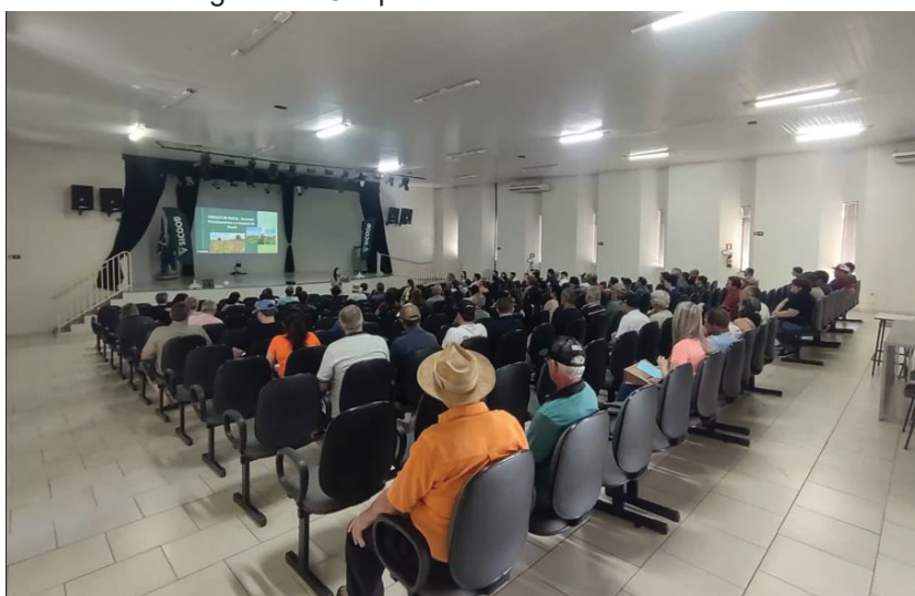
Imagem 1 – Cooperados no evento do Sicoob.

As imagens 1, 2 e 3 mostram fotografias do evento realizado em 02/10/2023 no município de Salto do Lontra, no Paraná, com a presença de 80 cooperados.