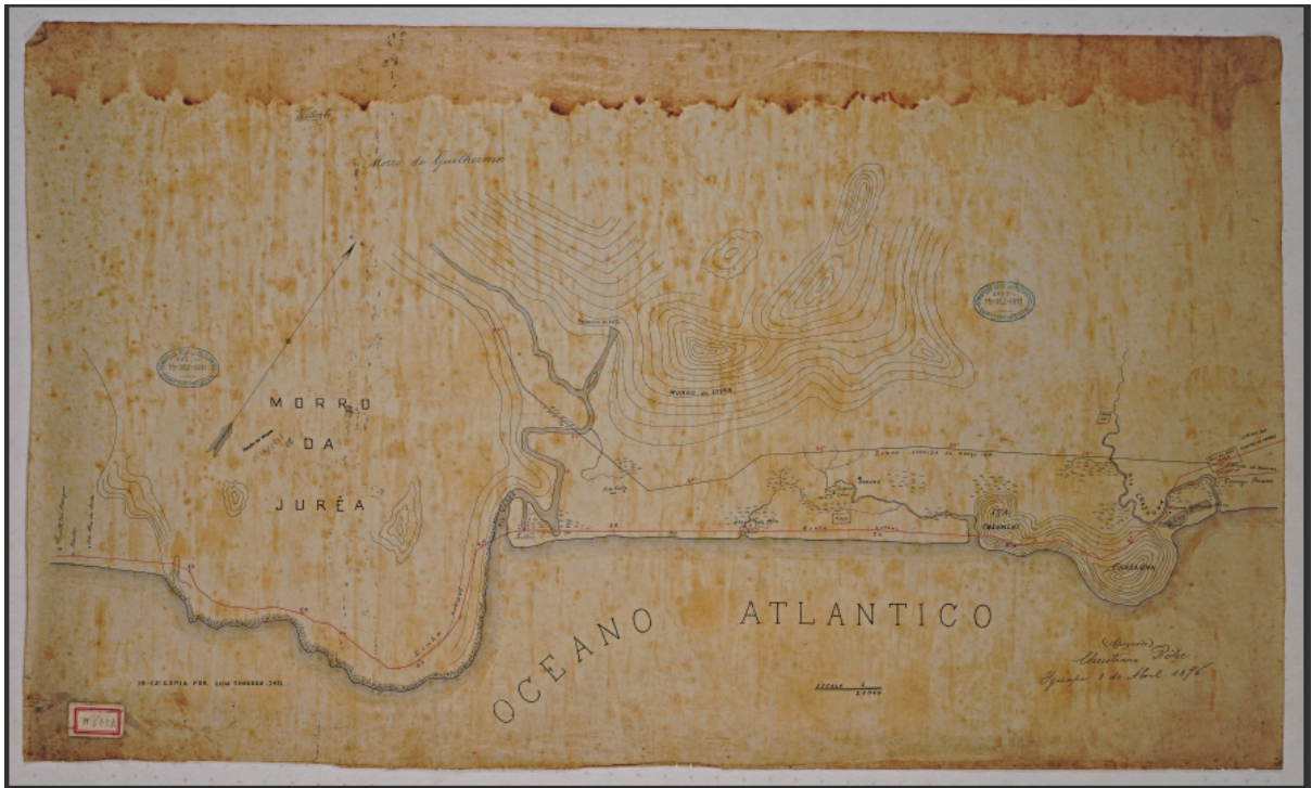
FIGURE 3 - Mapa do ano de 1876 das localidades da Juréia.

dos saberes tradicionais, como os benzimentos, por exemplo. Assim afirmo que os ambientalistas e o estado de São Paulo são os intrusos no território tradicionalmente ocupado pelas comunidades caiçaras a aproximadamente 200 anos, ou, pelo menos, desde 1876 onde já haviam moradias e roças de mandioca nas comunidades Grajaúna e Rio Verde, como podemos observar no mapa abaixo.