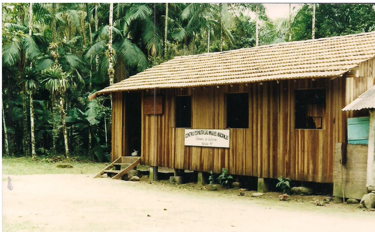
FIGURE 5 - Lar Centro Espírita São Miguel Arcanjo na Cachoeira do Guilherme.

dentre os festejos os mais conhecidos eram o de São Miguel Arcanjo (29/Setembro), São João (24/Junho) e, o dia 25 de Março (dia em que Jesus Cristo fora concebido) que era exclusivamente data de orações, onde também aconteciam os batizados das crianças das comunidades da Juréia.