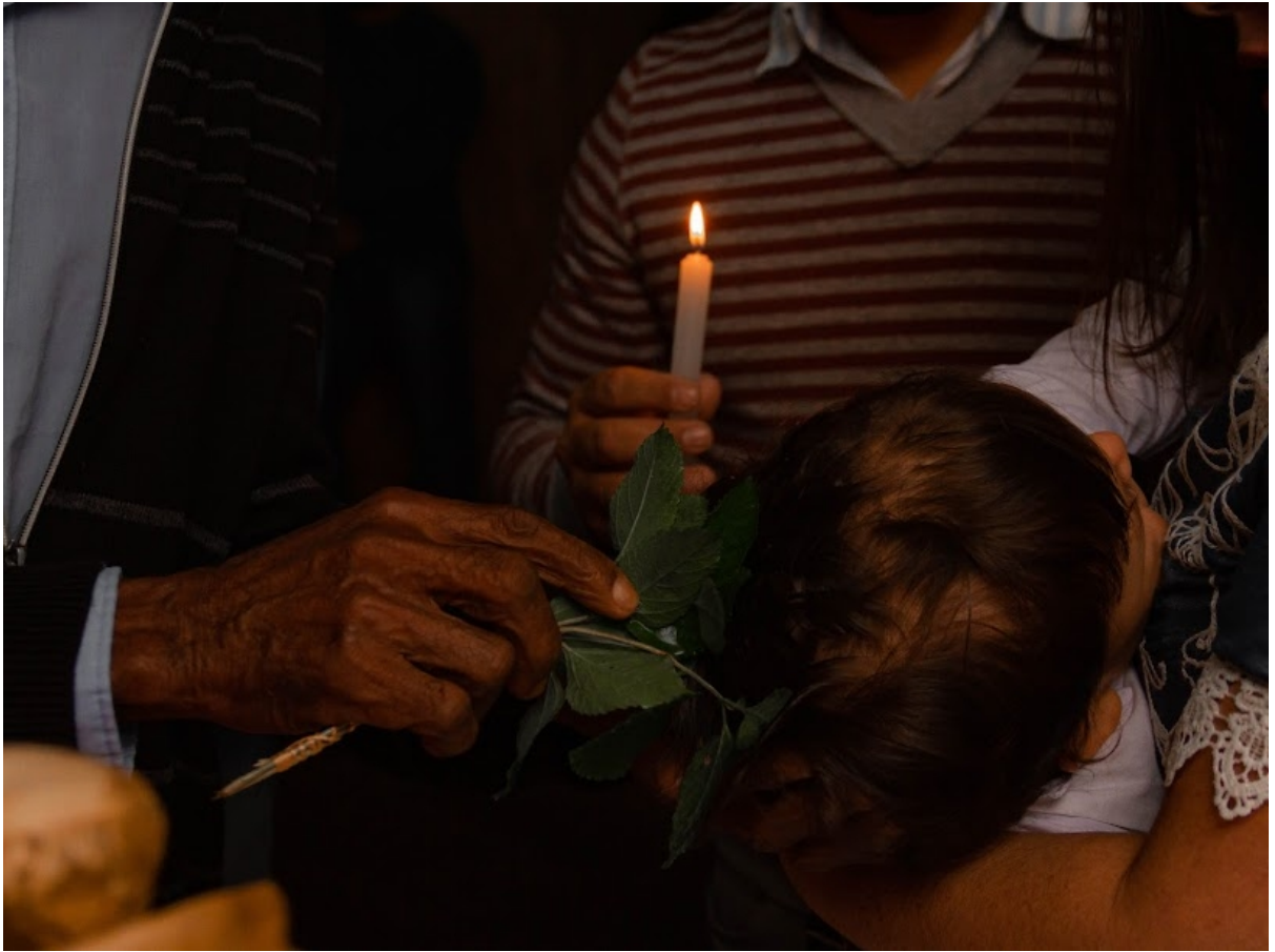
FIGURE 7 - Batizado realizado por benzedeiro da Juréia.