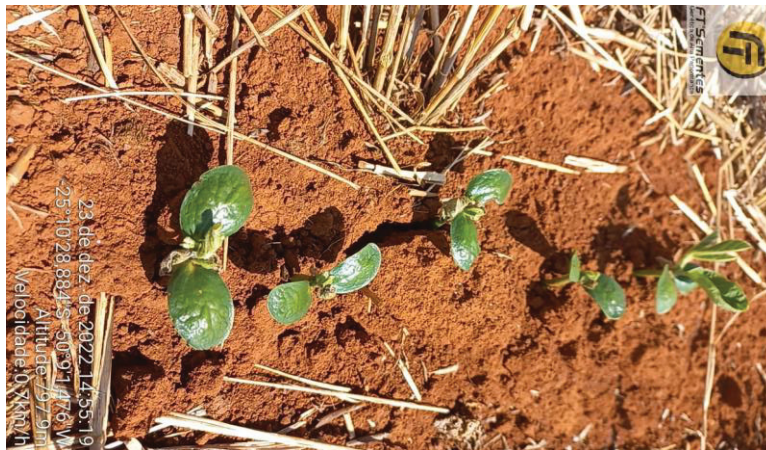
Figura 01. Injúrias causadas pelo herbicida Kyojin (Piroxasulfona + flumioxazina)

As linhagens que apresentaram maior porcentagem de injúria na avaliação de 7 dias após a aplicação foram as tratadas com Piroxasulfona + flumioxazina e Imazetapir+ Flumioxazina, isso se dá pelo fato desses herbicidas possuírem a presença da molécula flumioxazina em sua composição a qual é considerada de contato, como a aplicação foi realizada 3 dias após o plantio das linhagens e as condições de germinação estavam boas, com umidade e temperatura elevadas, a semente já estava em processo de germinação entrando em contato com o produto e sofrendo a injúria como representada na figura 01. A linhagem FTX04 foi a que mais apresentou danos iniciais na presença dos herbicidas.