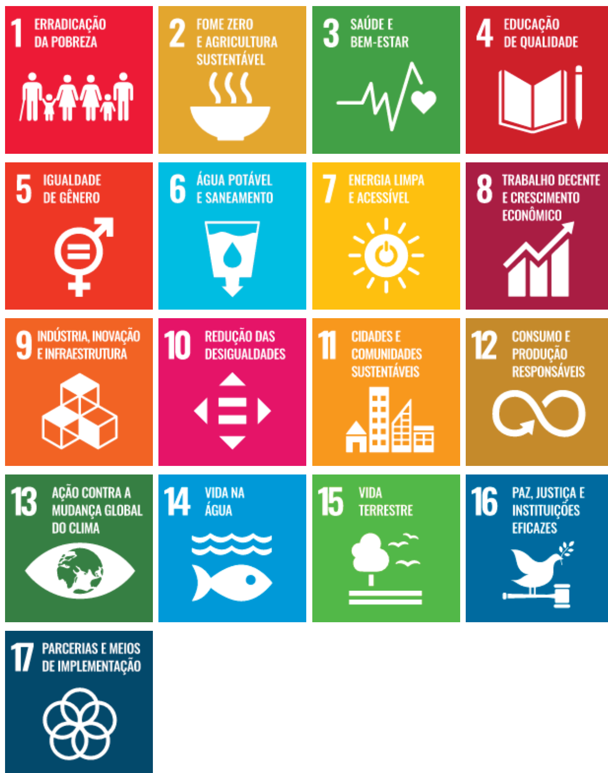
Figura 2 17 Objetivos de Desenvolvimento Sustentável ODS.