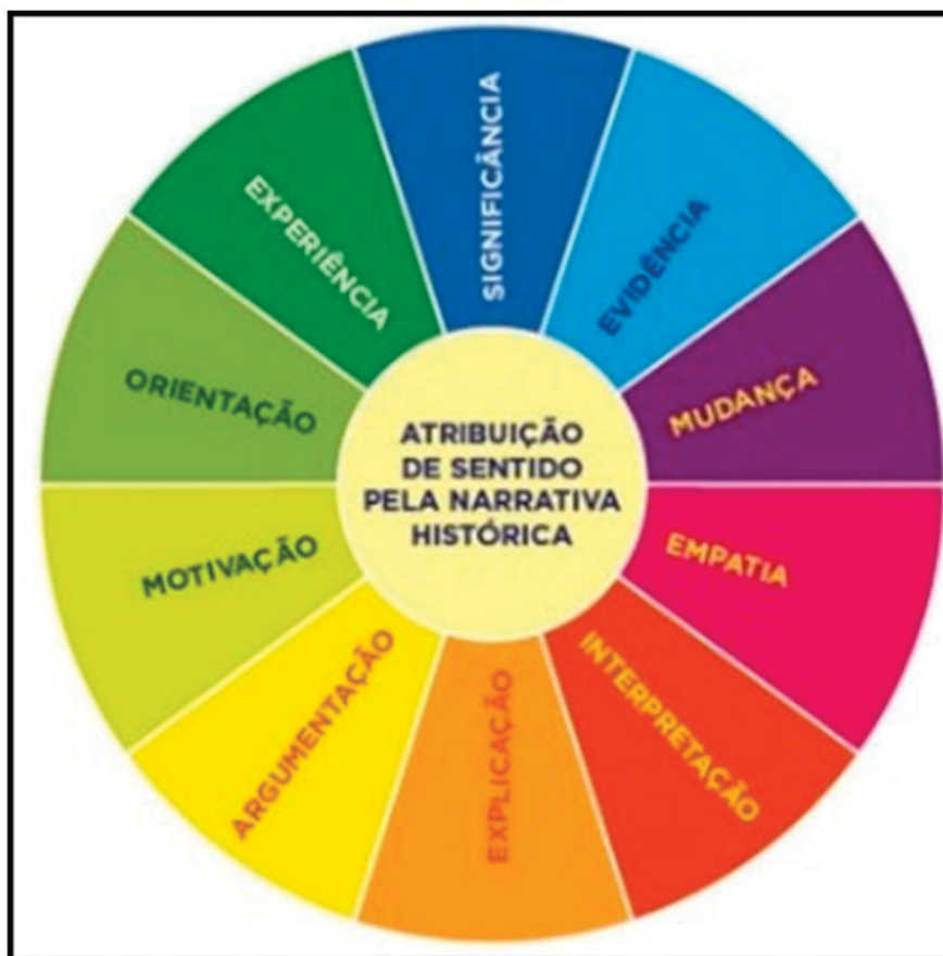
QUADRO 3 - MATRIZ: COMPETÊNCIAS DO PENSAMENTO HISTÓRICO