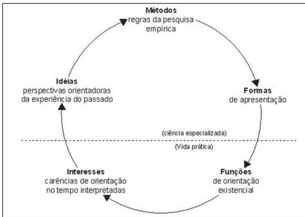
QUADRO 1 - PRIMEIRA MATRIZ DE JÖRN RÜSEN