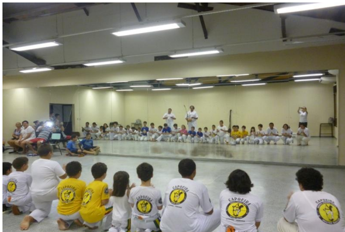
Imagem nº 11, Capoeira Centro Cultural UFPR Setor Litoral, Matinhos- PR.