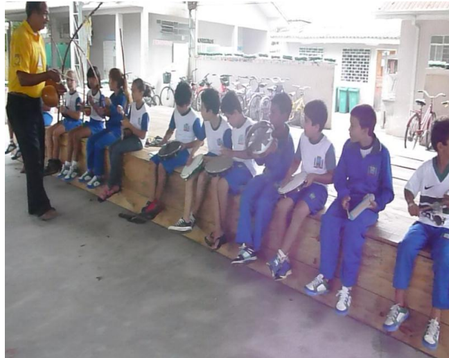
Imagem nº 20 Projeto Capoeira na Escola Oito de Maio Bairro Sertãozinho, Matinhos, PR, atividades de percussão.

Devemos levar em conta que a Capoeira não deve ser trabalhada somente atrelada aos processos corporais, sociais e culturais, más deve ser explorada em várias direções, principalmente trilhar no caminho da valorização e o respeito na diversidade. Sabemos que é nesta fase da vida que construímos as amarras que nos prendem no decorrer da vida.