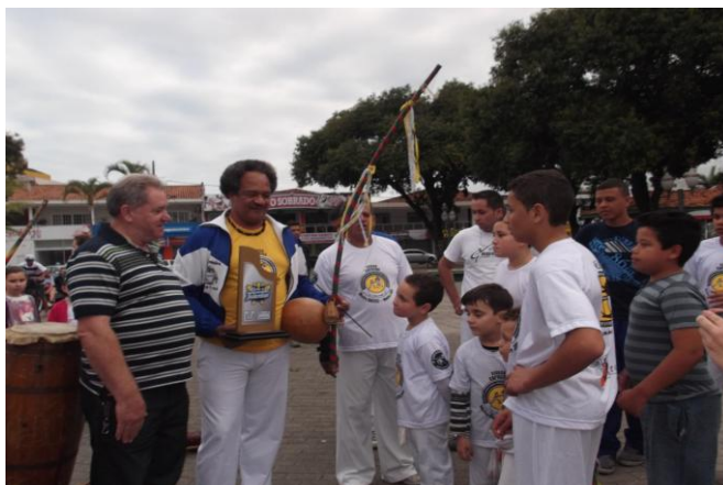
Imagem nº 15, Secretário de Educação de Matinhos entrega troféu as crianças do Projeto Capoeira na escola, dia do talento infantil.