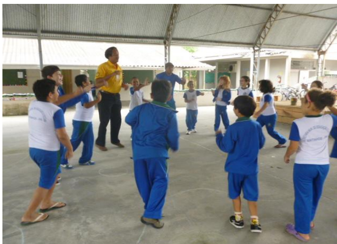
Imagem nº 22, Projeto Capoeira na Escola Oito de Maio Bairro Sertãozinho, Matinhos-PR, atividades lúdicas.

Sendo encarada como lúdica e instrucional, a Capoeira articula atividades de desenvolvimento viso-motor, artístico e social, levando a criança a estabelecer relações a partir dela própria, fato que torna a Capoeira multidirecional, uma vez que permitirá, desde que adequadamente conduzida, desenvolver na criança noções de equilíbrio e disciplina. (SANTOS, 2001, p.125).