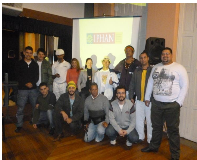
Imagem nº 26, membros do grupo gestor, Sede do IPHAN-PR (Instituto do Patrimônio Histórico Artístico Nacional).

Atualmente respondo pela Presidência da associação de Capoeira Zoeira Nagô. Coordenador do Projeto Capoeira nas Escolas no Município de Matinhos, PR.