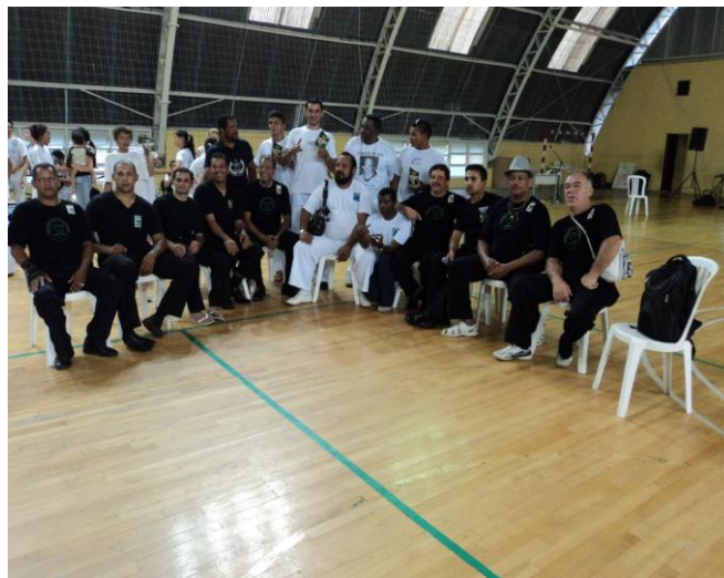
Imagem nº 08, Curso de Especialização, Padronização e Organização Desportiva para Capoeira, Curitiba- PR.

Em 2006, concluí o curso de formação técnica para arbitragem, nível nacional com a intenção de entender e compreender o universo da organização desportiva que envolve a Capoeira. Preocupado com o rumo que a Capoeira estava tomando como esporte, decidi buscar informações que me proporcionasse conhecimento suficiente para que pudesse estar atuando no campo do desporto como árbitro, mesário, ritmista bem como preparar o material para sumulas e painéis de pontuação.