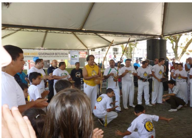
Imagem nº 16, Praça Central em Matinhos, 1ª Mobilização para implantação do Projeto Capoeira nas Escolas Estaduais do Paraná.

Em 2014, fui aprovado no vestibular da Unopar (Universidade do Norte do Paraná) e ingressei no curso de licenciatura em Educação Física, com o intuito de trabalhar o conhecimento científico corporal para que no futuro possa articular a arte e a educação física, dentro do contexto Capoeira, com uma visão apurada dos assuntos que envolvem a Capoeira, as linguagens artísticas e o sujeito no tempo e no espaço.