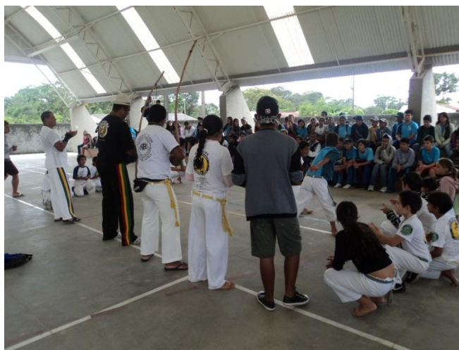
Imagem nº 14, Projeto de Aprendizagem, Escola Tereza da Silva Ramos, Bairro Tabuleiro, Matinhos, PR.

da escola manifestasse o interesse em ampliar a aplicação do projeto em período integral. Como já era de meu interesse e de alguns estudantes, expandimos o projeto para dois turnos (manhã e tarde). Com o sucesso do projeto comecei então a pensar em uma aplicação mais ampla e que atendesse a rede municipal de ensino básico deste município.