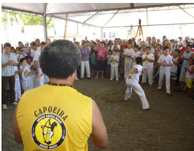
Imagem nº 17, Apresentação na visita do Governador do Estado do Paraná.