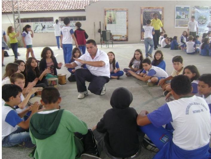
Imagem nº 23, Projeto Capoeira na Escola Wallace Tadeu de Melo, Bairro Centro, Matinhos-PR.

contexto e nessa perspectiva que o Projeto Capoeira nas Escolas municipais de Matinhos, PR, se fundamenta e se insere.