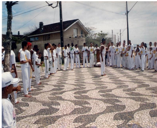
Imagem nº 05, Início dos trabalhos sociais, Roda na Praia Brava de Matinhos- PR. (1996/1999).

Em 1990 concluí o estágio de contra mestre e fui reconhecido como mestre pela comunidade capoeirística e pela Federação Paranaense de Capoeira.