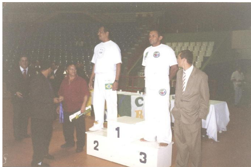
Imagem nº 07, Campeonato Brasileiro, São Paulo-SP, Ginásio do Ibirapuera.

Em 2004, coordenei a inserção da Capoeira na cidade Pomerode, SC 6 , um processo difícil onde a cultura alemã predomina. Más valeu a pena, hoje a Capoeira naquela cidade é uma realidade e faz parte das atividades do calendário local.