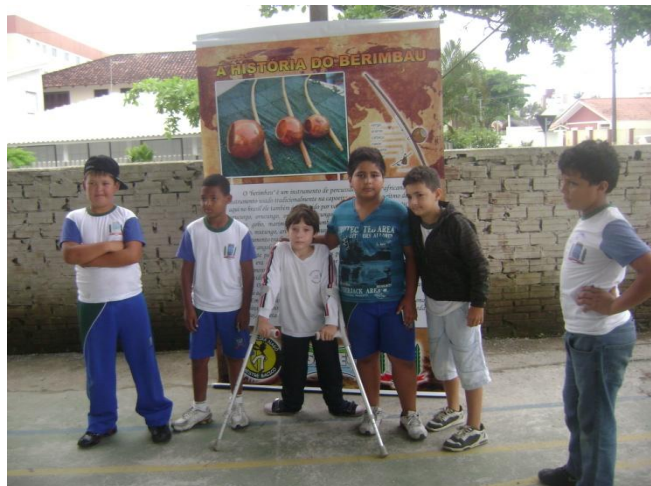
Imagem nº 21, Projeto Capoeira na Escola Wallace Tadeu de Melo, Bairro Centro, Matinhos- PR.

Devemos levar em conta que a Capoeira não deve ser trabalhada somente atrelada aos processos corporais, sociais e culturais, más deve ser explorada em várias direções, principalmente trilhar no caminho da valorização e o respeito na diversidade. Sabemos que é nesta fase da vida que construímos as amarras que nos prendem no decorrer da vida.