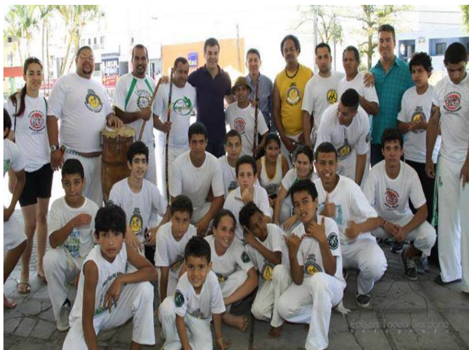
Imagem nº 18, ao fundo o Governador do Paraná Carlos Alberto Richa e o Prefeito de Matinhos Eduardo Antonio Dalmora, em evento na Praça Central de Matinhos.

Em 2014, enviei a proposta para um grupo político da esfera estadual, que se comprometeu em estudar e enviar à assembleia legislativa, para apreciação e também discutir a possibilidade de aprovação e implantação do Projeto Capoeira nas Escolas na rede Estadual de Ensino do Paraná embasado na lei 10639/03. Nesta foto é possível visualizar ao fundo usando uma camisa azul escuro, o governador do Estado do Paraná e a sua esquerda com a camisa azul claro, o prefeito do município de Matinhos e mais a esquerda com a camisa verde está o vereador do município de Matinhos. Os diálogos são aleatórios, pois sabemos que o período é muito delicado por ser ano eleitoral, por isso devo ter todo o cuidado com promessas políticas que possam atrapalhar o projeto, não quero que o projeto seja um produto negociável, apenas quero que se faça cumprir a lei 10.639/03 em toda a sua plenitude.