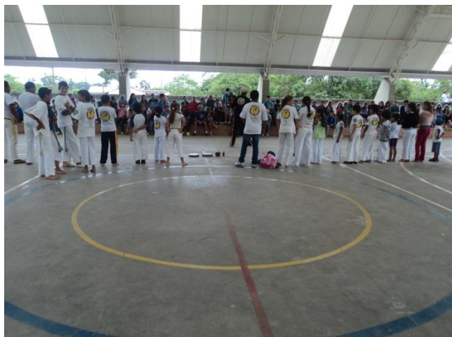
Imagem nº 13, Projeto de Aprendizagem, Escola Tereza da Silva Ramos, Bairro Tabuleiro, Matinhos-PR.

Iniciei a aplicação do Projeto Capoeira na Escola, (Projeto de Aprendizagem) em 16 de setembro de 2011, no Colégio Estadual TEREZA DE SILVA RAMOS, no Bairro do Tabuleiro em Matinhos, PR.