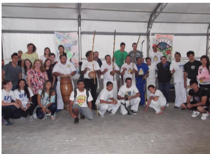
Imagem nº 10, Interação Culturais e Humanísticas, UFPR setor litoral, Matinhos-PR.

Em 2010, iniciei o curso Licenciatura em artes e logo percebi que as linguagens artísticas me fascinavam cada vez mais, eu começava a pensar uma forma diferente de trabalhar a Capoeira e relacionava as linguagens artísticas com o meu trabalho. Sendo arte - educador, pretendo contribuir com atividades transversais na escola sem o compromisso e obediência aos conteúdos impostos pelo sistema educacional.