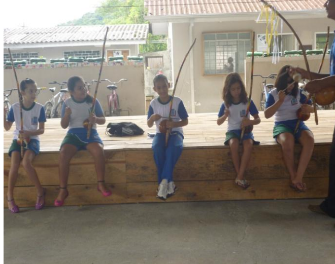
Imagem nº 25, Projeto Capoeira na Escola Oito de Maio Bairro Sertãozinho, Matinhos, PR.

Semana da consciência negra 20 de novembro de 2013, nesta atividade alunos e professores interagiram fazendo uso dos instrumentos musicais usados na Capoeira, fazendo uma grande orquestra produzindo ruídos organizados e desorganizados, sendo o objetivo principal trabalhar a paisagem sonora.