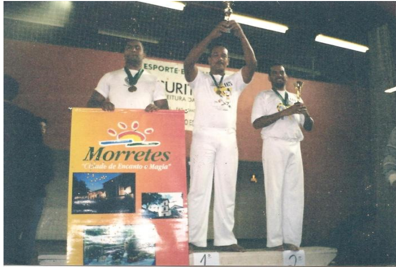
Imagem nº 06, Campeonato Paranaense, Curitiba-PR, Ginásio Osvaldo Cruz.