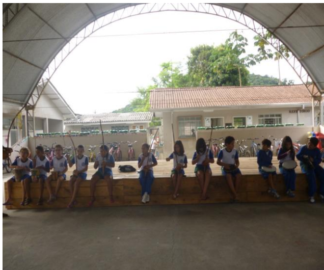
Imagem nº 12, Projeto Capoeira na Escola Oito de Maio, atividade de musicalização.

sujeito, enfim trabalho a Capoeira utilizando o fundamento teórico prático adquirido no curso de licenciatura em artes. Com relação a importância pedagógica, numa concepção didática, consideramos a Capoeira uma atividade física completa, pois atua de maneira direta e indireta sobre os aspectos cognitivo, afetivo e motor. (Santos, 2001, p.125).