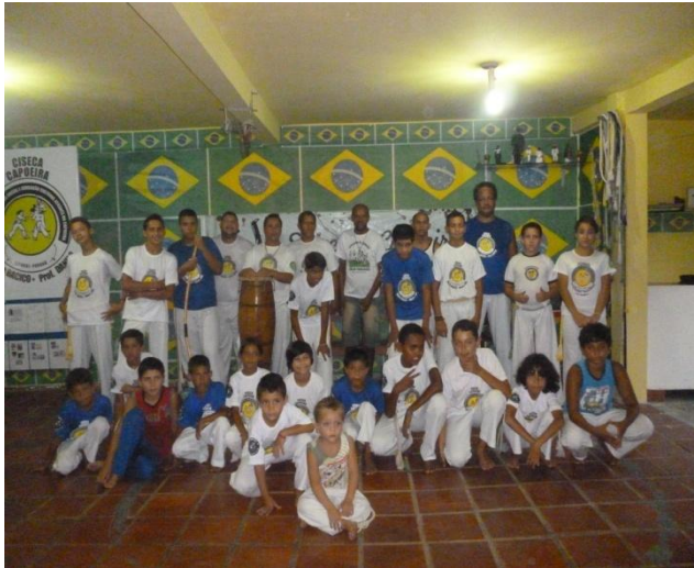
Imagem nº 09, Sede do Projeto Ciseca (Centro de Integração Social e Educação cultural Através da Capoeira) Bairro Vila Nova, Matinhos-PR.

EM 2008, iniciei apresentações, oficinas e palestras sobre a importância da Capoeira nas escolas municipais e Estaduais no município de Matinhos. Esta experiência me fez refletir a importância da inclusão da lei 10.639/03 nos currículos escolares. Descobri que até os dias de hoje, ainda se prega na escola, a história contada pelo opressor, que o Brasil foi descoberto e que os nativos se deixaram enganar por pedaços de vidros espelhados e outras especiarias.