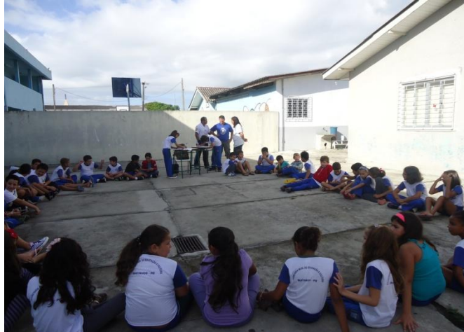
Imagem nº 19, Projeto Capoeira na Escola, Monteiro Lobato balneário Rivieira, Matinhos, PR.

O Projeto Capoeira nas Escolas no município de Matinhos, PR, abre um caminho para a cultura popular e o esporte, pois ao mesmo tempo em que as crianças estiverem aprendendo a Capoeira como cultura e ainda estarão envolvidos com o esporte e o lazer e alimentando a construção do conhecimento. Segundo Santos (2001, p.125): “Como instrumento educacional, a capoeira contribui para o desenvolvimento da capacidade física, intelectual e moral da criança, bem como do ser humano em geral, visando sempre a sua socialização e integração a sociedade.”