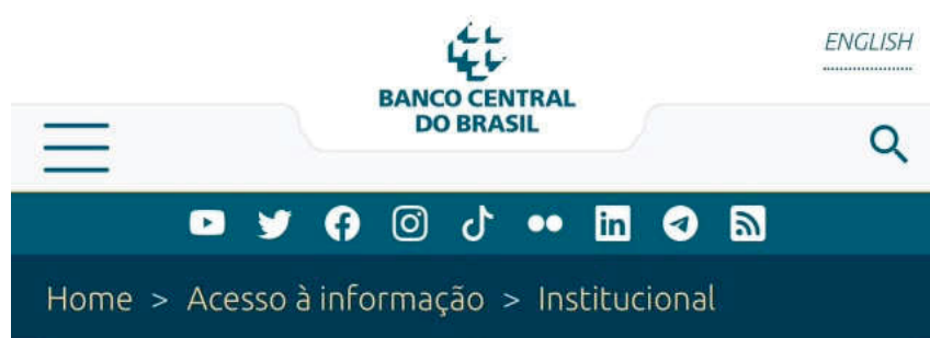
Figura 3 – Missão do Banco Central

Garantir a estabilidade do poder de compra da moeda, zelar por um sistema financeiro sólido, eficiente e competitivo, e fomentar o bem-estar econômico da sociedade.