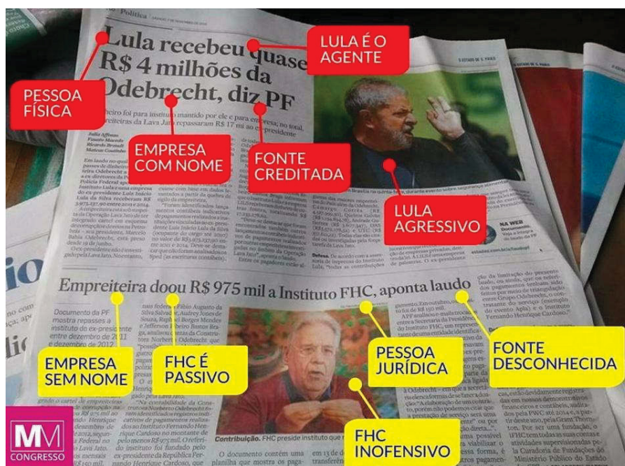
FIGURA 2 – FINANCIAMENTO DE CAMPANHA