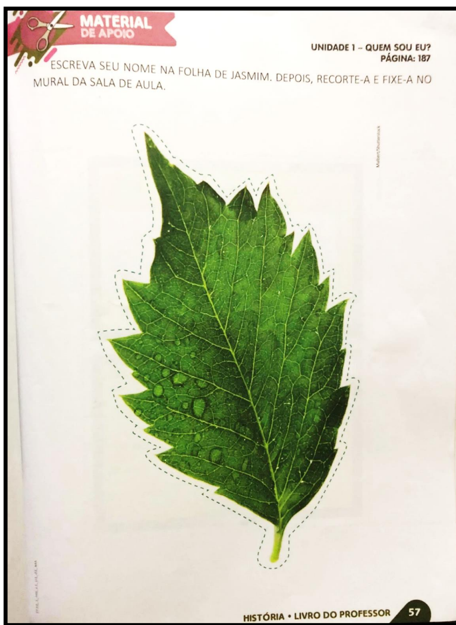
ILUSTRAÇÃO 1: ATIVIDADE FOLHA DE JASMIM