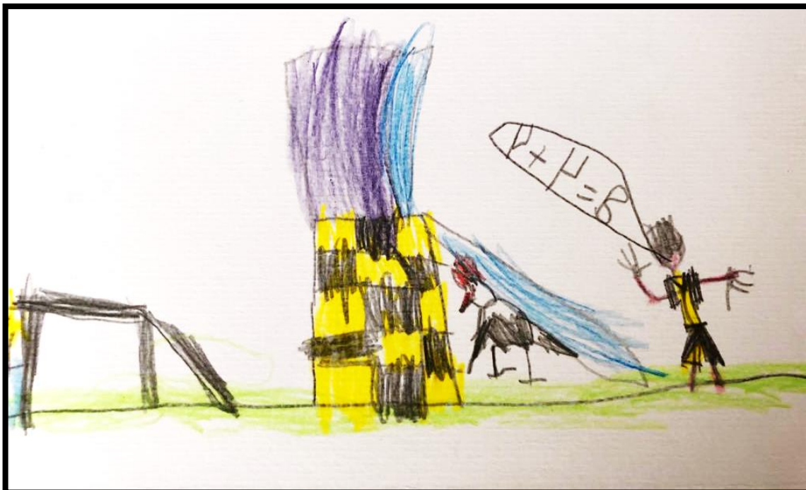
ILUSTRAÇÃO 2 – REPRESENTAÇÃO DA ESCOLA DA EDUCAÇÃO INFANTIL (PARTICULAR)

No primeiro desenho tem-se a representação da escola particular pelos olhos de uma criança de 5 anos, ele se desenhou no parque, onde disse ser um dos seus lugares preferidos na escola: