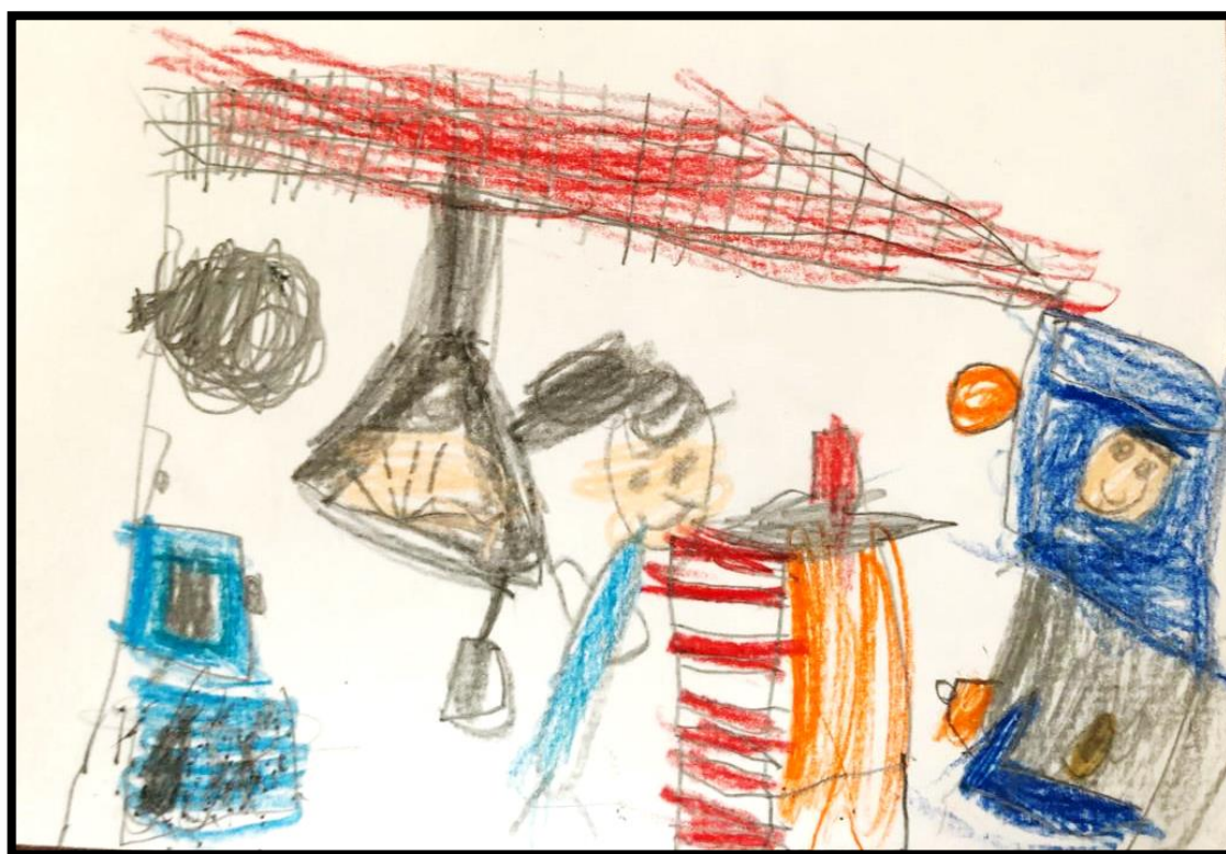
ILUSTRAÇÃO 3 – REPRESENTAÇÃO DA ESCOLA DA EDUCAÇÃO INFANTIL (PÚBLICA)

“Era um balde de brinquedo, aí tinha uma escadinha pra brincar e entrar, e tem uma gavetinha pra guardar brinquedos, mais uma gavetinha, tinha muitos brinquedos lá, eu brincava muito lá e tinha muita música, todo dia, eu gostava, tinha até na hora do almoço.” (Aluno 1)