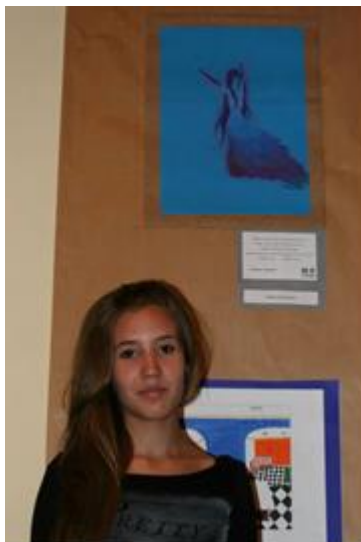
1ª Mostra Litorarte