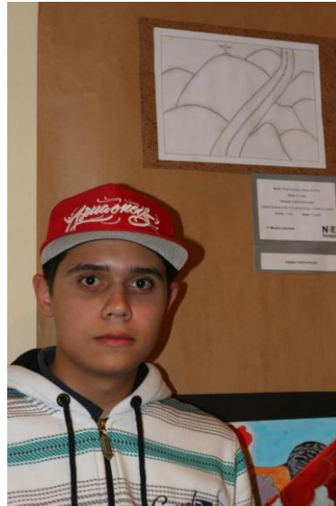
1ª Mostra Litorate Fonte: O autor (2013)