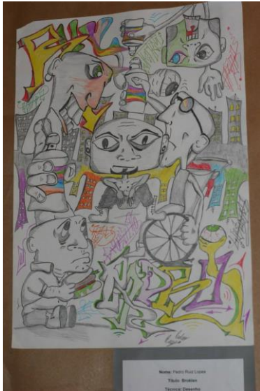
1ª Mostra Litorarte

No ano de 2013, alunos orientados por mim, participaram da 1ª Litorarte – Mostra de Artes Visuais, promovida pelo Núcleo Regional de Educação de Parana-guá, sendo 4 alunos premiados.