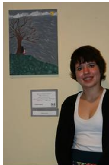
1ª Mostra Litorarte