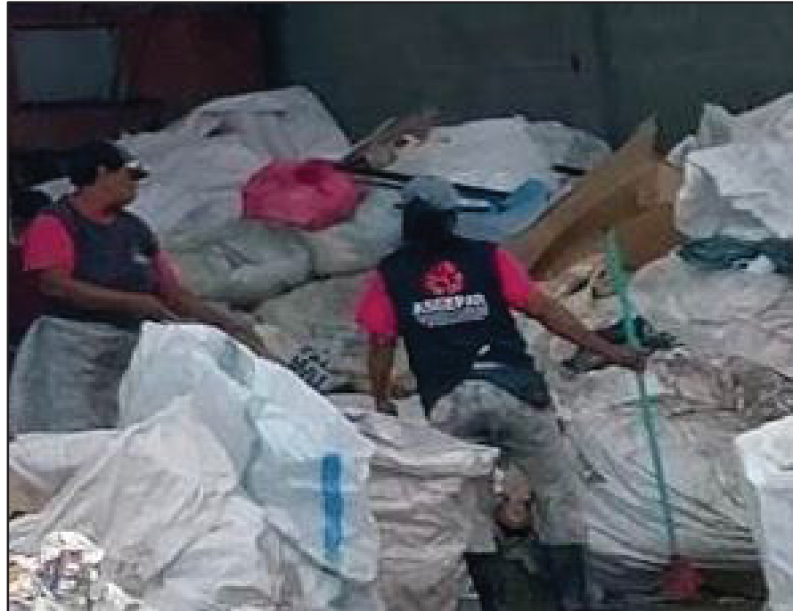
IMAGEM 2 – SIGLA DA ASSOCIAÇÃO NO UNIFORME DE UMA ASSOCIADA