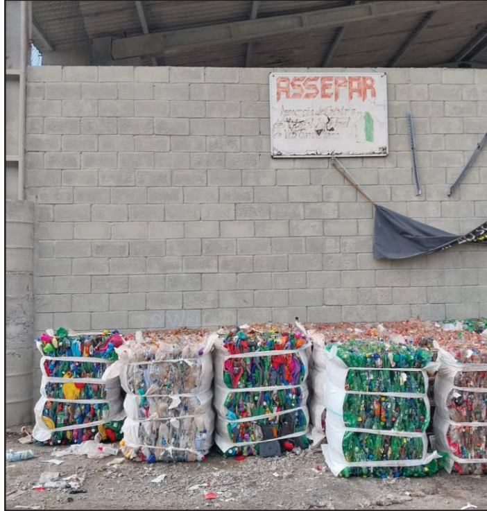
IMAGEM 1 - PLACA IDENTIFICANDO A ASSOCIAÇÃO.