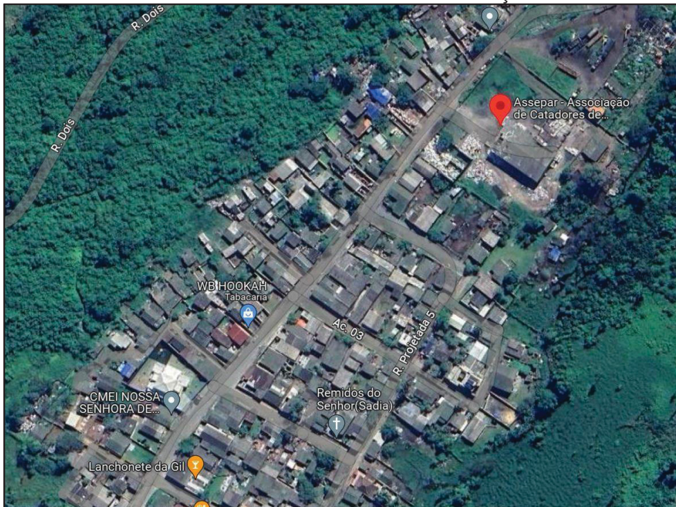
IMAGEM 3 - MAPA DA VILA SANTA MARIA E LOCALIZAÇÃO DA ASSEPAR

O bairro Vila Santa Maria foi uma das ocupações que teve adensamento populacional por consequência da desvalorização territorial decorrente da proximidade do “antigo lixão do Imbocuí” (IMAGEM 3). Em 2011, a população residente no Bairro estava “ligada à economia do lixo, obtendo renda a partir do processo de catação, separação e venda de resíduos urbanos” (PARANAGUÁ, 2011, p. 133). Sendo neste Bairro que se localiza a ASSEPAR.