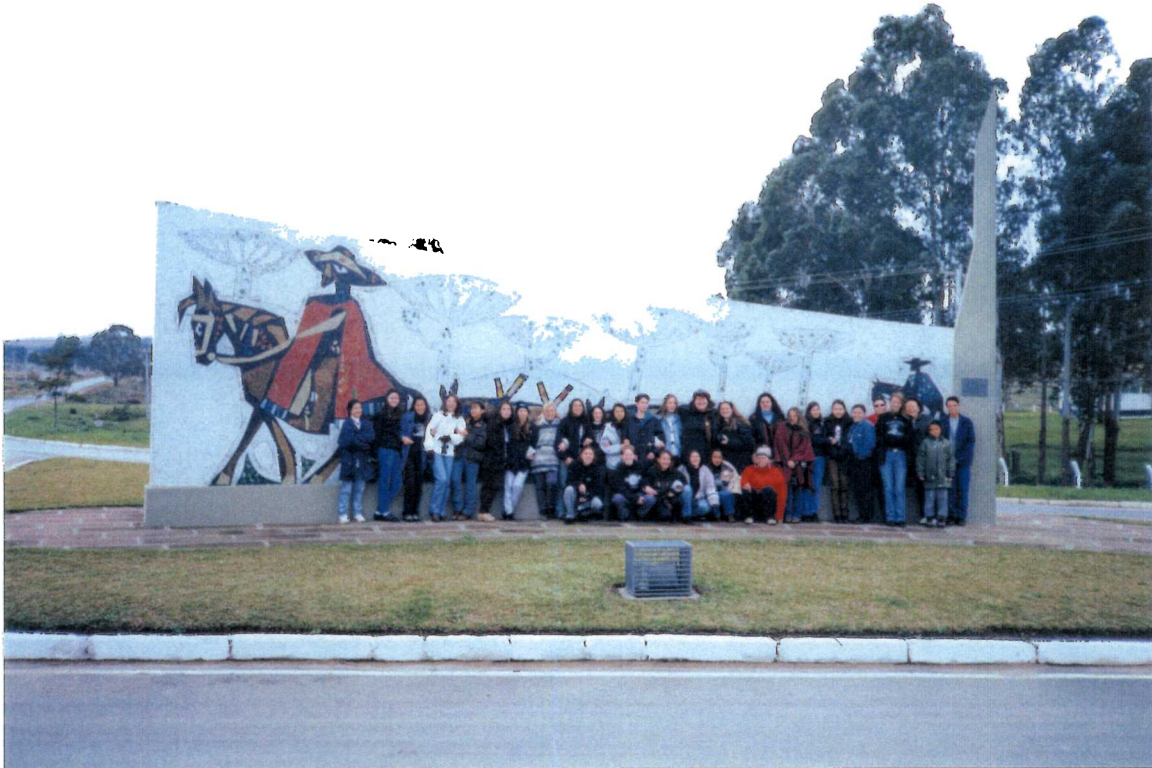
Foto 2- Monumento ao Tropeiro – Lapa