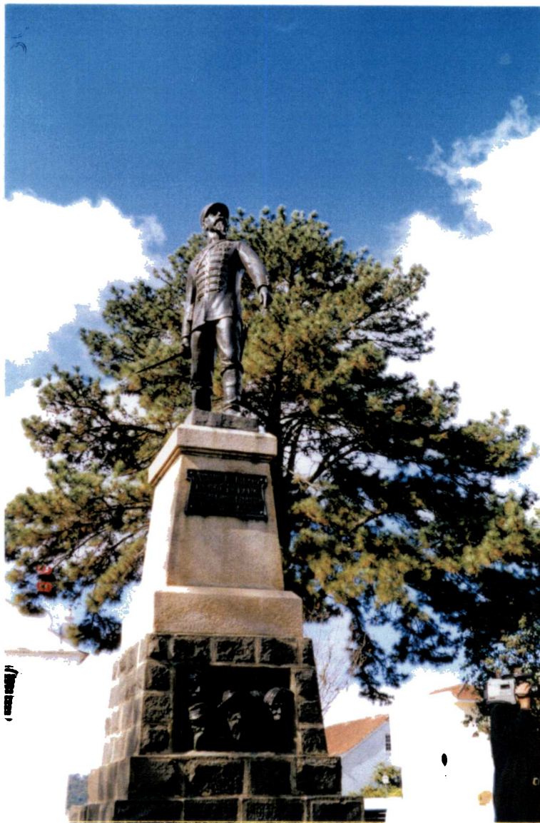
Foto 5- Monumento do General Carneiro – Lapa