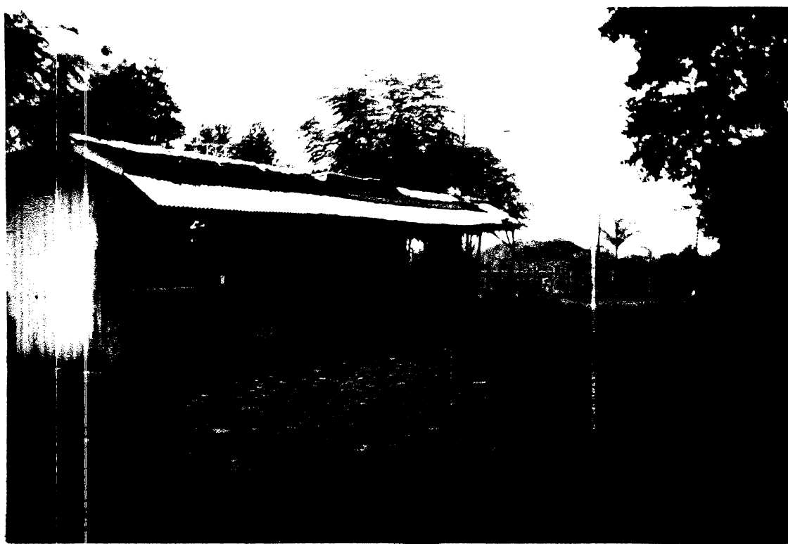
Figura 8 – Vista panorâmica do "Vale do Diabo", tendo ao fundo o Viaduto sobre "O Vale do Diabo" com a cidade de Santa Maria.