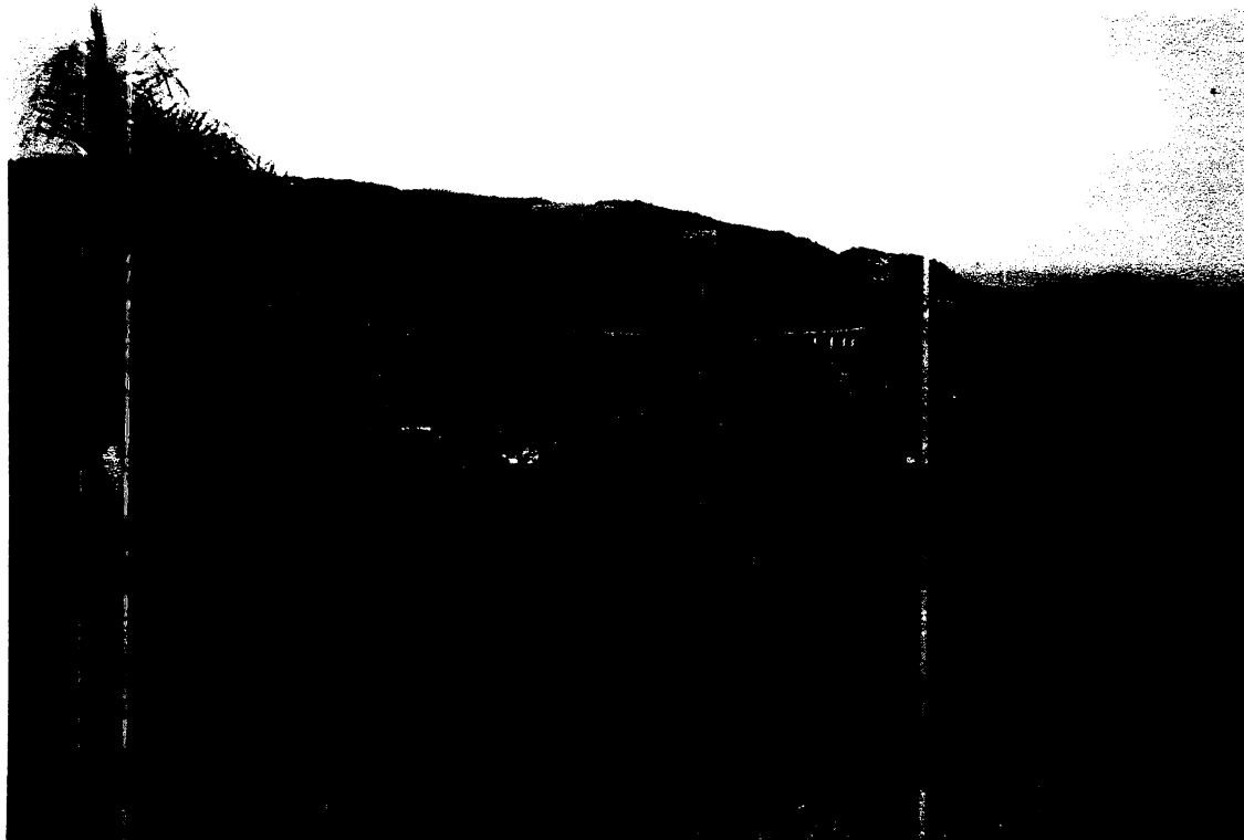
Figura 9 – Bar e Lanchonete "Ponto da Cana", localizado as margens da Estrada do Perau Velho