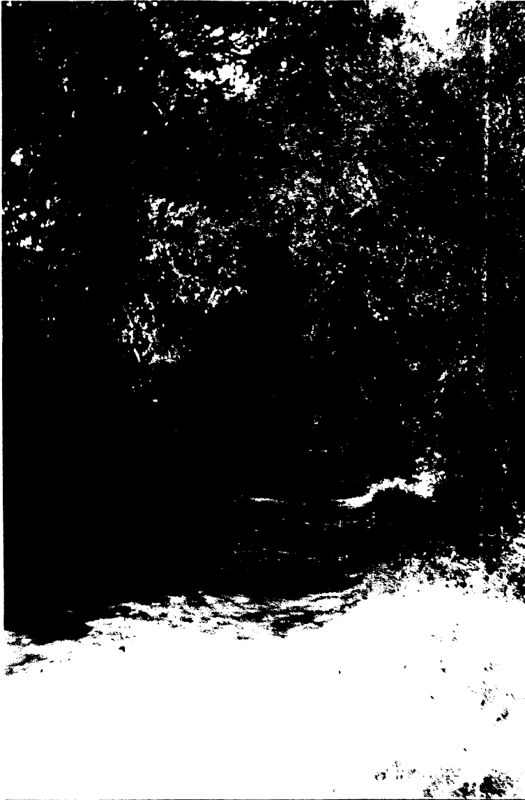
Figura 2– Vista de um caminho vicinal entre a mata nativa.