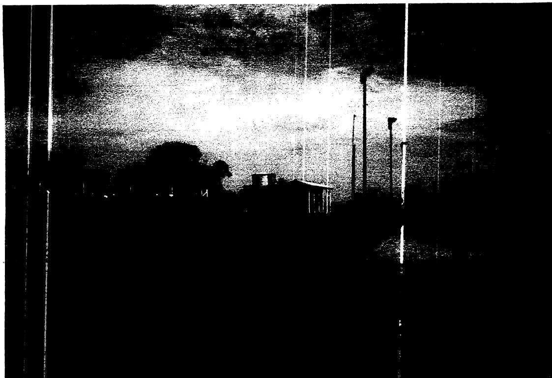
Figura 6 – Quadra Copetti de Futebol