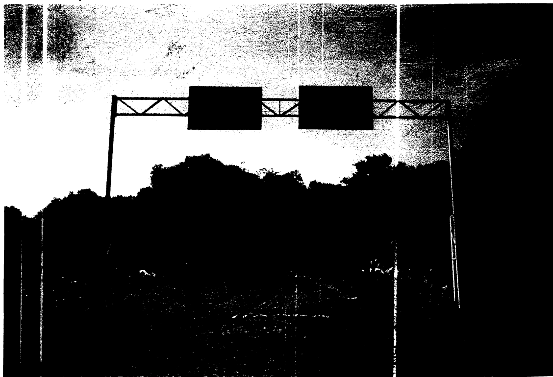
Figura 3 – Pórtico que limita as fronteiras dos dois municípios.