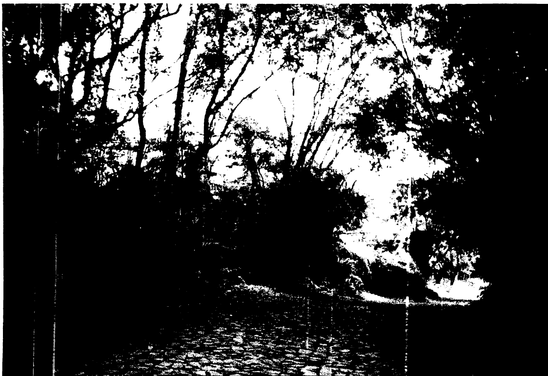
Figura 5– Foto estrada onde se visualiza as pedras originais do século XIX.