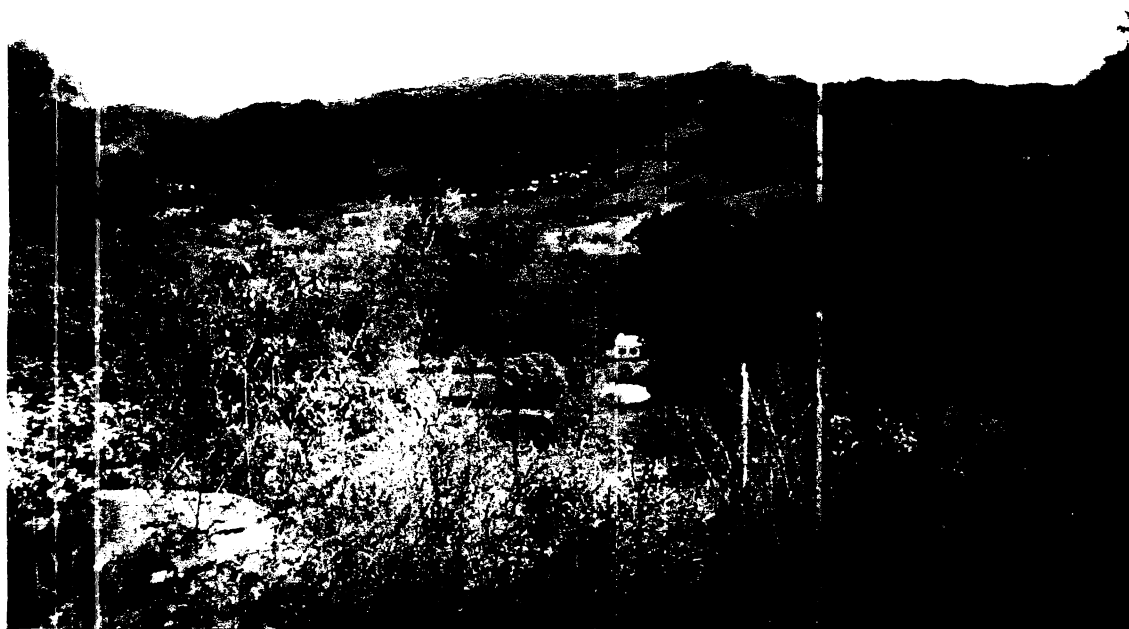
Figura 1– Foto de uma propriedade do local, com vista do relevo e vegetação.