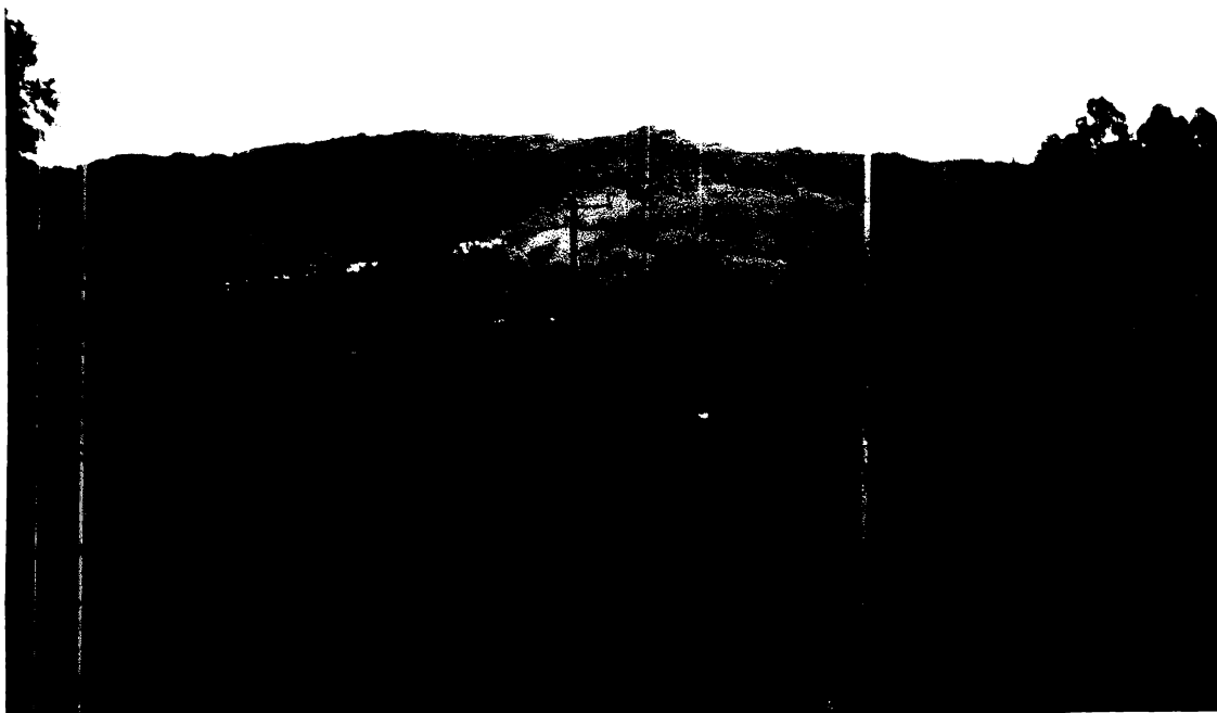
Figura 4 – Foto estrada onde se visualiza as pedras originais do século XIX.