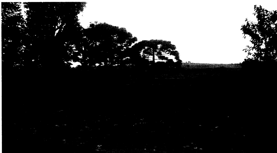
Por esta porteira as famílias adentraram a fazenda – área onde foram assentadas.

Foi sobre forte neblina que no dia 24 de junho de 1988 chegamos e entramos na área, vindos dos diferentes grupos do acampamento. Éramos famílias que já tínhamos uma trajetória conjunta de mais de três anos no acampamento e que trazíamos um acúmulo de discussão e amadurecimento ao chegarmos na área. O outro grupo de famílias, que vieram de comunidades do interior do município não tinham a vivência de coletivo. Algumas dessas foram de certa maneira trazidas ao assentamento como forma das comunidades “se livrarem” das mesmas, uma vez que eram extremamente pobres, com muitos filhos e com vários problemas em decorrência do processo de exclusão a que foram submetidas. (MST, 2000, p. 8)