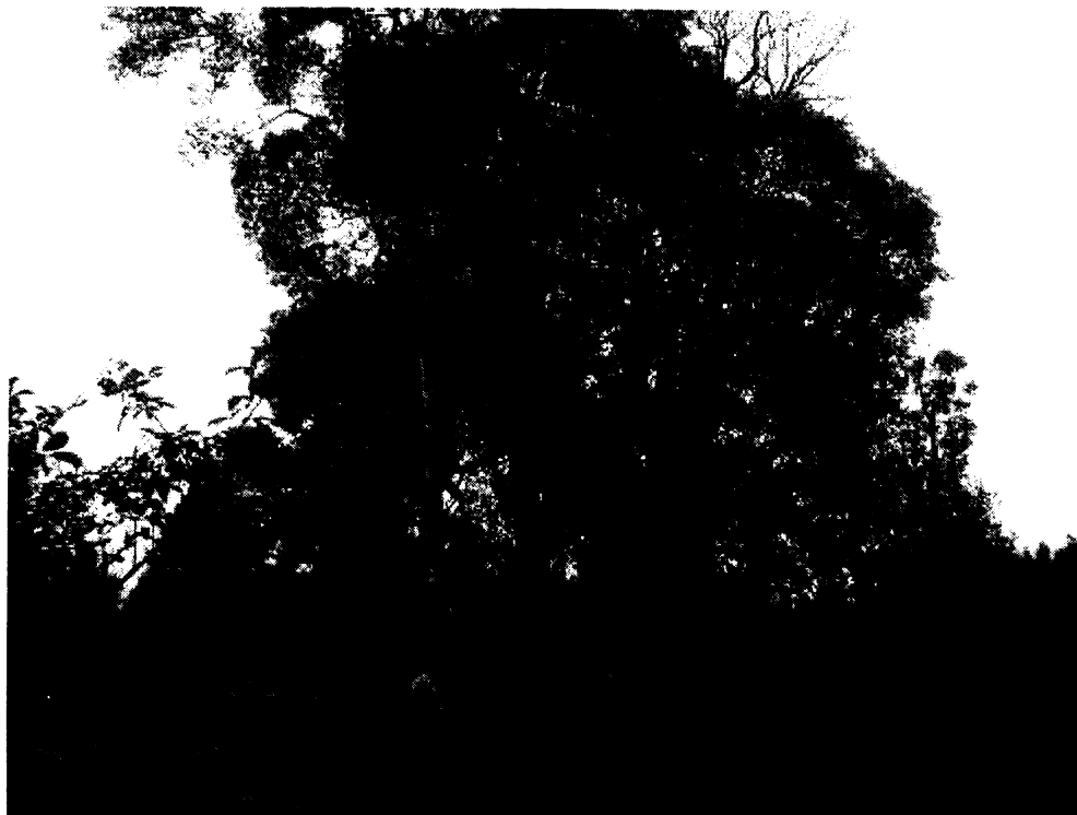
Foto da árvore cambuatã. São 4 árvores próximas uma das outras.

Este relato deixa claro que mostrar a árvore aos visitantes significa também apresentar a história das famílias e onde se deu a sua experiência religiosa. A árvore transcende ao que ela significa: planta. Olhar para ela é passar do visível para o invisível.