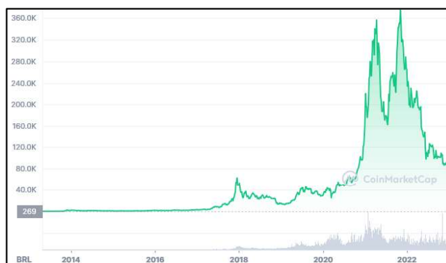
FIGURA 1 – GRÁFICO DA COTAÇÃO HISTÓRICA DO BITCOIN

A relação entre a variação positiva da cotação do bitcoin e a euforia em torno da moeda é empiricamente demonstrável, tanto pelo aumento do número de relações jurídicas nesse período, como acima citado, como pelo aumento da procura em geral pela criptomoeda, que também cai conforme a cotação é abatida. Nesse sentido, compare-se o gráfico da cotação histórica do bitcoin (FIGURA 1) e o gráfico de pesquisas pelo termo “ bitcoin ” no Google (FIGURA 2):