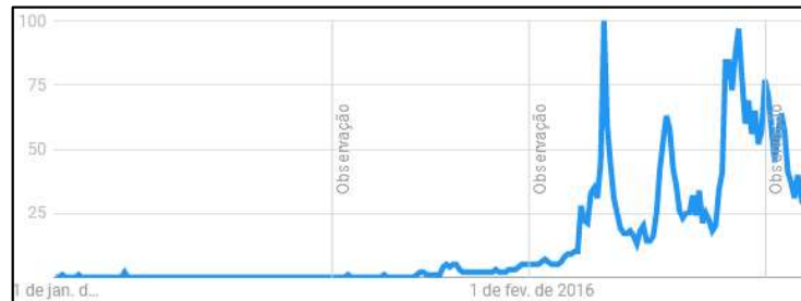
FIGURA 2 – GRÁFICO DO HISTÓRICO DE PESQUISAS PELO TERMO “BITCOIN”