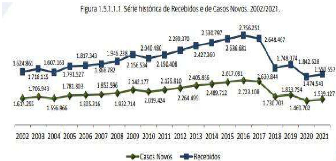
Figura 1 - Casos recebidos entre 2002 e 2021 nas Varas do Trabalho

Conforme dados extraídos do Relatório Geral da Justiça do Trabalho de 2020 26 e de 2021 27 , as figuras a seguir incorporadas à presente pesquisa comprovarão as afirmações realizadas anteriormente, mediante gráficos elucidativos das ações trabalhistas ajuizadas nas Varas do Trabalho recebidas e julgados em todo o território nacional: