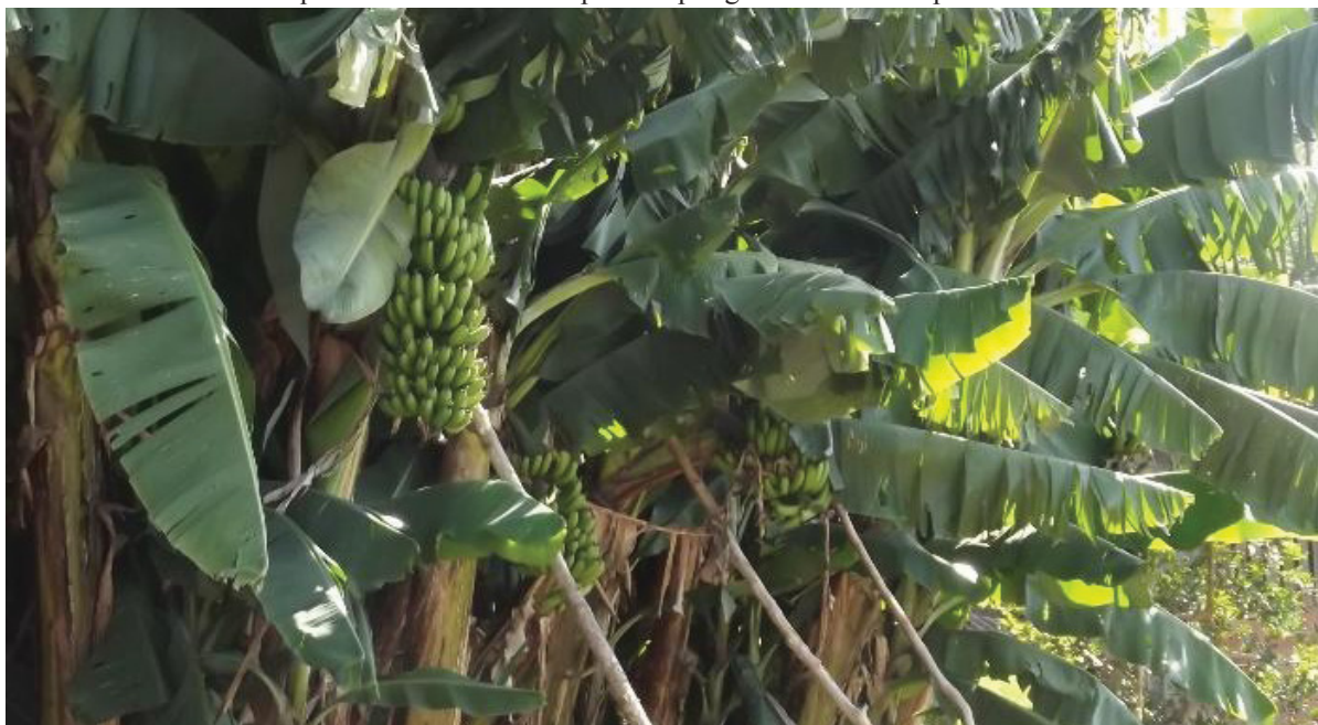
FIGURA 5: Quintal no Taquari dos Ribeiros, onde é possível observar bananeiras com cachos ainda verdes que estão ao redor do quintal. As árvores são apoiadas por galhos de imbuia para sustento de seu caule.