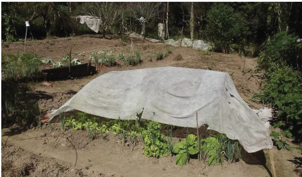
FIGURA 3: Quintal no Taquari dos Ribeiros, onde é possível observar um canteiro de alface, escarola e cebolinhas, plantados em consorciamento e cobertos por sombrite para proteção de geadas e ao fundo estão árvores de frutas.

refogado, o que puder plantar para comer, eu planto” (Marilene, Taquari dos Ribeiros, maio de 2015).