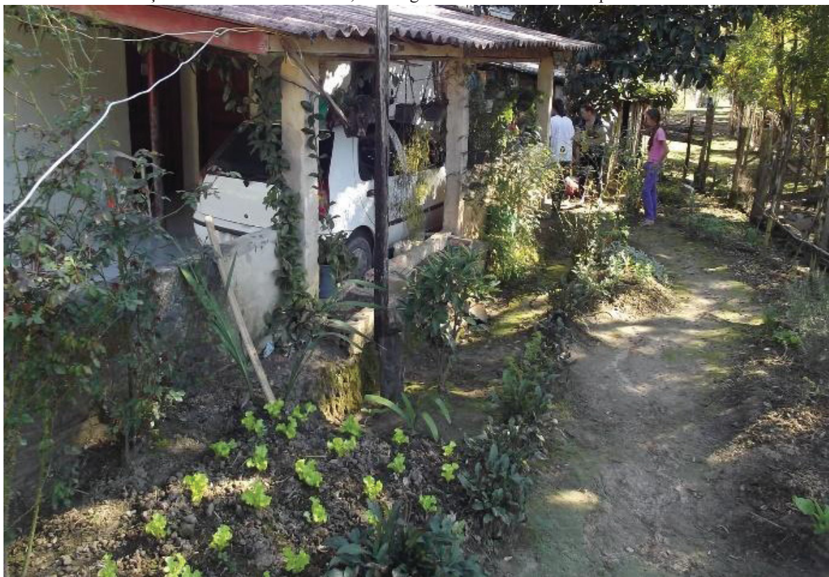
FIGURA 6: Quintal no Taquari dos Ribeiros, onde é possível observar plantação de alface, beterraba e plantas medicinais ao redor de uma garagem que conta também com plantas que crescem como cipós pelas colunas de sustentação do telhado. Além disso, na imagem observa-se vasos de plantas ornamentais.