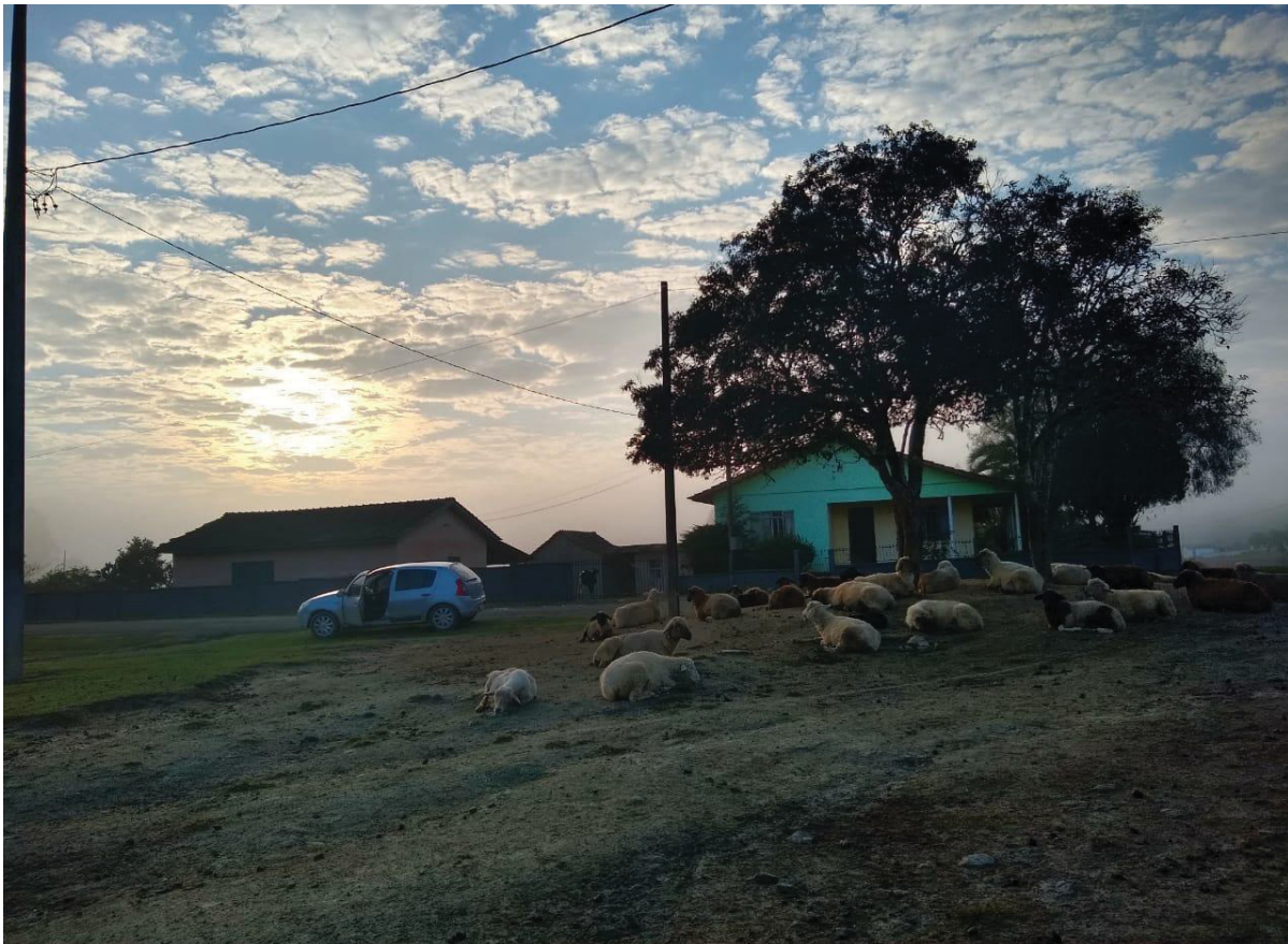
FIGURA 1: FAXINAL ÁGUA QUENTE DOS MEIRAS