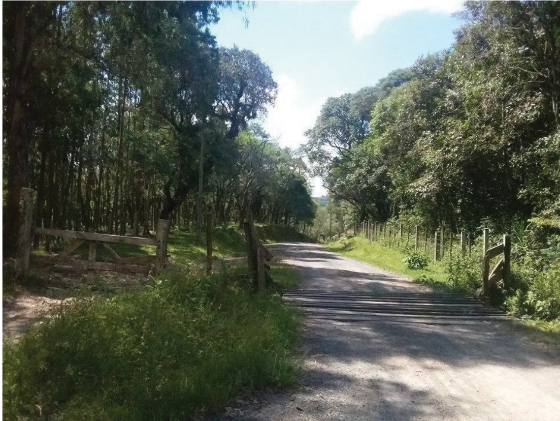
FIGURA 2: MATA-BURRO E PORTEIRA EM ÁGUA QUENTE DOS MEIRAS

especificando o que ela chama de “conjunto de códigos” construídos a partir das relações sociais que envolvem a manutenção destas e do criadouro, tratando sobre elas de maneira mais objetiva.