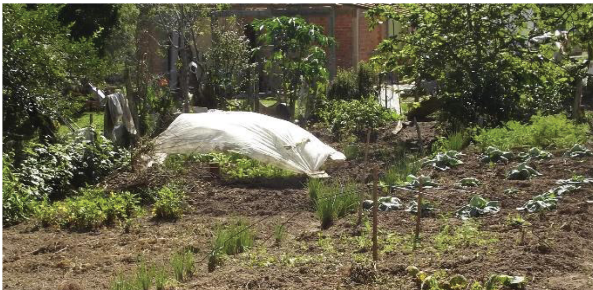
FIGURA 4: Quintal no Taquari dos Ribeiros, onde é possível observar plantação de repolhos, cebolinhas, cenoura, variedades distintas de alface (uma delas coberta por sombrite para proteção de geadas) e ao fundo árvores de frutas.