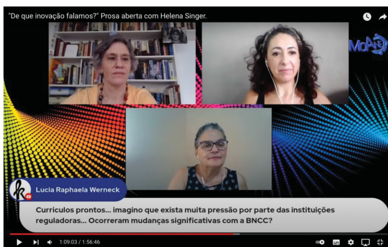
Figura 1: Registro de minha participação com o comentário-pergunta para Helena Singer.

Na prosa aberta, "De que inovação estamos falando" (2021), Helena Singer diz que na Lei de Diretrizes e Bases da Educação Nacional, a instância máxima de decisão é o conselho escolar, tendo a escola autonomia para fazer seu projeto pedagógico com o apoio da comunidade. Sobre os desafios para implementação da política nacional sobre a Base Nacional Comum Curricular 1 Helena Singer afirma que, apesar das incoerências e inconsistências, seu texto de introdução pode apoiar iniciativas inovadoras servindo como referência argumentativa para empecilhos que se façam ao desenvolvimento de alternativas educacionais democráticas: "Sim, seguimos a BNCC pois seguimos sua introdução". Na introdução da BNCC, em negrito, é afirmado que "as competências e diretrizes são comuns, os currículos são diversos ".