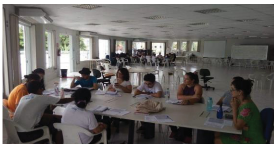
Figura 11 - Estudantes ANE

Na imagem a seguir temos o primeiro encontro do ano de 2019, na UFPR Litoral primeira atividade foi os professores nos observando como iríamos receber nossos colegas depois de 90 dias de férias e qual seria o tamanho da saudade.