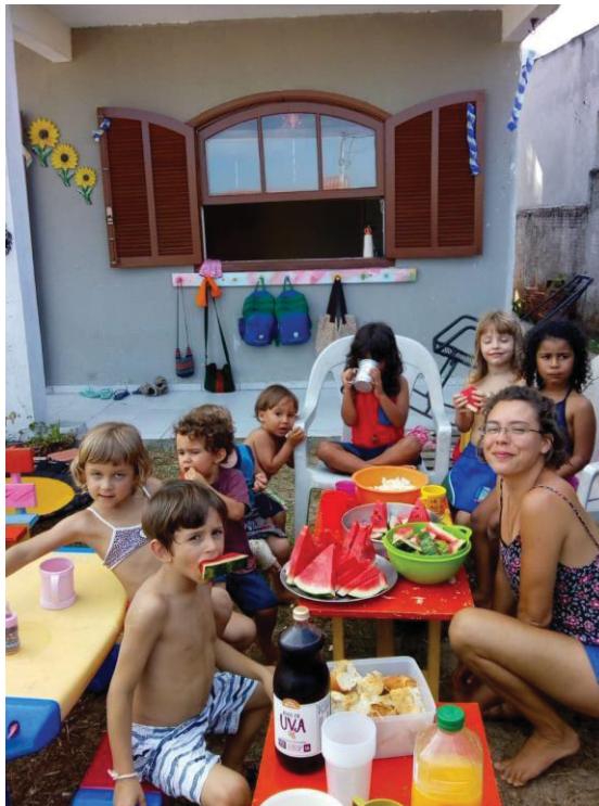
Figura 4 - Confraternização no Espaço Sementinhas

criança possa crescer na sua autoconfiança e autonomia, na capacidade de adquirir e criar conhecimentos e enfrentar as dificuldades que lhes apresentam através da organização de um ambiente educativo, democrático e igualitário. (MACHADO, s/d).