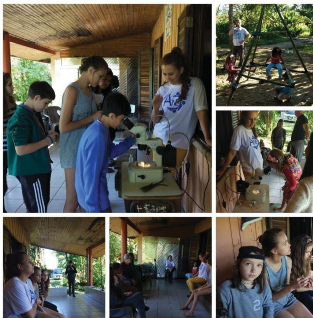
Figura 17 - Ação em Antonina