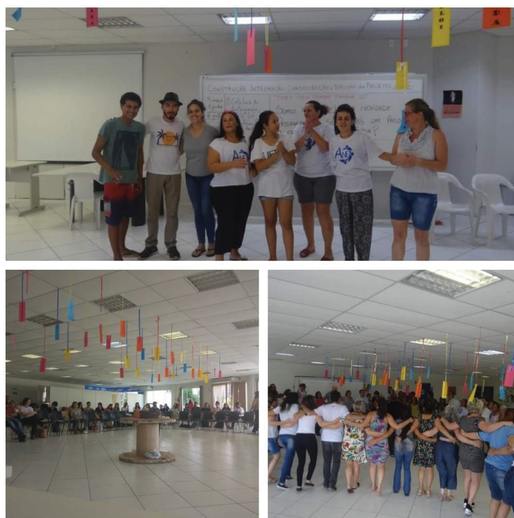
Figura 19 - "des-formatura" - 1º Turma ANE

Foi um dia mais que especial, tendo em vista que foram os membros da nova turma que organizaram e pensaram em como promover esse evento, os detalhes e programação, as homenagens, mimos para os des-formandos e no final foi a entrega dos seus certificados, concluindo assim um ciclo de suas vidas.