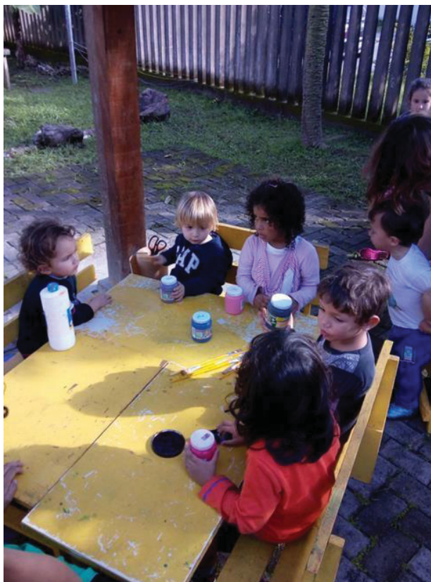
Figura 1 - Crianças no Projeto Coamar

Em março de 2018 aconteceu a primeira reunião da ANE em que participei como ouvinte, não houve muita compreensão, mas continuei. Conheci alguns lugares e pessoas maravilhosas, as vivências que participei foram ricas de aprendizados e conhecimentos.