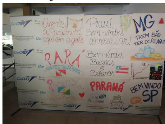
Figura 20 - IV CONANE Brasília

muitos aprendizados, a cada palestra, a cada participação nos projetos foram fantásticas as lágrimas até rolavam.