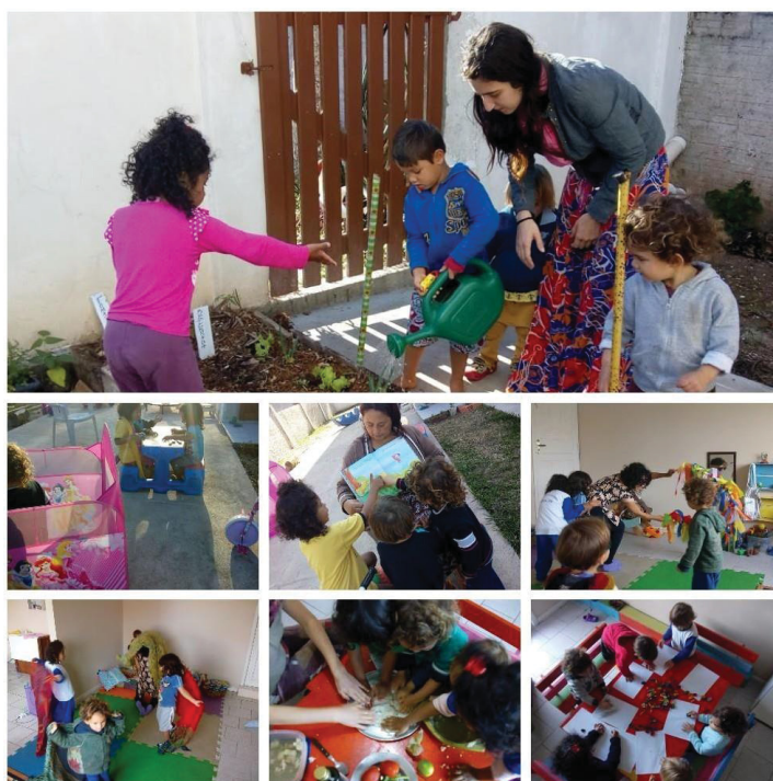
Figura 2 - Crianças e Voluntários ""Espaço Sementinhas""

Abaixo temos um momento no Espaço Sementinhas com as crianças e mães voluntárias.