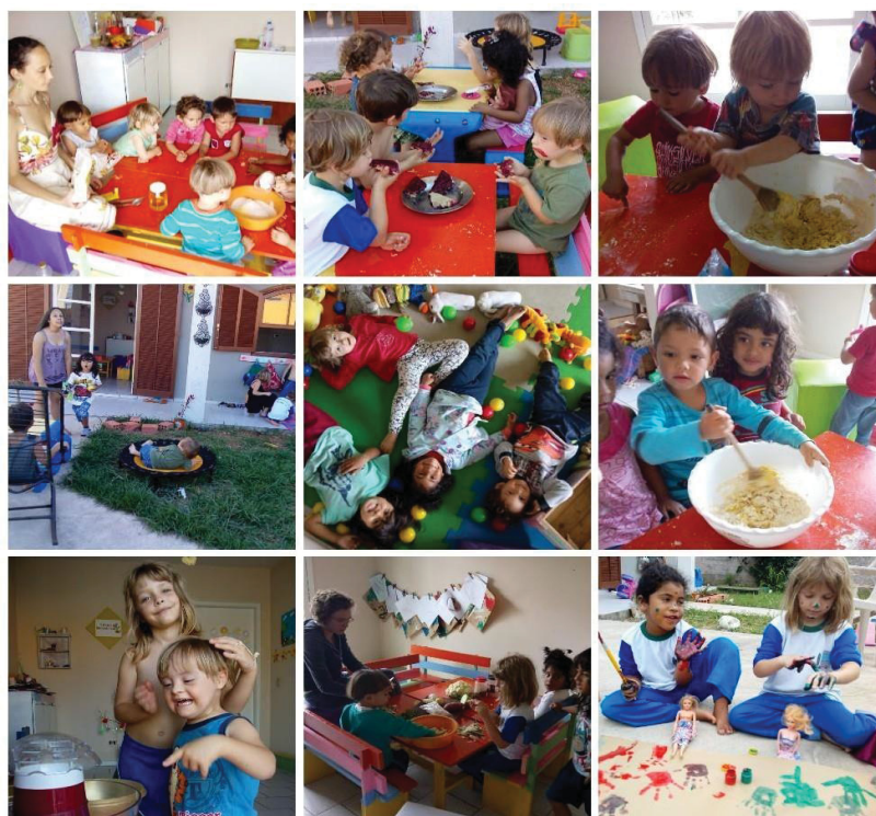
Figura 5 - Momentos "Espaço Sementinhas"

Foram meses de muita alegria, de um sonho estar se realizando, vivendo na prática o livre brincar, conhecendo e entendendo o processo da educação alternativa nossos momentos do Espaço Sementinha que proporcionaram momentos alegres, imaginários, descobertas e amor. Uma experiência que nos molda e muda nossa percepção de como viver e aprender com as crianças.