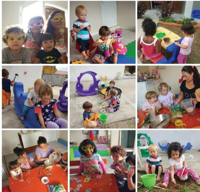
Figura 3 - Momentos "Espaço Sementinhas"

Na figura acima temos momentos do livre brincar, culinária, onde as crianças de idades diferentes brincavam juntas no mesmo espaço. Sempre oferecendo meios para a criança vivenciar situações que favorecem o desenvolvimento de interação, participação, solidariedade, responsabilidade, criatividade e convivência, onde a