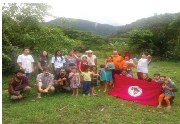
Figura 7 - Voluntários Dia das Crianças

A imagem acima nos mostra a ação do dia das crianças realizada por voluntários e o Projeto Sementinhas no Assentamento José Lutzemberg (MST) localizado em Antonina, foi no mês de outubro em 2018.