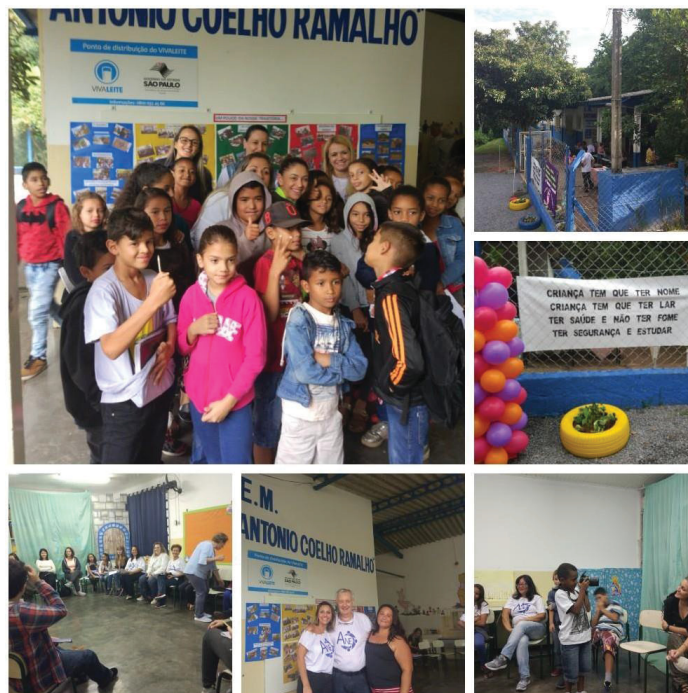
Figura 16 - Escola Antonio Coelho Ramalho

e dificuldades na comunidade, as crianças amam essa escola. E que esse modelo de escola é possível sim.