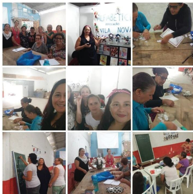
Figura 8 - Participantes do ALFABETICH