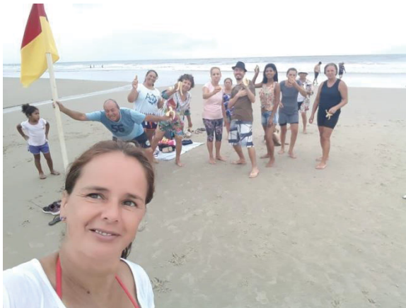
Figura 13 - Projeto Dança Bem-Viver