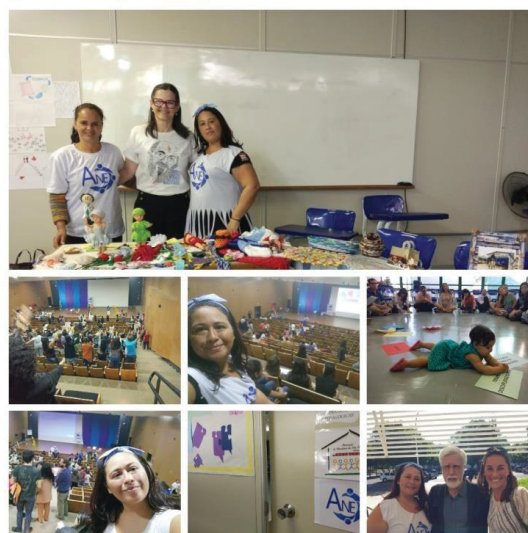
Figura 21 - IV Conane Brasília

Sou grata pelo acolhimento, abraços, conversas, trocas de experiências. Essa maravilhosa vivência eu jamais havia vivido em nenhum coletivo, e que foi muito importante para a minha vida. Uma Conferência Nacional da Educação onde todas as inters estavam presentes, mais uma vez.