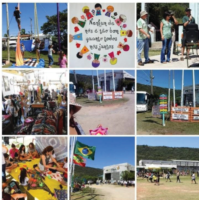
Figura 12 - Praça na Guarda do Embaú em Palhoça/SC