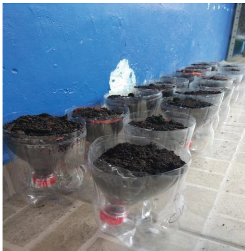
Figura 14 - Ação Plantação de Tomates

Outra vivência também realizada por uma estudante da ANE, professora Ariadne 9 , foi a Plantação de Tomates com crianças do pré no qual mostrou para as crianças a importância da horta e como cuidar das plantações.