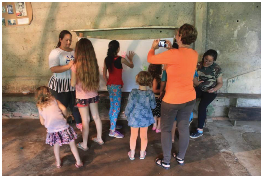
Figura 6 - Ação Dia das Crianças

As crianças foram crescendo, assim, passando da idade em que o projeto proporcionou, sendo encaminhadas para rede pública de educação infantil do município, outros pais mudaram de cidade e por isso o projeto teve seu término.