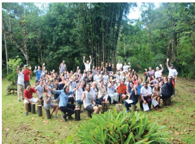
Figura 10 – TURMA ANE II

Na imagem abaixo temos outro momento com a turma ANE II foi na Chácara Roda d'água, um dia que nos ensinou a trabalhar a ansiedade, o saber esperar, o saber falar, o saber ouvir, também o saber confiar, o saber compartilhar com várias dinâmicas e atividades em grupo. Um dia de vivência extraordinária, alegria, união e abraços.