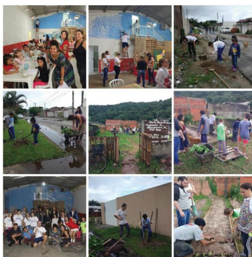
Figura 18 - Vivência Agroecológica na Associação Vila Nov

As crianças da comunidade ajudaram em tudo, foram participativas durante todo o evento. E no mesmo espaço identificou-se que as 'inter's" estavam presentes. Acompanhei todo o evento, pois fui voluntária fotografando-o.