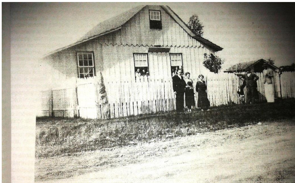
FOTO 2 – PRIMEIRA ESCOLA DO BAIRRO CRAVO FONTE: HISTÓRIA DA SOCIEDADE OPERÁRIA E BENEFICENTE 15 DE NOVEMBRO