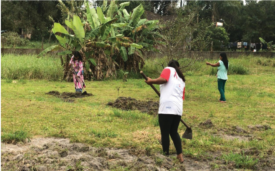
Figura 16: Preparando a área da horta.

de pás e enxadas, capinagem coletiva com escola e comunidade (Figura 16, 17, 18 e 19).