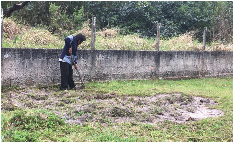
Figura 17: Preparando o espaço para os troncos e as telas.