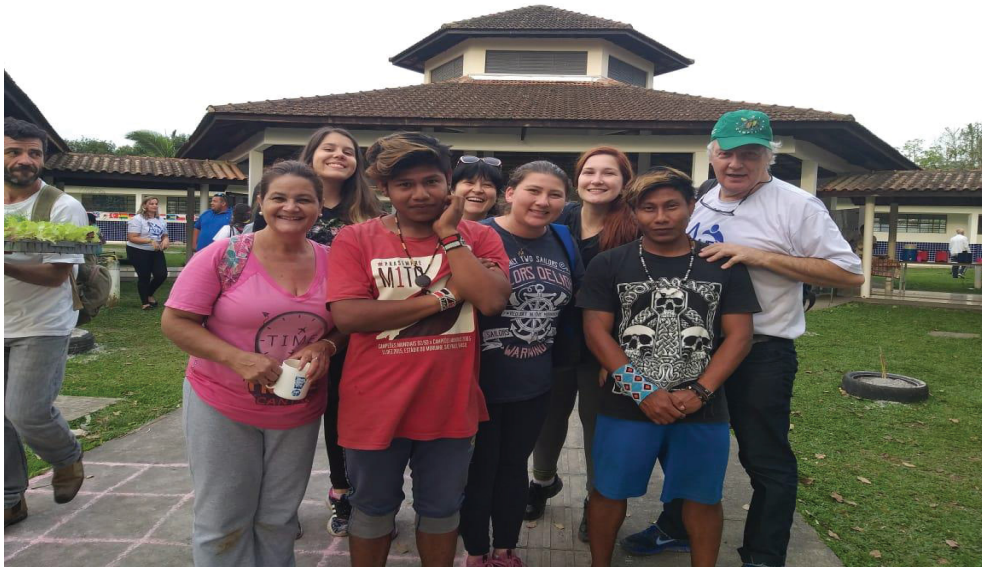
Figura 24: Jornada Ilha da Cotinga – saída para o passeio.

relataram no retorno, foi adrenalina pura, todos levaram as lembranças em suas memórias. Gratidão por esse dia.