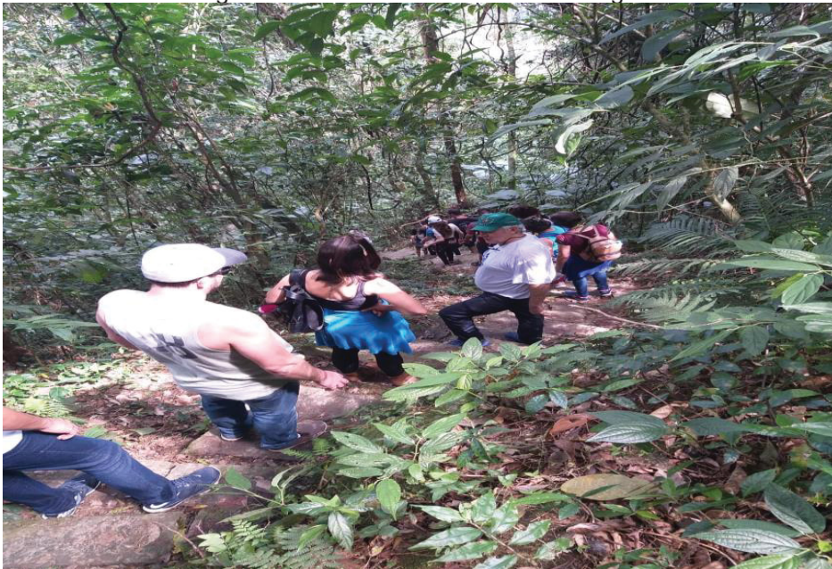
Figura 25: Desbravando a Ilha da Cotinga.