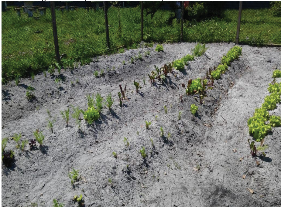
Figura32: Limpeza dos canteiros e plantio de novas mudas.