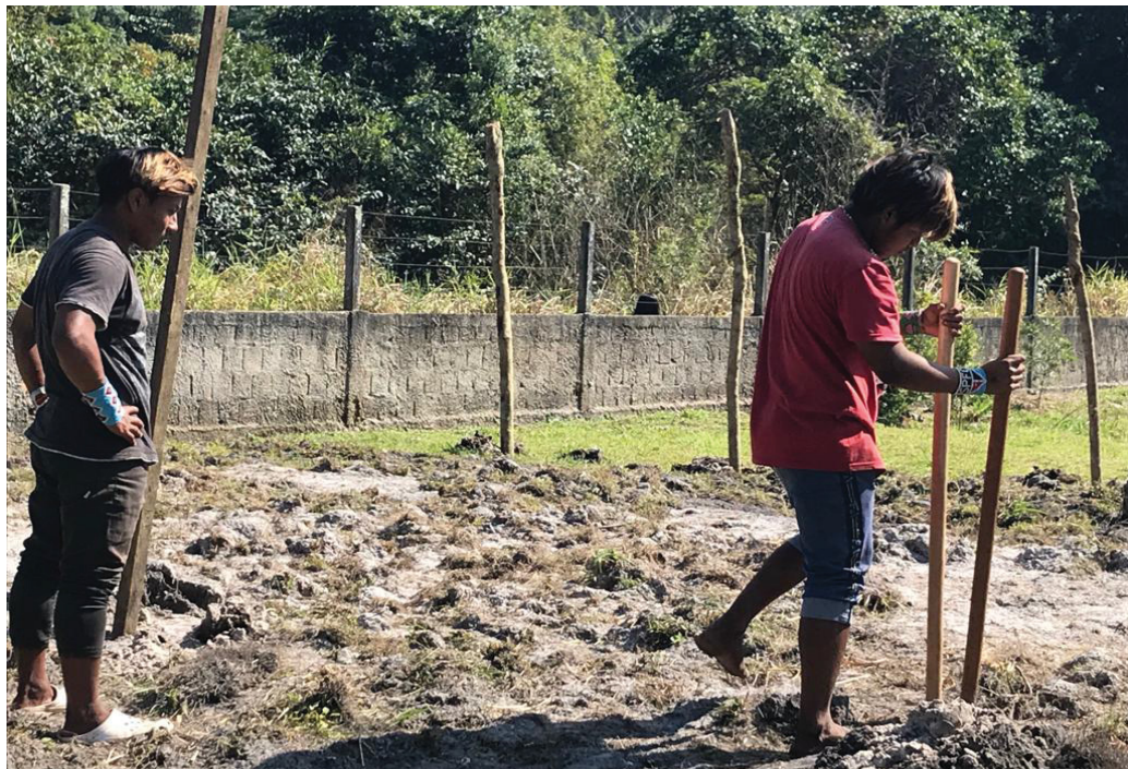
Figura19: Alunos fazendo os canteiros.