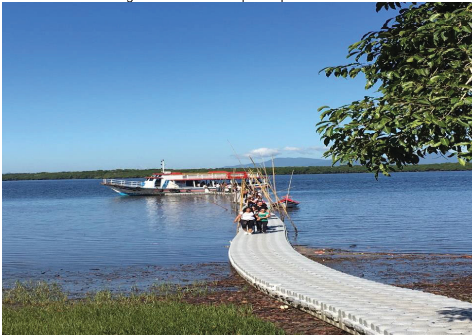
Figura 05: Desembarque do povo Aneano.