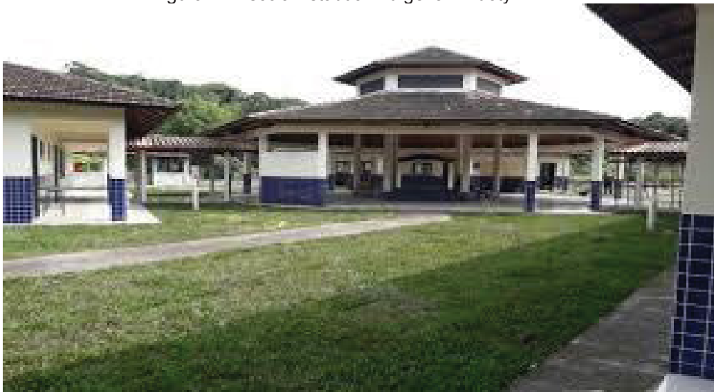
Figura 1 - Escola Estadual Indígena Pindoty - EFM