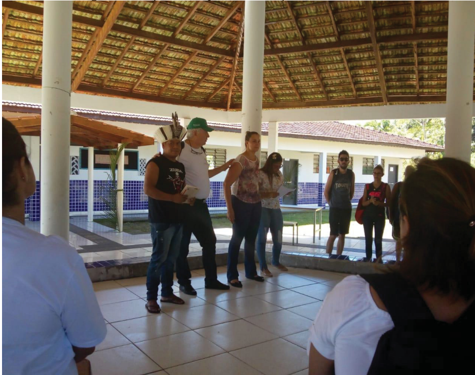
Figura 04: Apresentação da ANE para a comunidade.