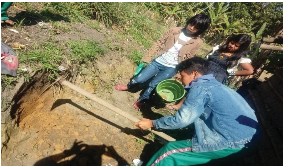
Figura 15: Alunos estudando o solo da região na aula de ciências.