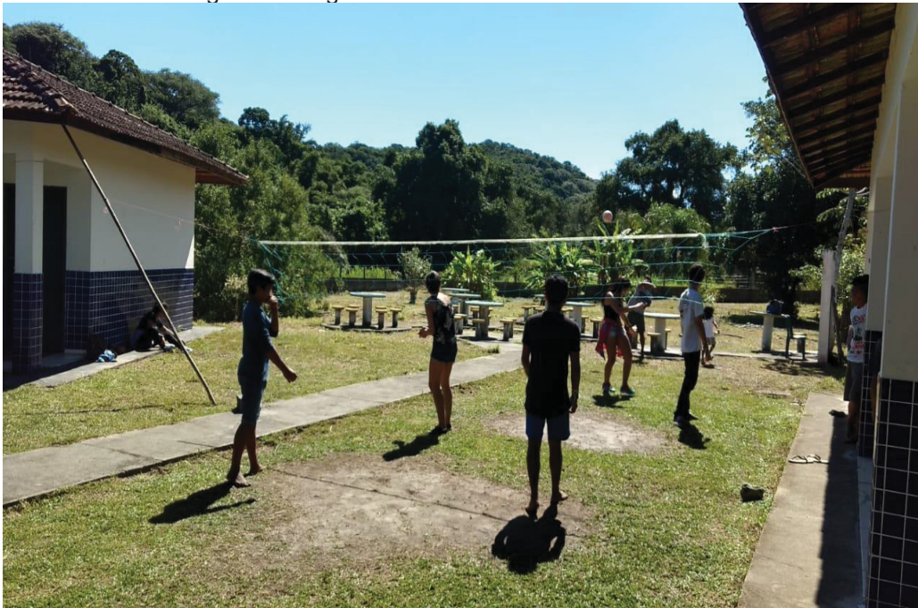
Figura 11: Jogos e brincadeiras com a comunidade.