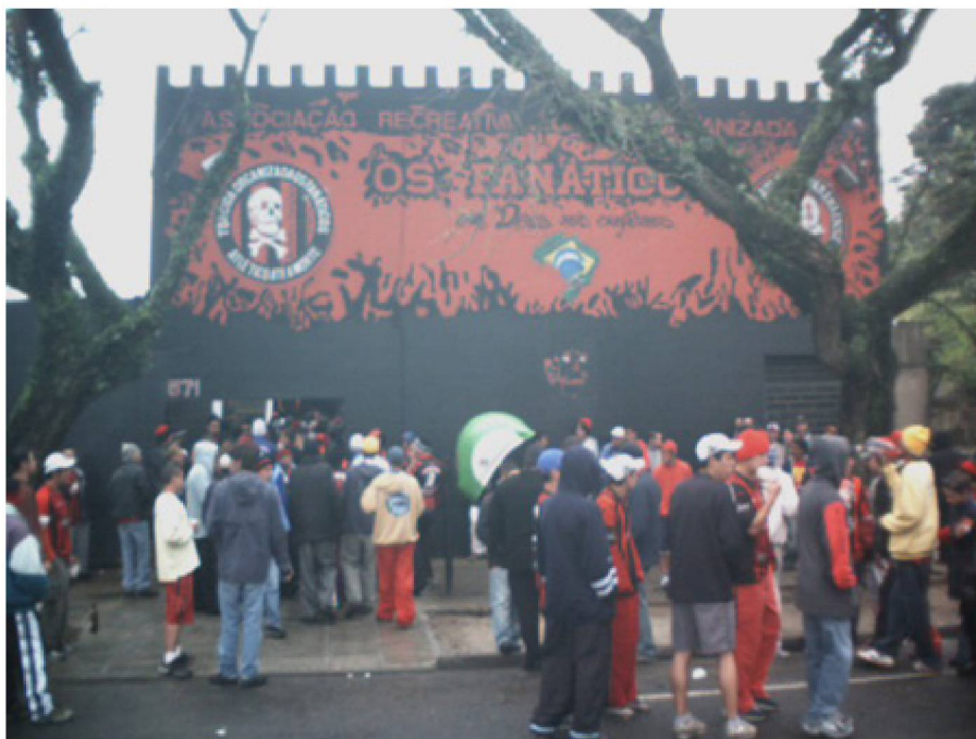
Fig. nº 1 - fachada antiga

ao lado do Estádio. Depois passamos para uma sala maior até comprar o terreno e de construir nossa própria Sede” (L.J., membro antigo da TOF).