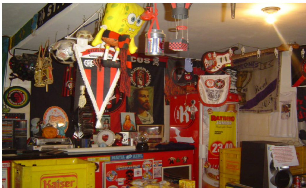
Fig. nº 4 – Interior do bar

Esponja, o Sherek e os Monstros S.A. Luzes, principalmente na cor vermelha, e um globo multicolor dão um aspecto diferenciado ao bar à noite. Esse estabelecimento pertence à TOF e toda a renda oriunda dele é para a própria torcida organizada. Por isto, ele está em pleno funcionamento durante todos os eventos e dias de jogos. “É comum alguns associados mais antigos e que já se desligaram da TOF por algum motivo aparecerem aqui para conversar e tomar uma cerveja no bar” (MEMBRO DA DIRETORIA).