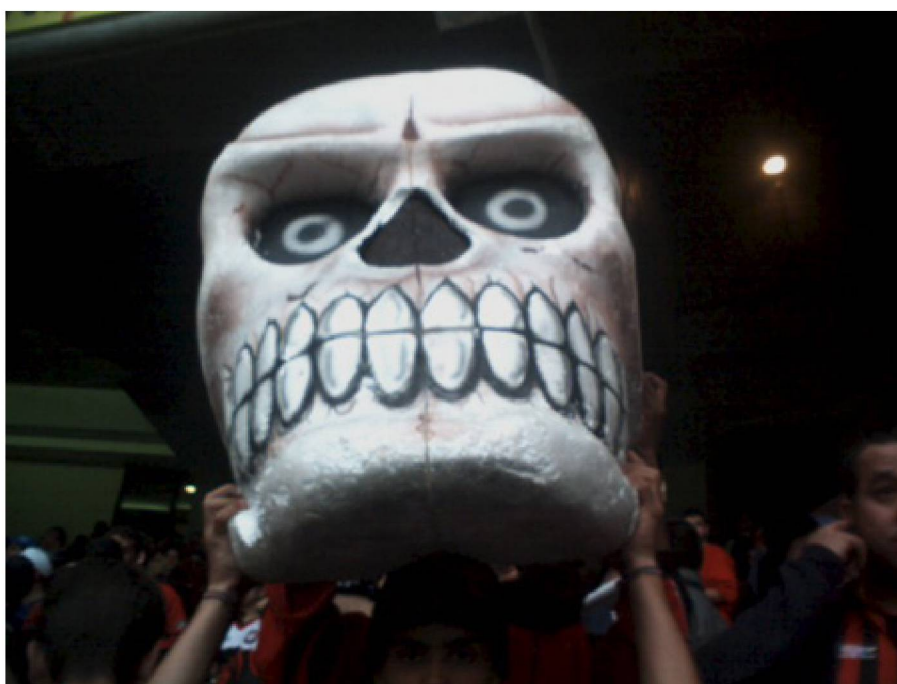
Fig. nº 3 - caveira maciça

Já na construção dos fundos encontra-se o almoxarifado, onde são guardados os instrumentos musicais e os materiais da torcida como faixas, bandeiras e as caveiras de isopor maciço, símbolos da torcida (Fig. nº 3). Esse local possui a parede forrada de fotos de mulheres nuas, sendo o local da Sede que mais exprime a questão da masculinidade, pois a maioria dos Associados e pertencentes à TOF é do sexo masculino. Segundo alguns membros mais antigos, aquelas fotos já estão lá há bastante tempo e as mulheres quase não entram naquele local.