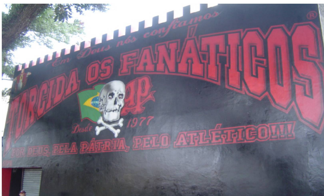
Fig. Nº 6 – Nova Fachada

No início do ano de 2007 a Sede permaneceu fechada por vários dias devido a reforma estrutural que está sendo realizada e que até o presente momento não foi finalizada. A fachada já está nova (Fig. 6) e entre os projetos estão: a ocupação do espaço da Academia para uma loja mais ampla, o espaço da boutique para um alojamento e a informatização da secretaria.