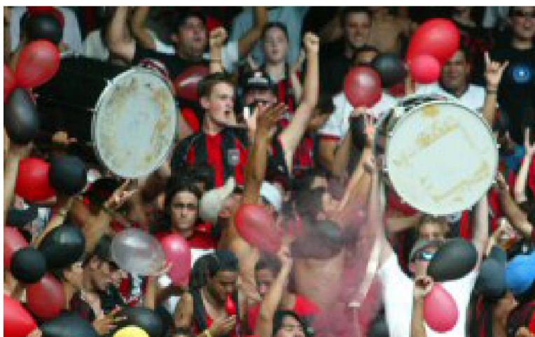
Fig. nº 8 – a bateria no estádio

Destaca-se agora, a composição da bateria (Fig. 8). Ela é composta por instrumentos de percussão, que foram sendo adquiridos ao longo do tempo de torcida e, segundo alguns membros, devem ser preservados para serem substituídos somente em caso de desgaste. Nem todos esses instrumentos são levados em todos os jogos e nem existe uma obrigatoriedade de que os componentes da bateria estejam presentes em todos eles.