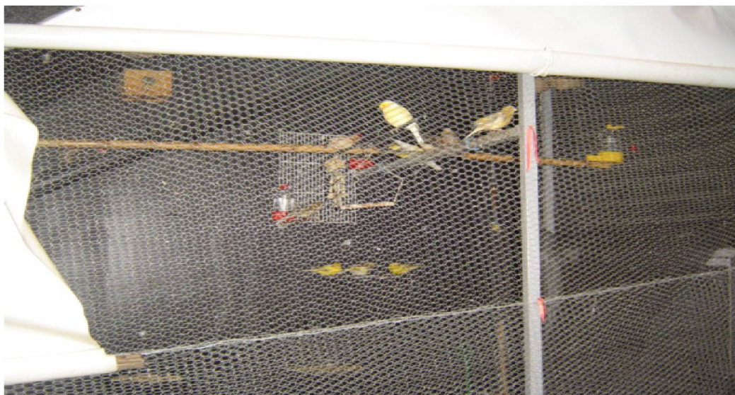
Fig. nº 5 – Viveiro de pássaros

Abaixo da escada que dá acesso ao espaço da antiga Academia existe um viveiro de pássaros (Fig. nº 5) que, segundo um dos membros, é motivo de descrença por vários torcedores: “eles não entendem como uma Sede de uma torcida pode ter um viveiro de pássaros. Muitos não acreditam também que o projeto de reforma da Sede inclui uma capela” (membro da diretoria).