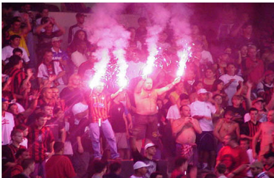
Fig. nº 7 - Torcida na arquibancada

Entretanto, não existe maneira formal e burocrática de controlar quem está inserido nesse espaço. Ele é fortemente delimitado pela presença da bateria, dos materiais e dos membros da TOF. Se um “torcedor comum” se inserir no local ocupado pela TOF, deve estar ciente dos rituais realizados por eles como, por exemplo, a escalação do time no início da partida. Estas saudações ritualísticas são acompanhadas por palmas e pela bateria, cujos membros incentivam e até mesmo cobram a participação de todos que ali estejam. Durante a partida inúmeras canções e infinitas coreografias são executadas (Fig. nº 7), com o intuito de intimidar os adversários e, segundo torcedores, fazer o Estádio da Arena da Baixada — o Caldeirão — um forte empecilho para que as equipes adversárias conquistem resultados satisfatórios nos jogos contra o Atlético.