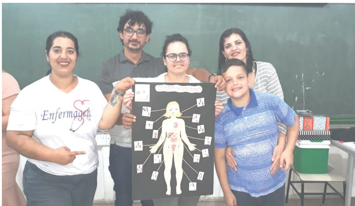
FIGURA 9 – CURSO LIBRAS PROFISSIONAIS DA SAÚDE