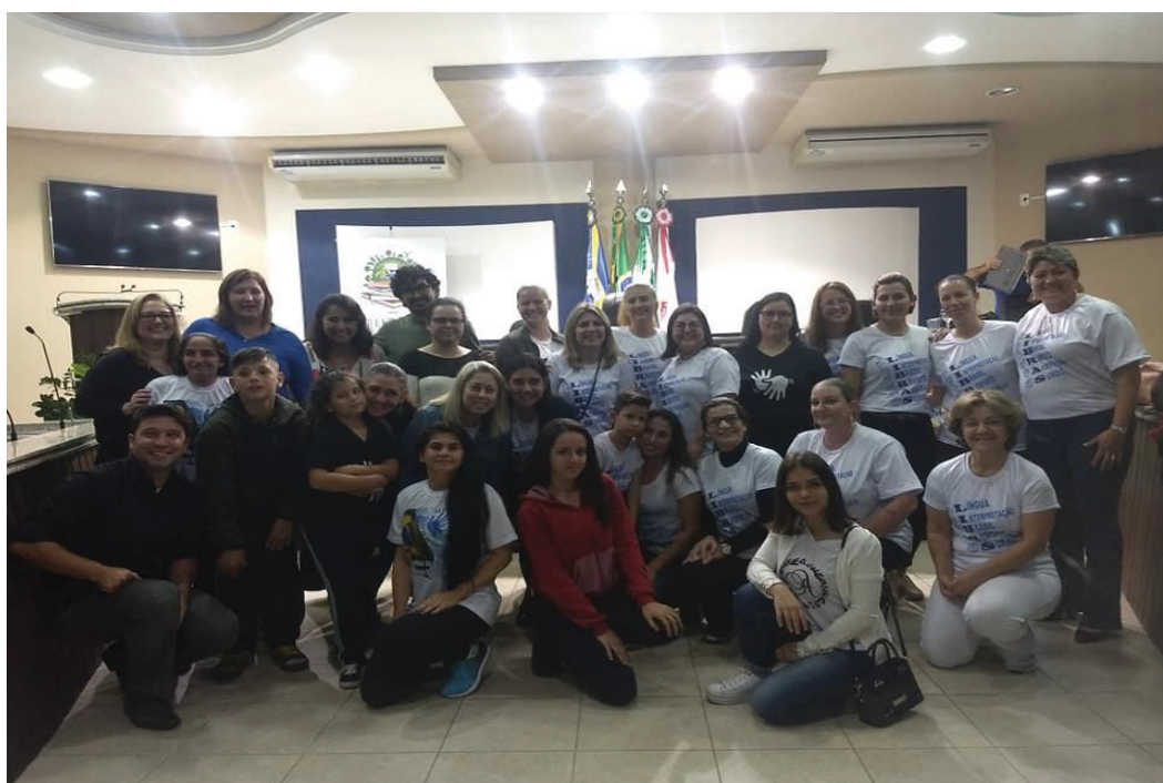
FIGURA 15- COMEMORAÇÃO DIA DO SURDO

A solenidade de comemoração foi um momento muito importante para a comunidade surda de Guaratuba e convidados (Figura 15).