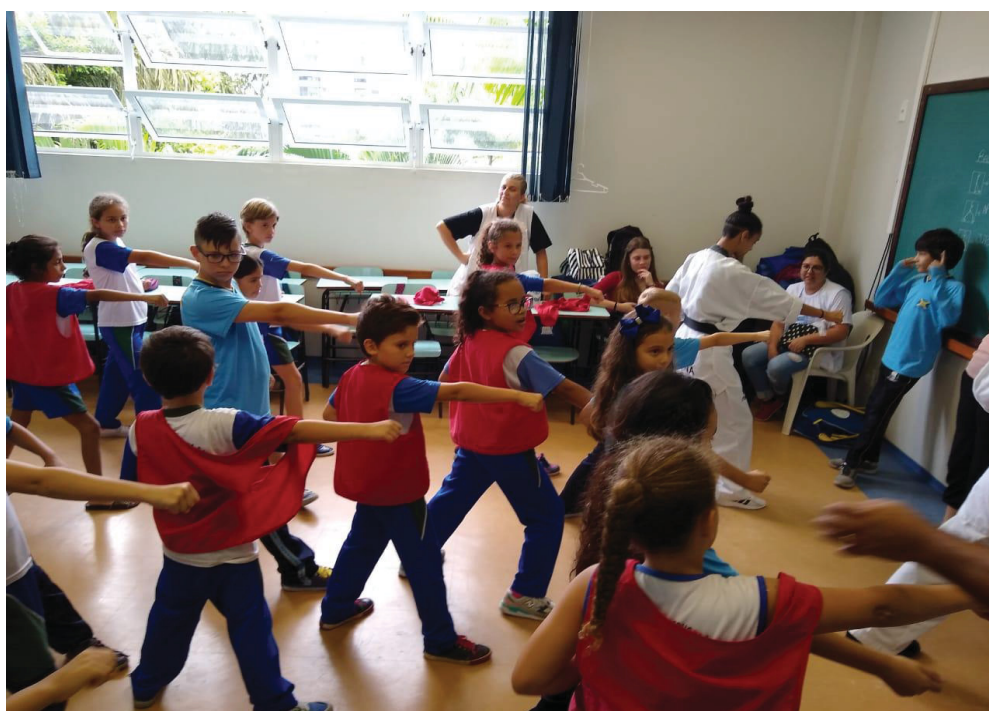
FIGURA 18 – PROGRAMA SABERES

No final do mês de novembro os alunos surdos da Escola Governador Moisés Lupion visitaram a UFPR onde estava acontecendo oficinas do Programa Saberes (Figura 18).