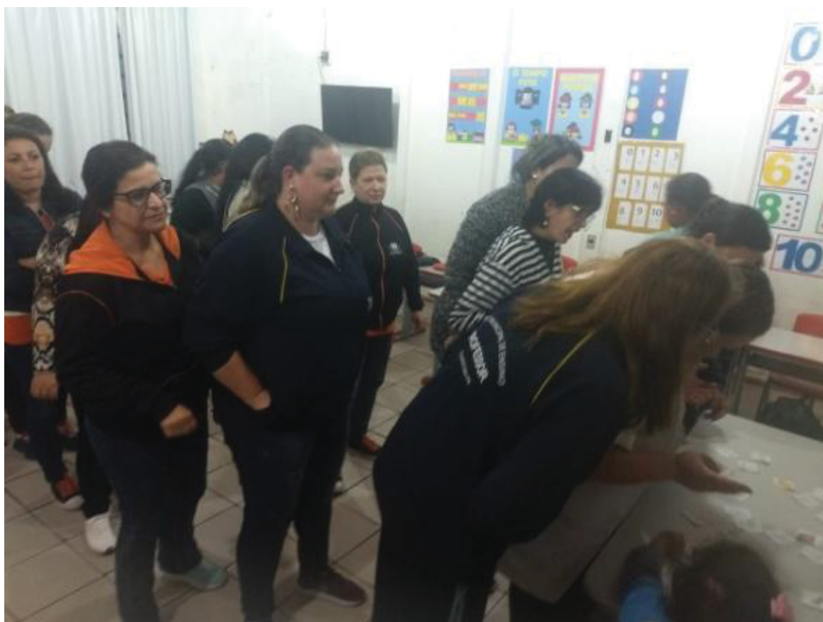
FIGURA 11 – CURSO LIBRAS PARA PROFESSORES

Também no ano de 2019, foi realizado o Curso de Libras básico com duração de 40 horas, ofertado aos professores da Rede Municipal de Ensino de Guaratuba. Este curso tem como objetivo capacitar os professores a se comunicar através da língua brasileira de sinais de maneira prática e objetiva com os alunos da rede municipal. A metodologia é a mesma desenvolvida nos outros dois cursos ministrados por esta pós-graduanda aqui já mencionados (Figura 11).