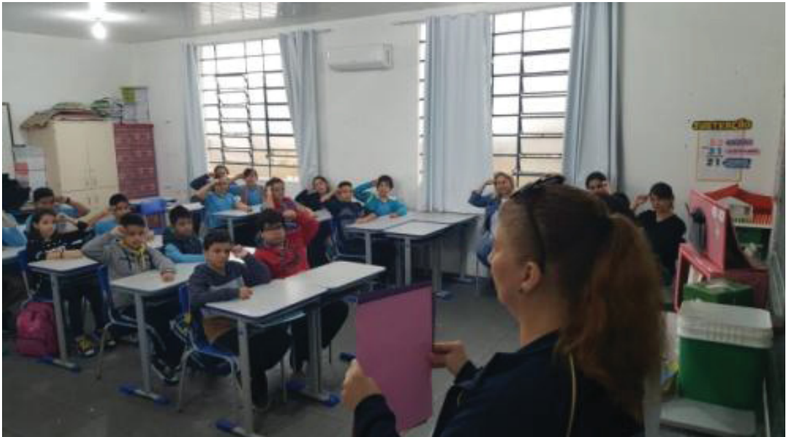
FIGURA 12 – DIA DO SURDO OFICINAS E JOGOS