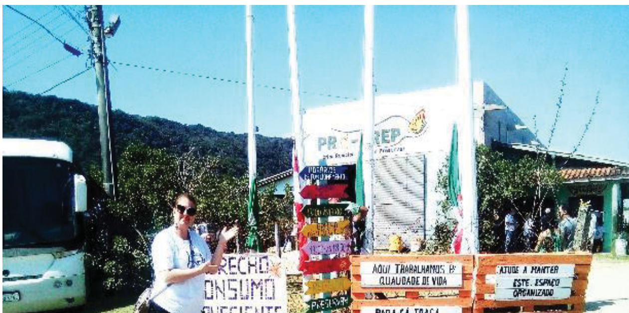
FIGURA 1: SAÍDA DE CAMPO: VISITA A CIDADE DE PALHOÇA

Nos dias 21 e 22 de setembro do ano de 2018 ocorreu um evento na cidade de Palhoça, estado de Santa Catarina, com a temática do Meio Ambiente. Estive presente no evento.