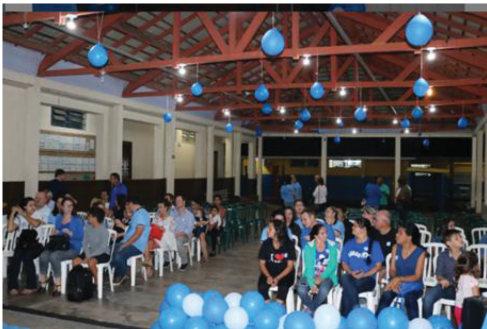
FIGURA 6 – FAMILIARES COMUNIDADE SURDA DE GUARATUBA

Na ocasião ministrei uma palestra em LIBRAS explicando a importância da popularização da língua de sinais não só entre a comunidade surda como para toda a cidade.