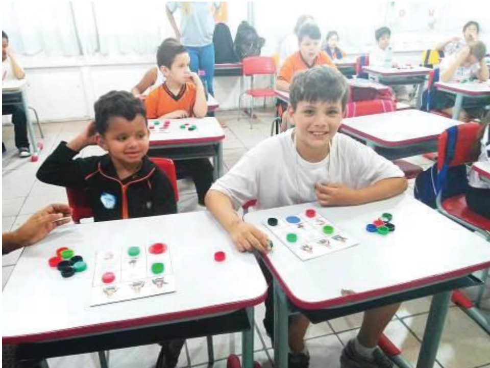
FIGURA 3 – OFICINAS E JOGOS