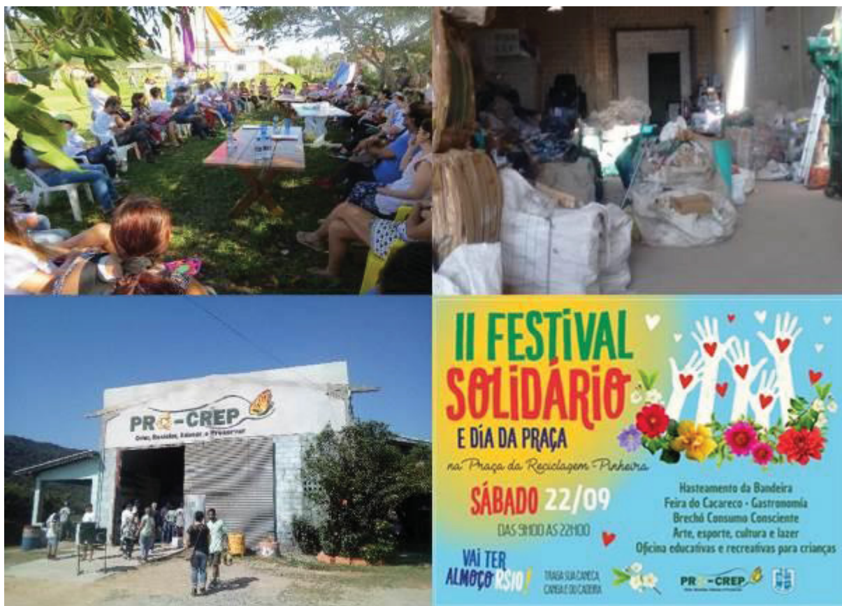
FIGURA 2: VIAGEM À PALHOÇA

Nessa viagem a Palhoça apreciei as atividades realizadas e principalmente a oportunidade de conhecer outra realidade, no entanto, devido à ausência de intérprete de LIBRAS, o conteúdo conversado durante as atividades não pode ser apropriado por mim.