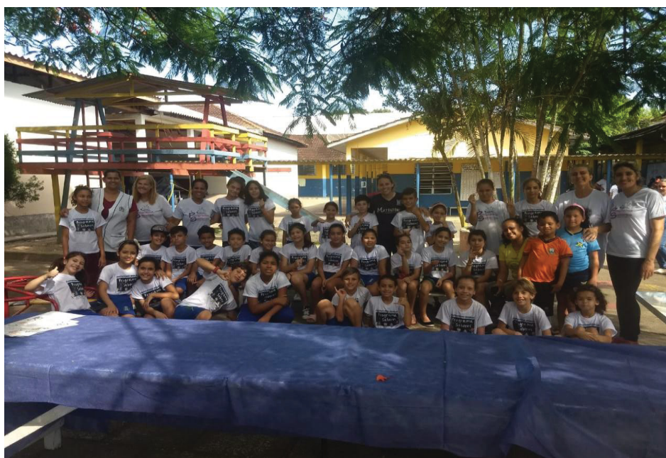
FIGURA 17 – AÇÕES PRÁTICAS

Ações desenvolvidas: o primeiro momento aconteceu como uma apresentação na sala de recursos onde eu juntamente com meus alunos surdos, sinalizamos a história do Gato xadrez para as crianças ouvintes do Programa Saberes (Figura 17).