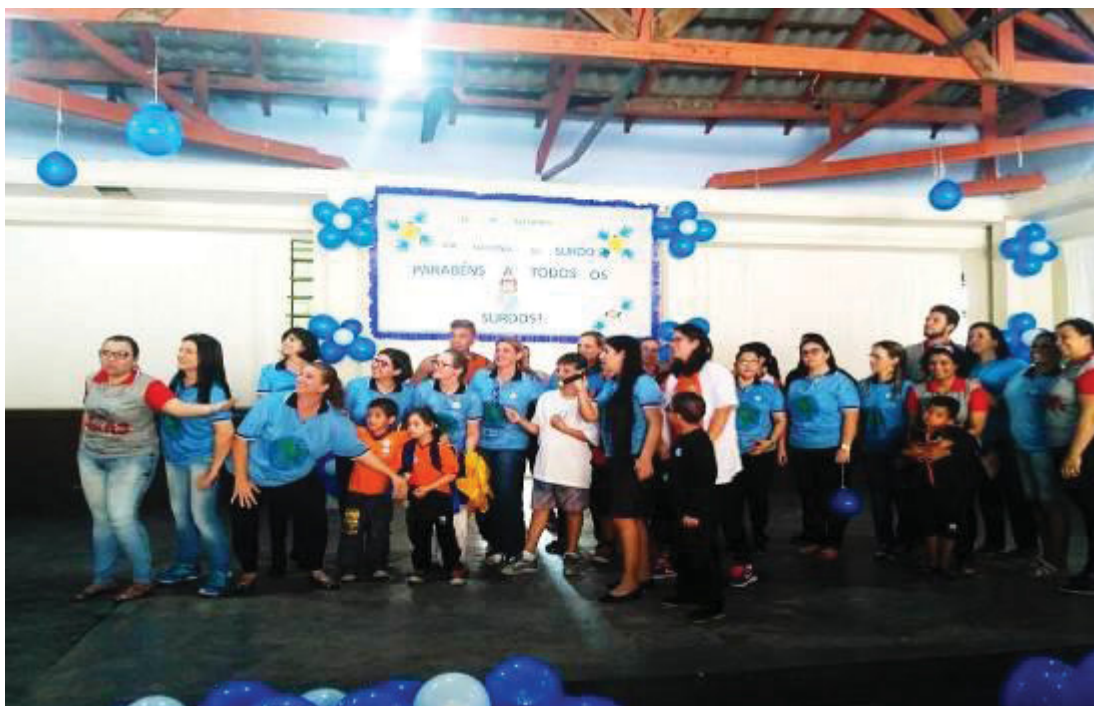
FIGURA 5 – INTERAÇÃO NO DIA DO SURDO

As atividades práticas do dia de homenagem ao Dia do Surdo influenciam sobremaneira a forma como as crianças agem com os amigos e apresentam a surdez e se comunicam com LIBRAS. A criança tem naturalmente facilidade de aprender e quando se desperta nela o interesse e principalmente a empatia para que ela aceite a diferença de comunicação do colega e queira aprender uma outra forma, todos saem ganhando (Figura 5).