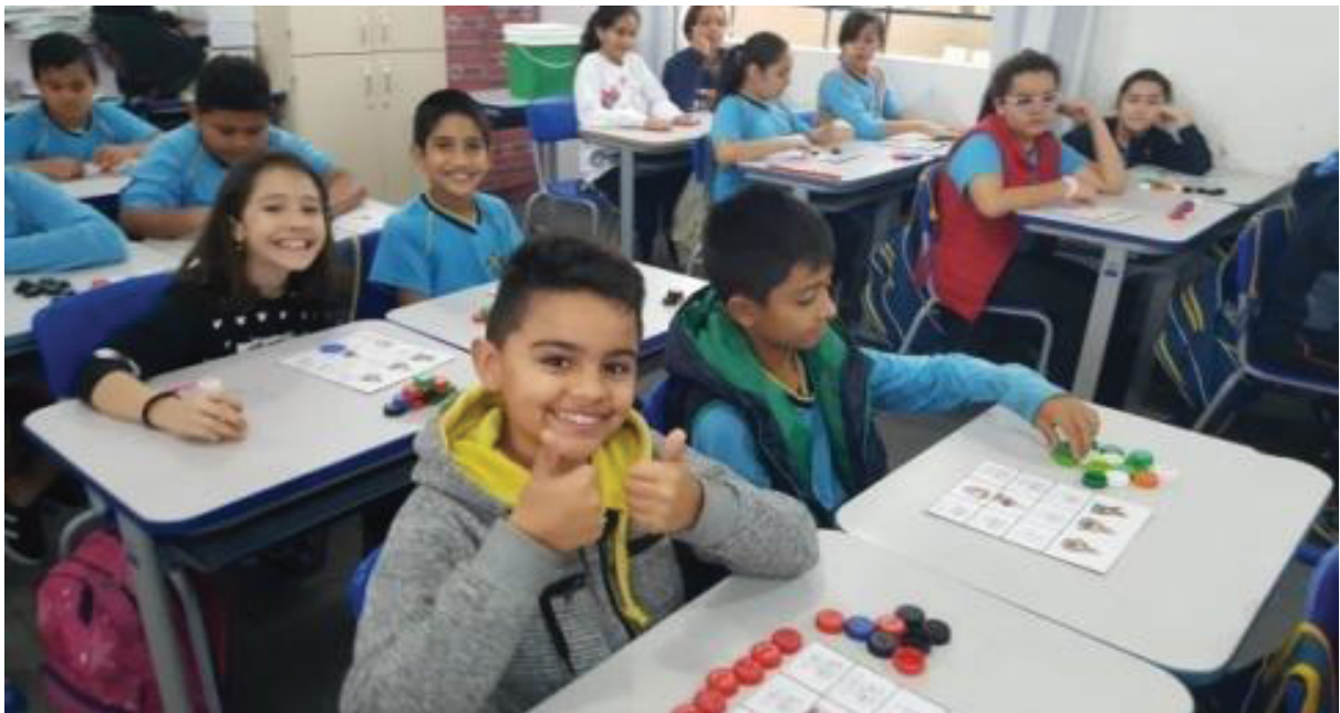
FIGURA 13- JOGOS EM LIBRAS

As crianças participaram de jogos e brincadeiras com a LIBRAS para promover a interação entre elas (Figura 13).