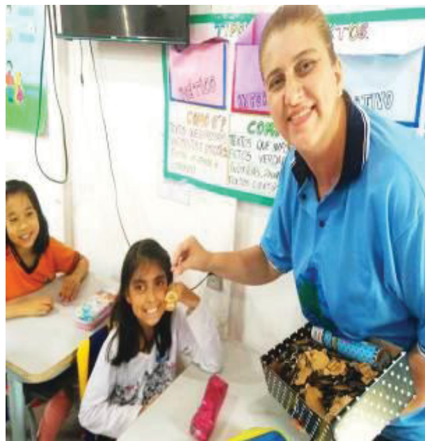
FIGURA 4- EDUCADORA COM OS ALUNOS

Sempre interajo com os alunos da escola, o que facilita e muito o trabalho das oficinas e a aceitação da LIBRAS (Figura 4). É com a convivência diária que as crianças se familiarizam com as pessoas surdas e tem desperto o interesse em aprender para se comunicar melhor.