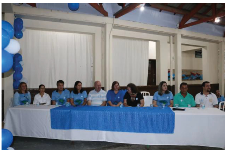
FIGURA 7 –AUTORIDADES PRESENTES

O evento contou com a presença de muitas pessoas fora da escola, como a fonaudióloga do município, representante do Rotary Club de Guaratuba e outras autoridades (Figura 7).