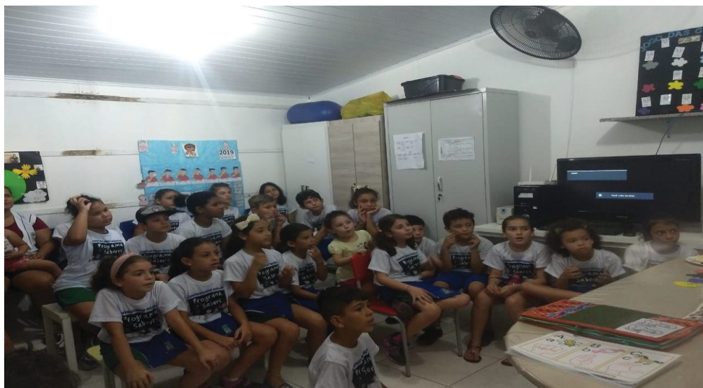
FIGURA 16- ALUNOS DE MATINHOS

No mês de novembro foi realizada nova ação com as crianças do Programa Saberes contra turno escolar Municipal da cidade de Matinhos, e alunos surdos da escola Moises Lupion (Figura 16).