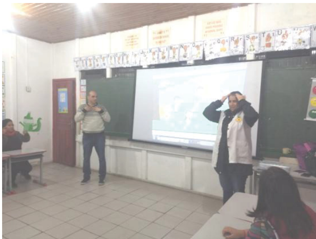
FIGURA 10 – AULA DO CURSO DE LIBRAS

As aulas do curso de LIBRAS buscaram ser interativas e muito práticas para que os profissionais da área de Saúde do município pudessem se instrumentalizar para atender melhor o paciente surdo (Figura 10).