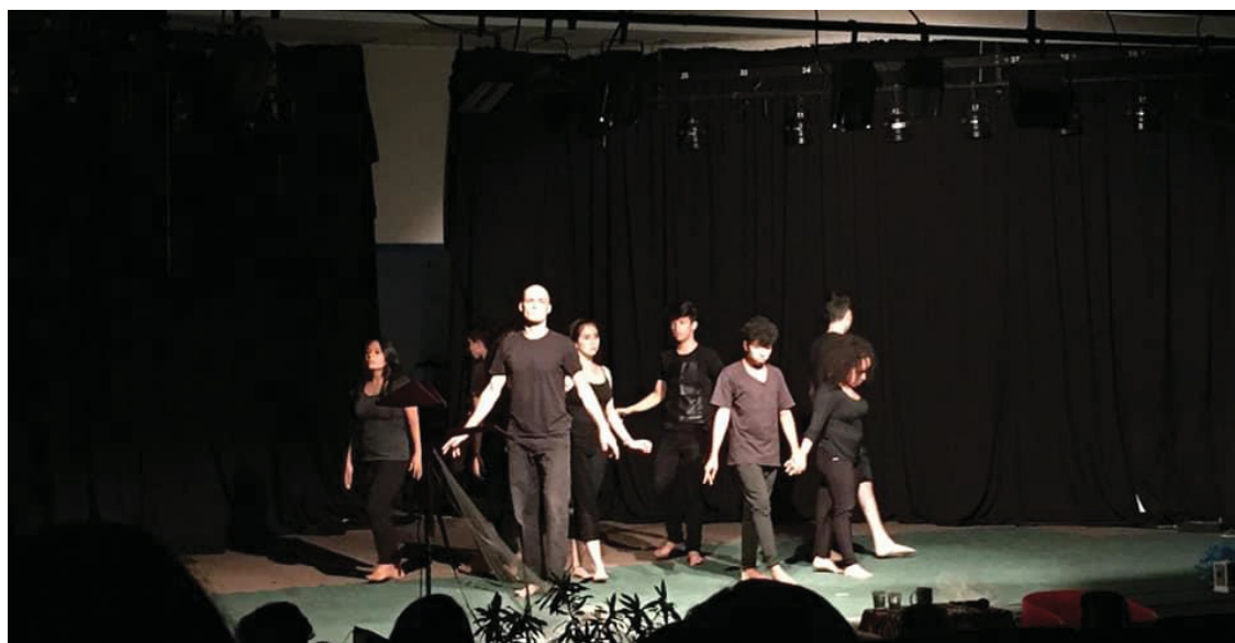
Apresentação "Nossa Voz" UFPR-Litoral.