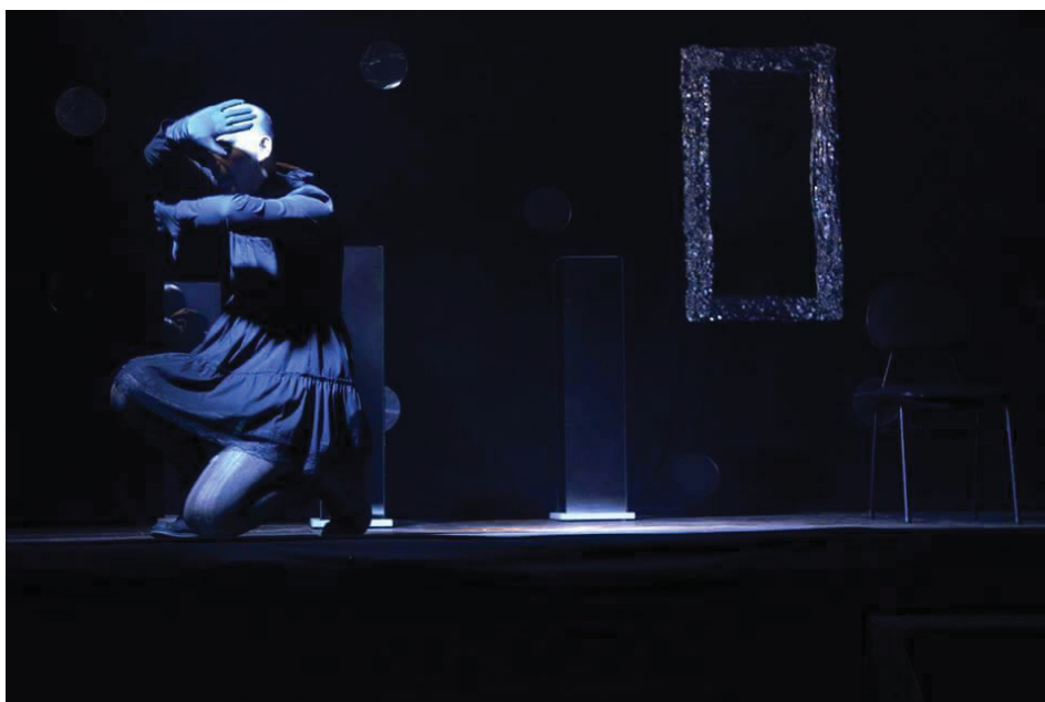
Espetáculo: Anônimo 2015.

Em nossos seis primeiros meses de trabalhos participamos pela primeira vez do Festival de Teatro de Paranaguá 2015 (FESTEPAR) e tivemos as nossas 2 primeiras premiações. Em seguida participamos do Festival de Teatro de Pontal em 2015 e conquistamos 12 premiações. Foi no teatro de Pontal do Paraná que no mesmo ano que a Nina foi a primeira cia litorânea a ser premiada no festival, até então somente cias de fora tinham sido premiadas. Desde então participamos de outros festivais teatrais e hoje contabilizamos 22 premiações, mas não é sobre ser premiados é sobre o impacto que o teatro tem na educação. Enormes aprendizados como: a socialização, a criatividade, a coordenação, a memorização, o vocabulário e outros como a construção do trabalho em grupo, aceitação de si mesmo e do outro, ocorrem no teatro. Através do teatro se percebem traços da personalidade do educando com o seu comportamento individual no coletivo.