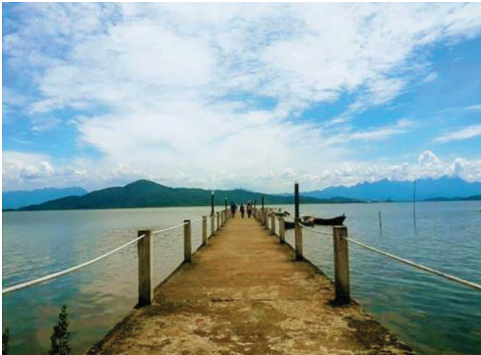
Trapiche Ilha do Teixeira.

A necessidade de buscar algo mais alternativo, algo diferente veio de encontro com o que buscava. O fato de você estar em um espaço e uma rede de pessoas, discutindo debatendo as mesmas problemáticas, mostrando diferentes pontos de vista, nos fortalece. As viagens e visitas que realizamos, assim como as trocas, foram cruciais para aprimorar meu ser enquanto docente.