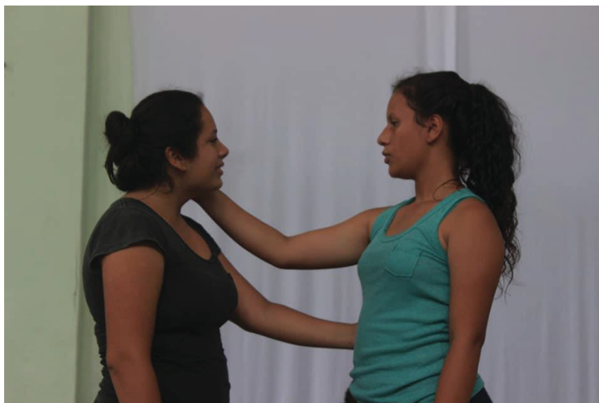
Ensaio “Nossa Voz” Educandas Teatrais em Cena 2019

Um processo de 3 meses entre proposta de saber o que o aluno estava sentindo naquele dia da aula, o que os alunos escreveram sobre eles, sobre quem eram, o que esperavam do mundo e o que não achavam justo na vida.