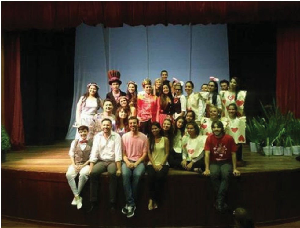
Estréia, Universo de Alice. Antonina 2015. Arquivo pessoal.