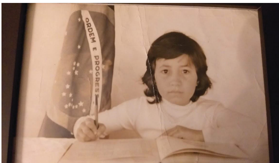
FIGURA 1 – A infância

Já em Campo Largo minha mãe lecionava na Casa Escolar Tiradentes onde mais tarde eu vim a estudar; nesta época a situação era muito precária em casa e por isso minha mãe trabalhava o dia todo. Minha trajetória na escola, apesar de ser filha de professora, não foi fácil, agradável ou significativa. Minha mãe trabalhando o dia todo não tinha tempo nem paciência para atender as minhas necessidades e dificuldades (não a culpo de forma alguma), na escola em que eu estudava minha primeira professora me acompanhou por três anos seguidos, ela era um encanto de pessoa; chegava me carregar sempre em seu colo, mas não cobrava nem exigia muito de mim e eu passava de ano sabendo muito pouco.