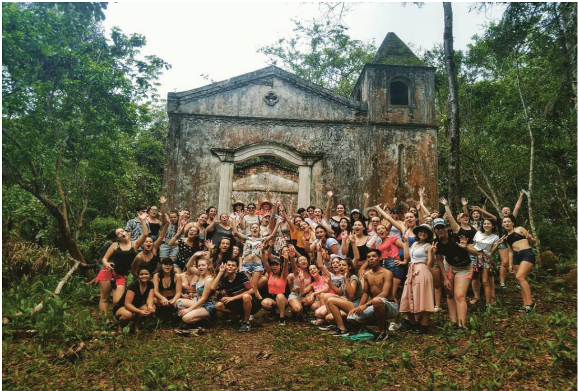
FIGURA 16 – Nossa história

Um percurso em meio a mata fechada. A recompensa chega quando avistamos as ruínas da Igreja no alto do morro. Fomos orientados nesta atividade pelos indígenas da tribo Guarani.