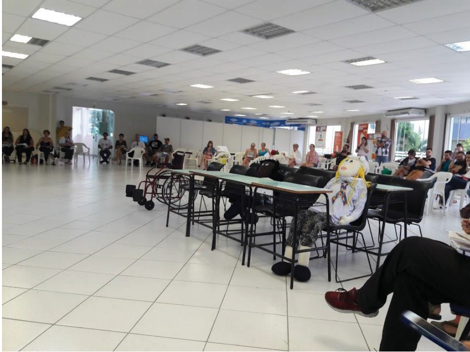
FIGURA 20 – Inclusão

educação sozinha, não transforma a sociedade, sem ela tampouco a sociedade muda (FREIRE, 2000, p. 67).