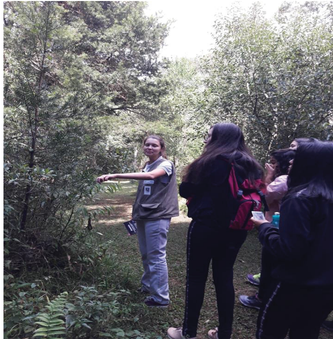
FIGURA 24 – Araucárias