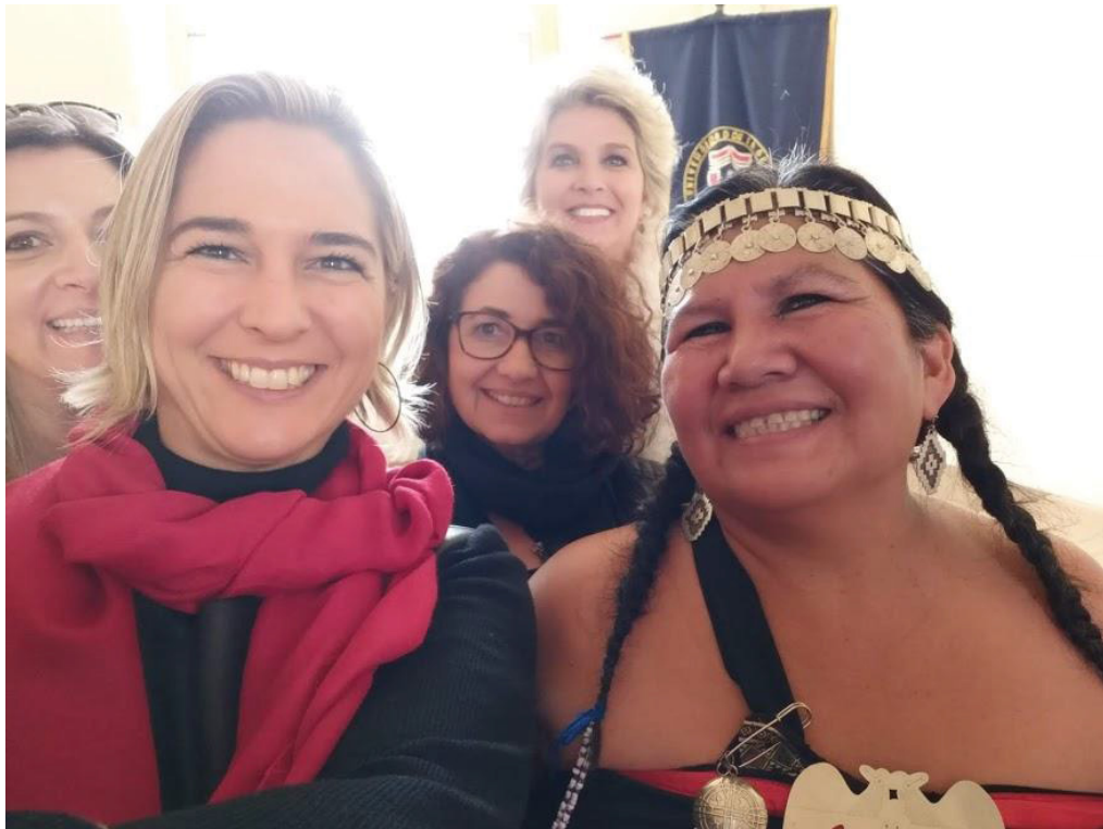
FIGURA 13 – Exemplo Mapuch