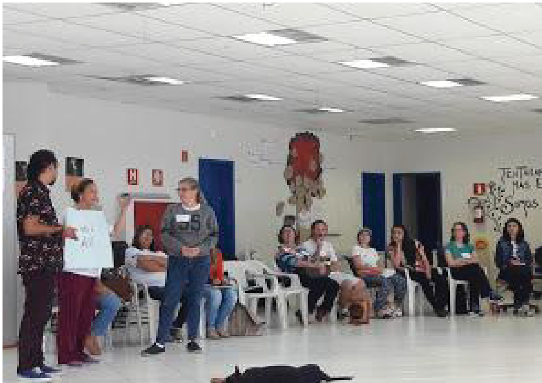
FIGURA 4 – Compartilhando