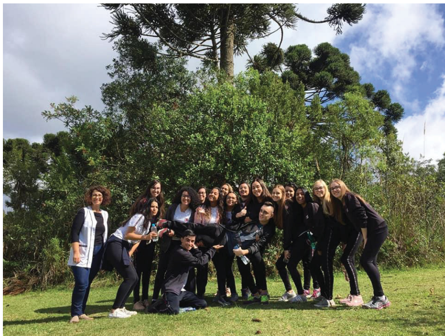
FIGURA 23 – Trilhando novos caminhos

As duas atividades de campo que contribuíram e enriqueceram o currículo, tornando o conteúdo muito mais significativo para os alunos.