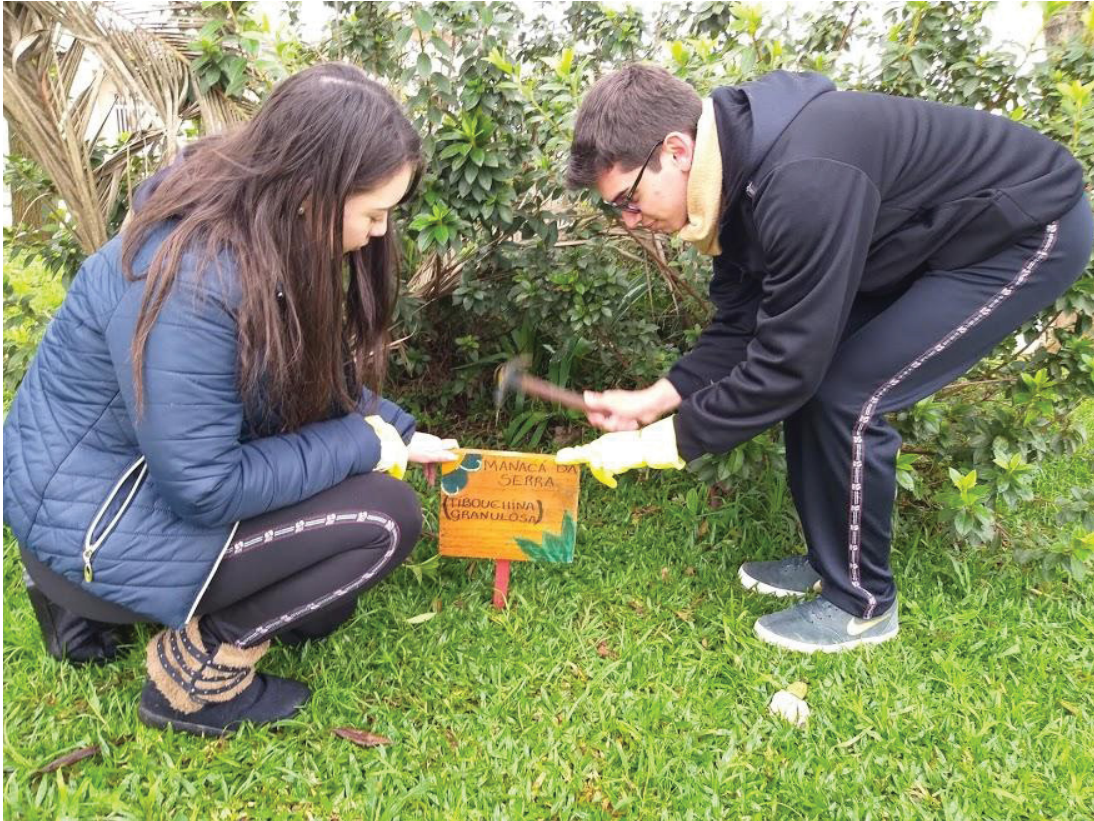
FIGURA 27 – Cuidar