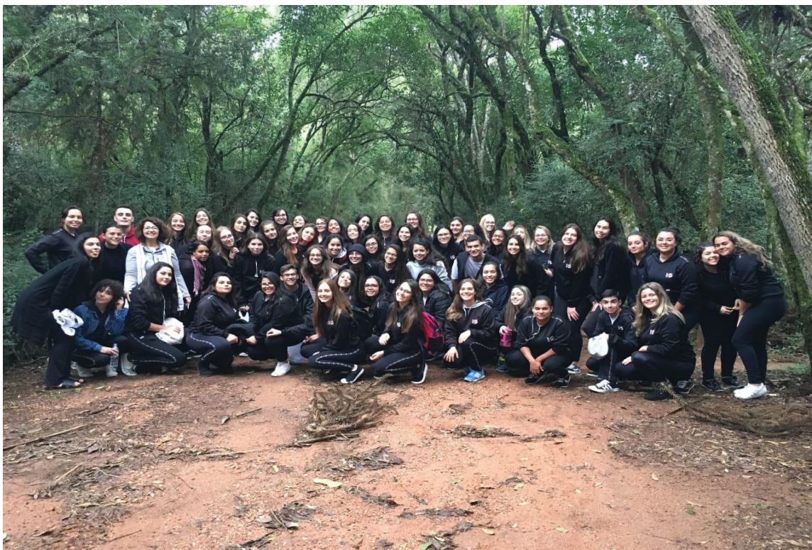
FIGURA 21 – Sustentabilidade

Na ocasião eu tinha em mente realizar uma contação de histórias para as crianças em meio à floresta com criaturas como saídas de contos de fadas. Mas, não foi possível porque teríamos que ter autorização para receber os alunos no parque, precisaria de transporte escolar, com atividades ao ar livre precisamos da colaboração do tempo, e não queríamos depredar o local. Já na trilha das araucárias um projeto que é desenvolvido pela Fiat, participamos de uma visita guiada onde em contato com a natureza aprendemos como cuidar da mata das florestas de araucárias, aproveitamento da água da chuva, manejo sustentável.