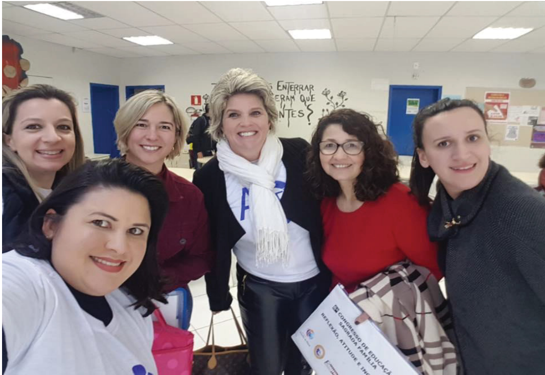
FIGURA 5 – Entusiasmo