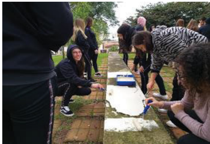
FIGURA 25 – Mão na massa

Depois destas atividades de campo, nas rodas de conversa surgiram muitas ideias para contribuir com o meio ambiente; a principal foi a revitalização da praça em frente ao colégio. Os alunos se organizaram para buscar doações de tintas, galões para lixeira, pincéis, conseguiram plantas no horto da cidade, sacos para coleta de lixo. Já em sala de aula elaboraram folders instrutivos sobre a natureza e nossa responsabilidade em cuidar distribuindo aos transeuntes. Realizaram um belo trabalho, conscientizaram toda a comunidade. Foi um belo movimento!