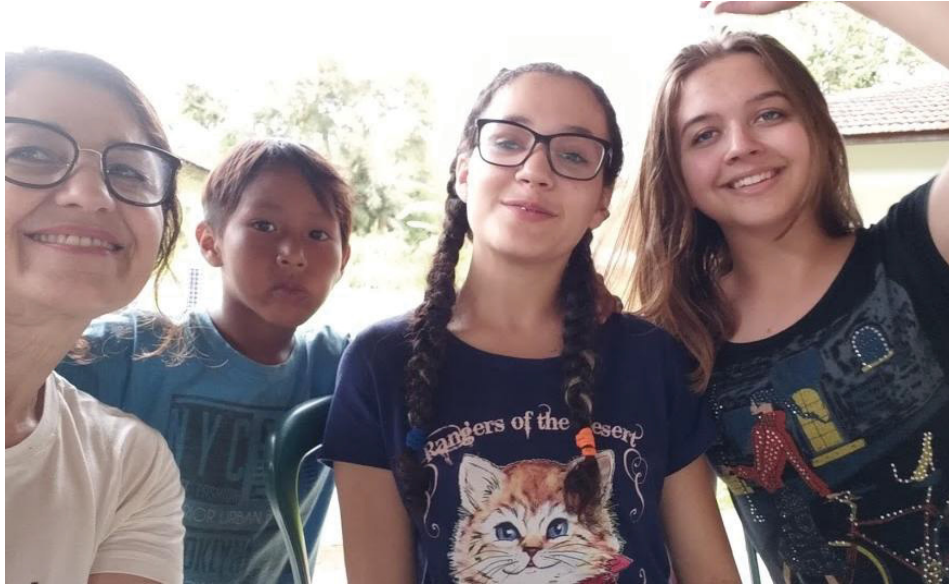
FIGURA 15 – Aldeia