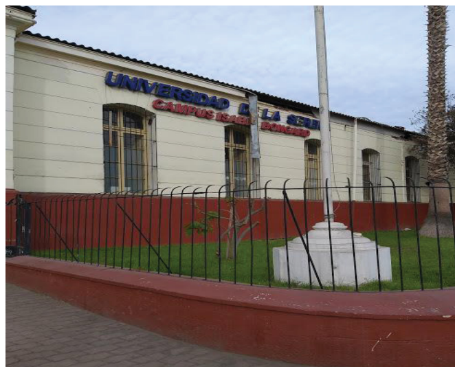
FIGURA 11 – Universidad De La Serena