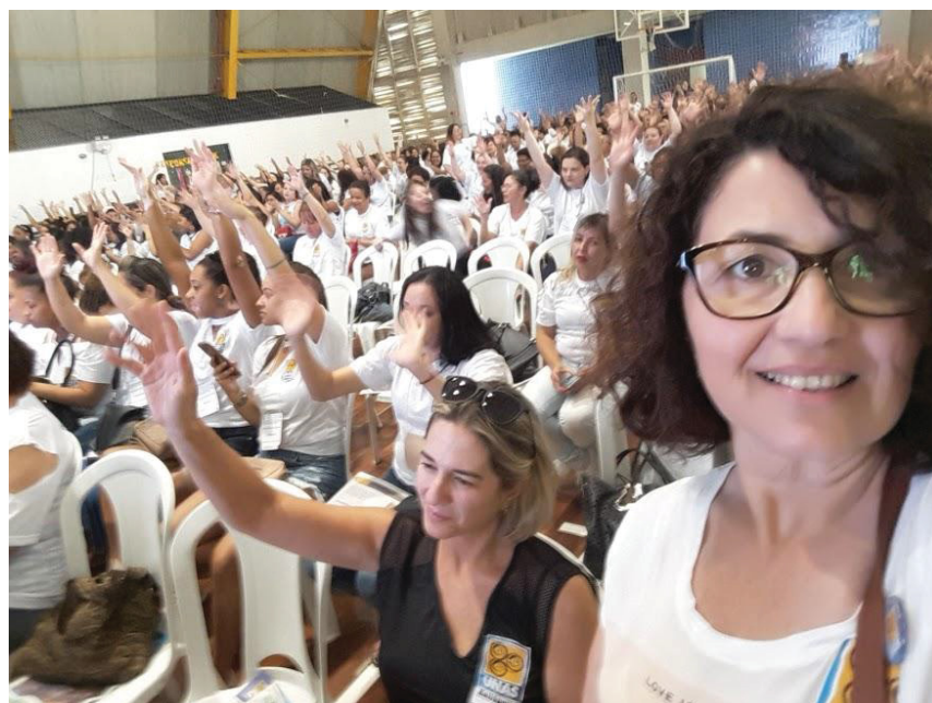
FIGURA 10 – Esperança