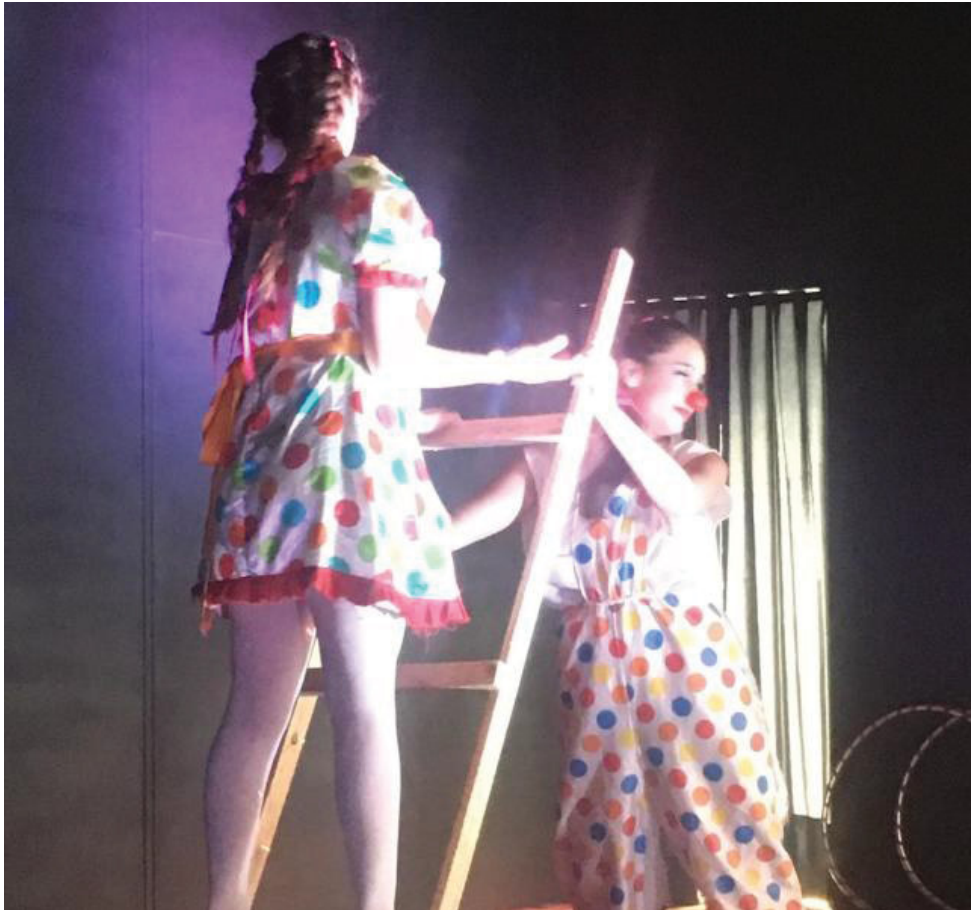
FIGURA 30 – Alunos

Em sala de aula se dividiram em equipes de acordo com as habilidades de cada um, e foi assim que surgiram os palhaços, mágicos, dançarinas, equilibristas dando vida ao espetáculo do CIRCO ZIRIGUIDUM. Esta atividade tomou uma grande proporção, foi apresentado para cerca de 1200 crianças que estudam na rede municipal e para os pais e familiares dos alunos. Foi um sucesso!