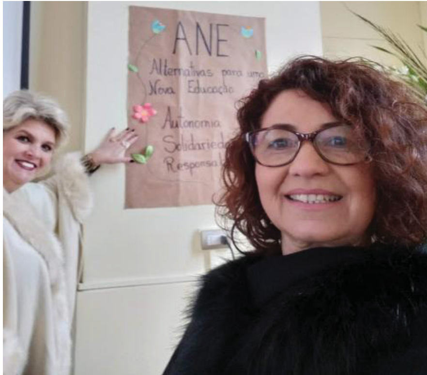
FIGURA 12 – Preparação do espaço para demonstração das atividades do grupo ANE