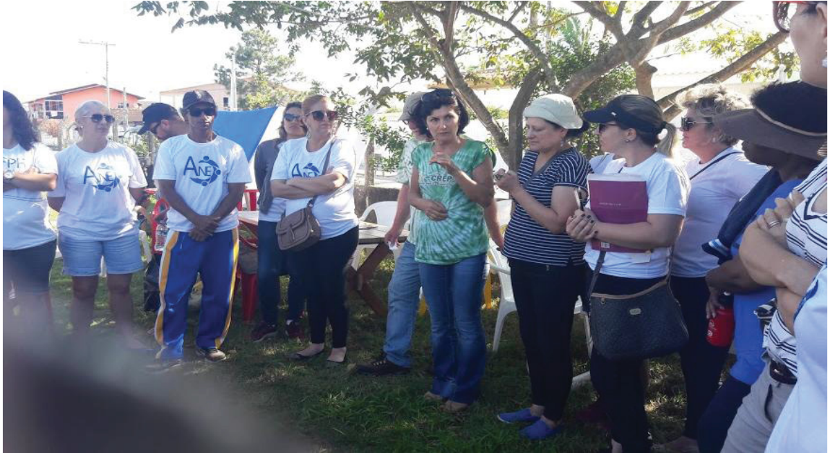
FIGURA 7 – Faça sua parte