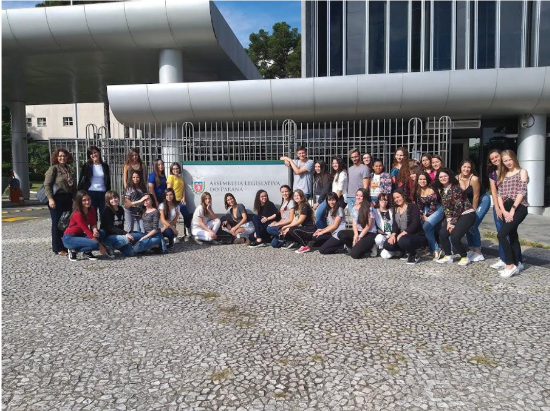
FIGURA 31 – Protagonismo