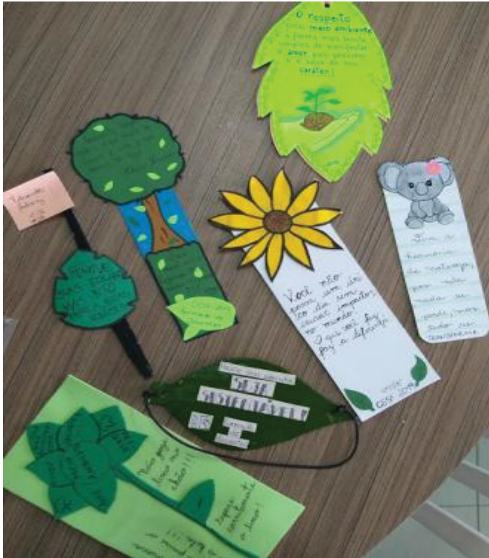
FIGURA 26 – Arte

Momento da prática, todos se dedicaram muito para que as mudanças fossem significativas.