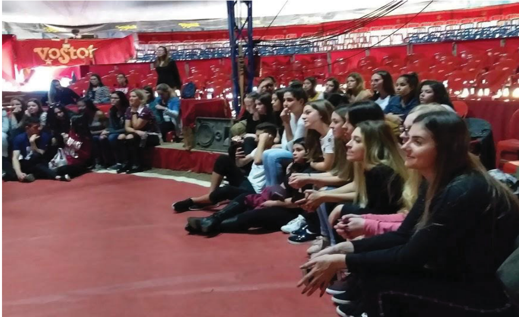
FIGURA 28 – O circo