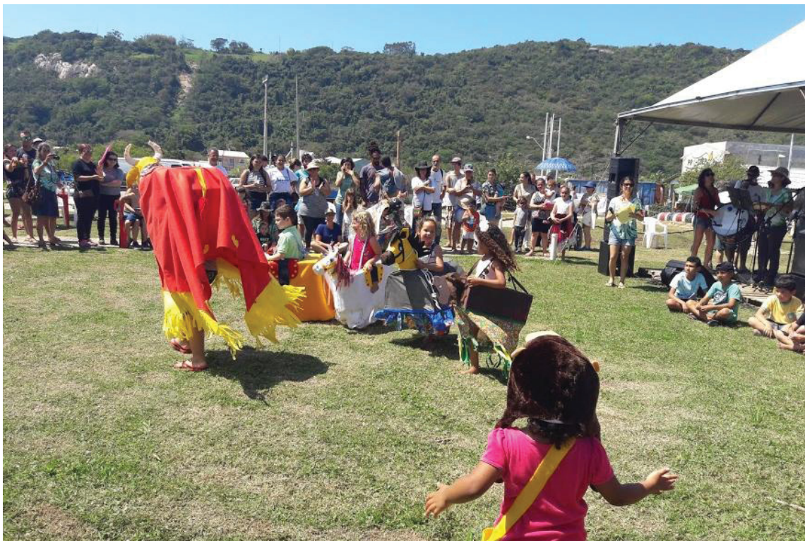
FIGURA 6 – Ação