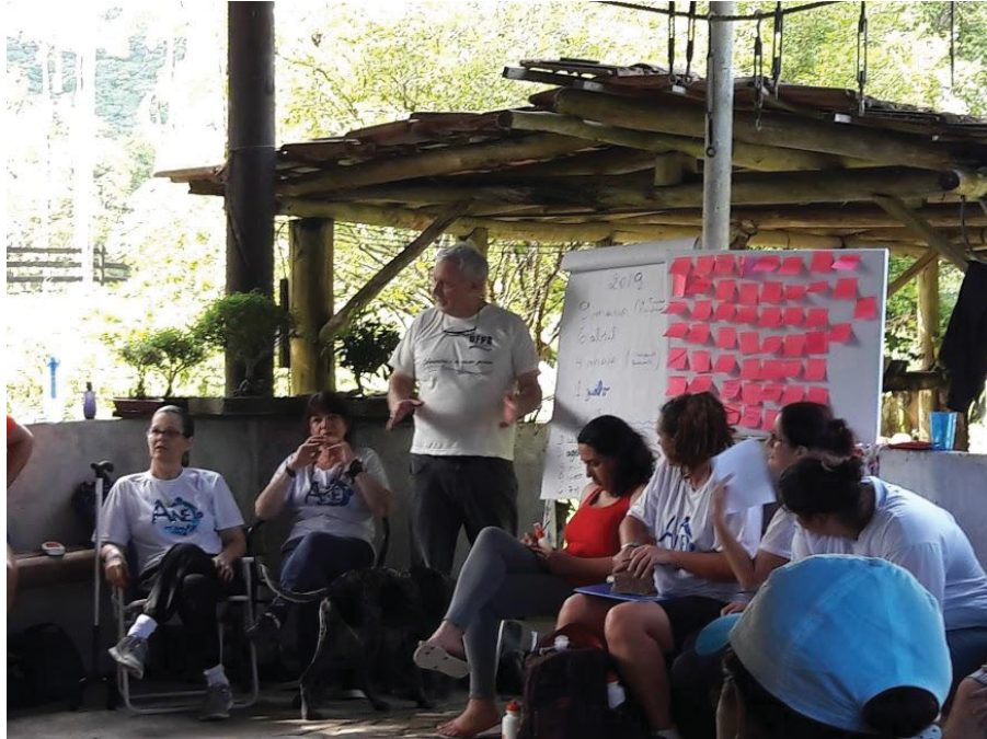
FIGURA 19 – Tudo sobre nós