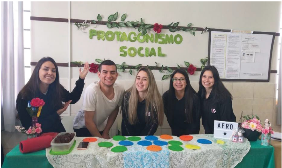
FIGURA 32 – Práxis