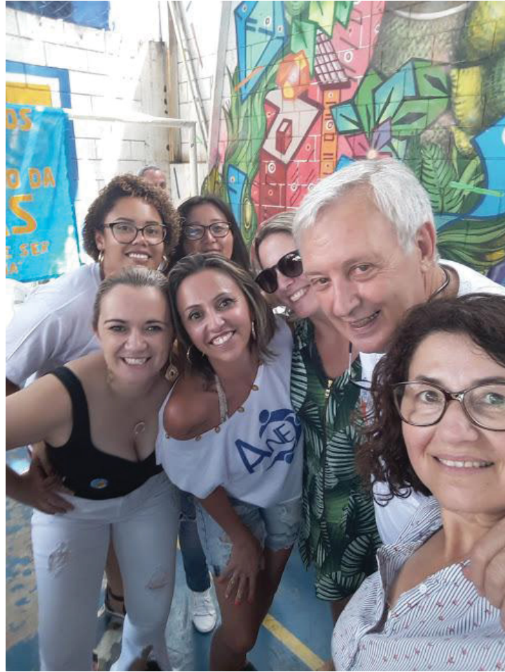
FIGURA 9 – HELIÓPOLIS