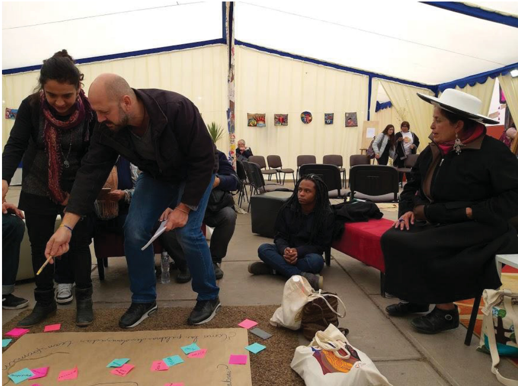
FIGURA 14 – Participação

Foram desenvolvidas atividades em grupo, onde a reflexão chamou nossa atenção para a descolonização das palavras. Como as palavras criam e formam nossos projetos? Produzimos um cartaz com palavras significantes em nossa caminhada.