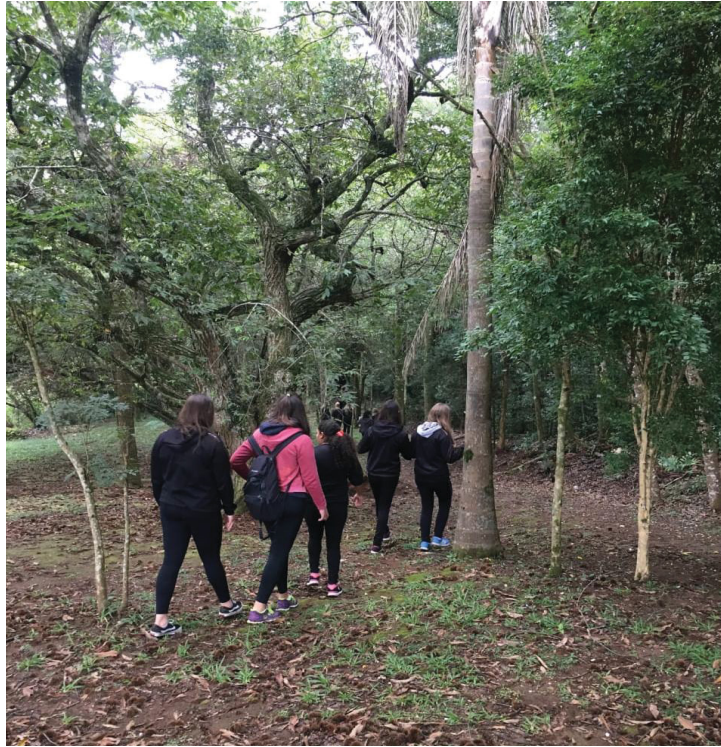
FIGURA 22 – Um caminho