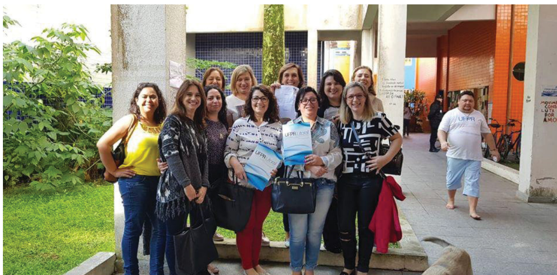
FIGURA 2 – O caminho

Preparamos nossos projetos e enviamos à seleção, aguardando o resultado que em poucos dias seria compartilhado pela renomada Universidade. Uma alegria imensa sentimos ao verificar a lista de aprovados e, a partir daí, começamos a nos organizar para estar presentes nas aulas da ANE UFPR Litoral. Mas o que seria esta nova discussão e aprendizado sobre a educação? Muitas dúvidas e ansiedade até que as “aulas” começaram acontecer.