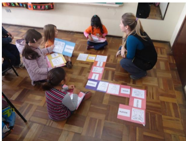
Figura O1 – Jogo de Dominó (28/06/2013)

No dia 28 de junho, novamente, presenciamos uma prática de trabalho contextualizado, tendo como disparador o poema “O rato rói tudo”. Na etapa que acompanhamos, a professora utilizou-se de um jogo de dominó confeccionado com base no texto do poema, que as crianças jogaram divididas em grupos, como apresentado na Figura O1 e O2 – Jogo de Dominó (26/06/2013).