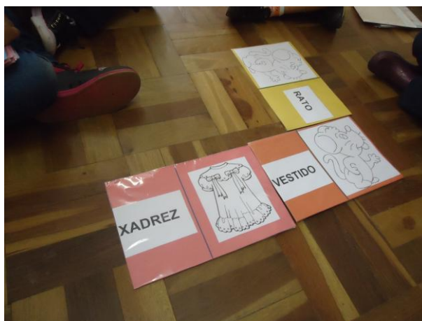
Figura 02 – Jogo de Dominó (28/06/2013)

Durante o jogo, as crianças precisavam fazer a assimilação entre a representação por desenhos e também pela escrita, seguindo as regras normais do jogo de dominó.