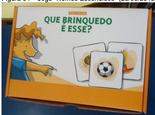
Figura 05 – Jogo “Que brinquedo é esse?” (28/06/2013)