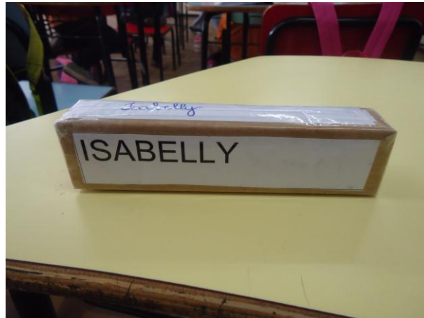
Figura 06 – Crachá: Letra Caixa Alta (05/07/2013)

formatos de letras. Também nos crachás das crianças que explorava os formatos de letra caixa alta e cursiva, permitindo, concretamente, que as crianças construíssem suas passagens, seus processos de transação de uma letra para a outra.