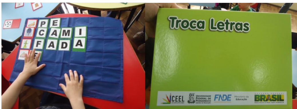
Figura 03 – Jogo “Troca Letra” (28/06/2013)

Os jogos formam outra ferramenta concreta utilizada pela professora, como já foi apresentado no jogo do dominó do poema “ O rato rói tudo ”, mas também com outros jogos prontos e confeccionados. Na observação do dia 28 de junho, junto com o dominó, presenciamos a circulação de outros jogos, como segue alguns exemplos,