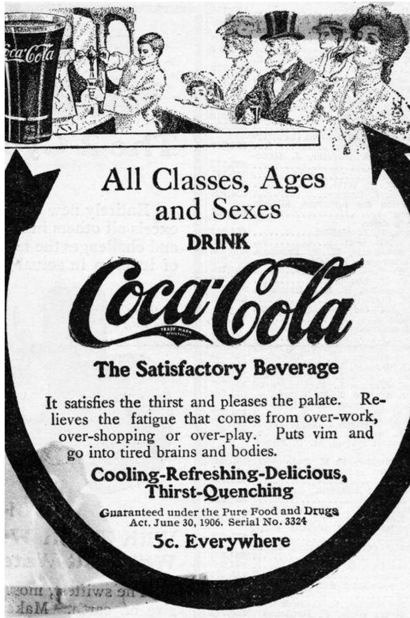
FIGURA 1 – TODAS AS CLASSES, IDADES E SEXOS BEBEM COCA-COLA