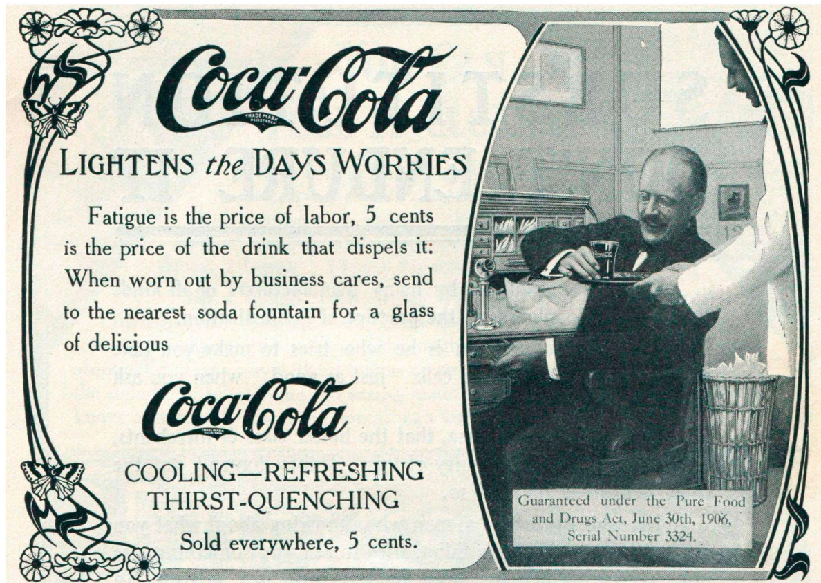
FIGURA 2 – REFRESCANTE, PARA MATAR A SEDE EM DIAS DIFÍCEIS