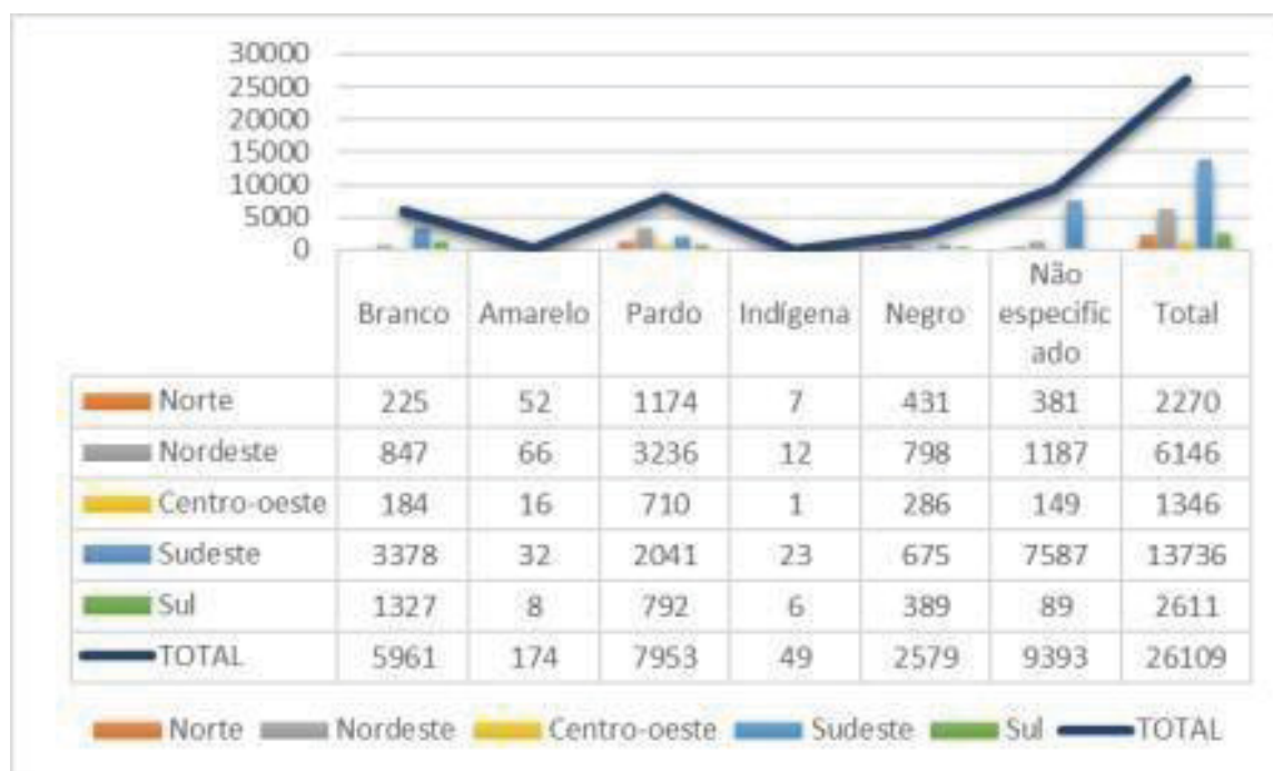
Figura 2 - Raça/Etnia do Adolescente do Sistema Socioeducativo / 2017