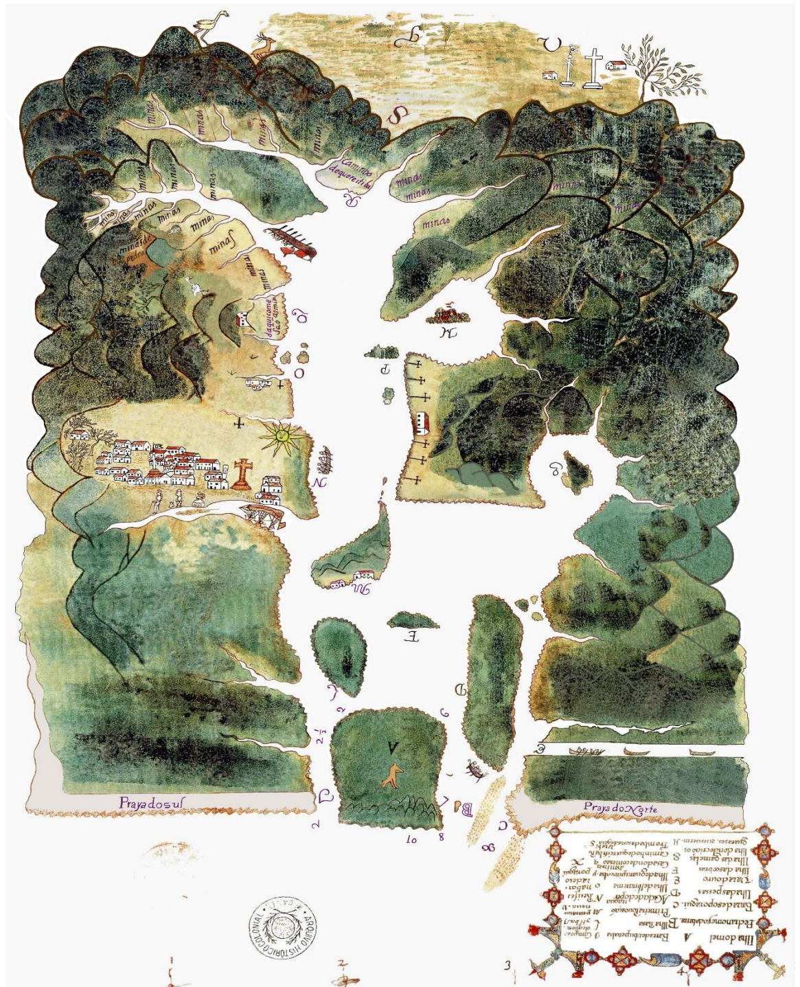
Figura 1 – Mapa da Baía de Paranaguá (1653) de Pedro de Souza Pereira.

século XVIII: o mapa da baía de Paranaguá, de Pedro de Souza Pereira (1653). afirma que havia 21 indicações de minas no litoral do Paraná. Portanto o que torna o mapa mais antigo e conhecido ainda hoje no Brasil é o que apresentamos a continuação: