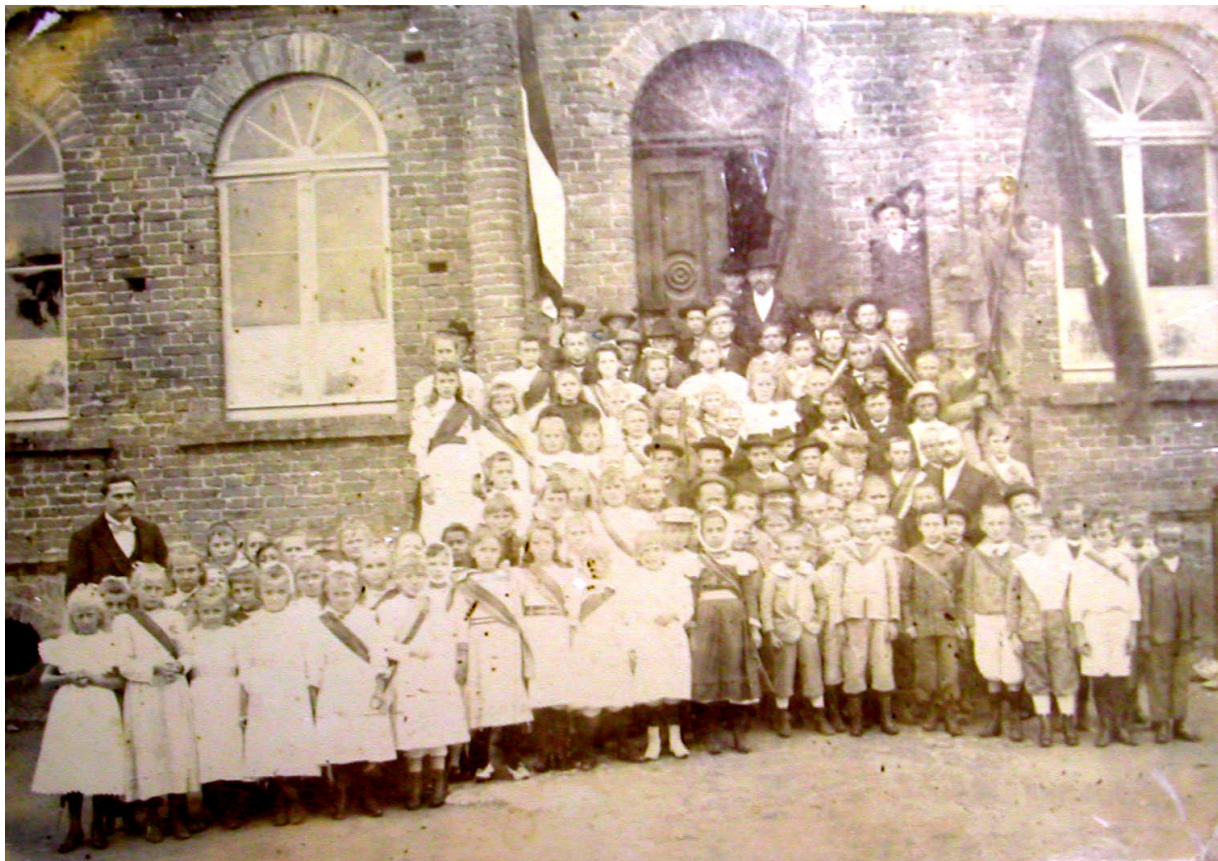
PROFESSORES E ALUNOS EM FRENTE AO PRIMEIRO EDIFÍCIO ESCOLAR. S/D.