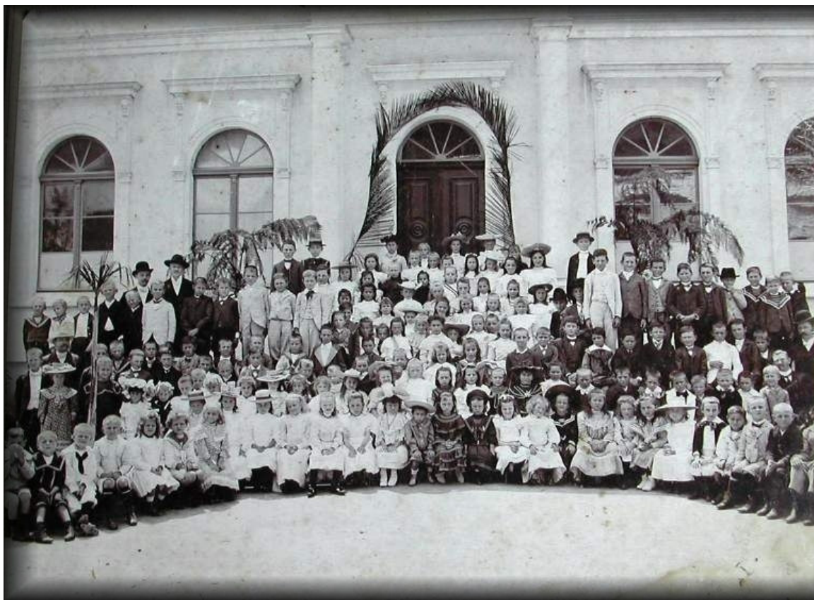
ALUNOS E ALUNAS DA DEUTSCHE SCHULE, S/D.