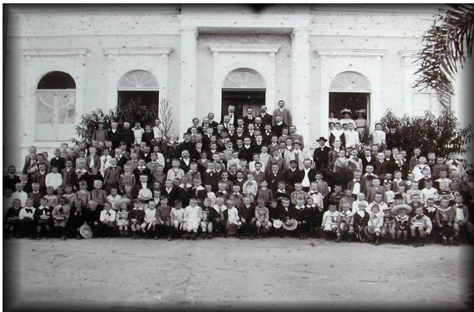
ALUNOS DA DEUTSCHE SCHULE, S/D.