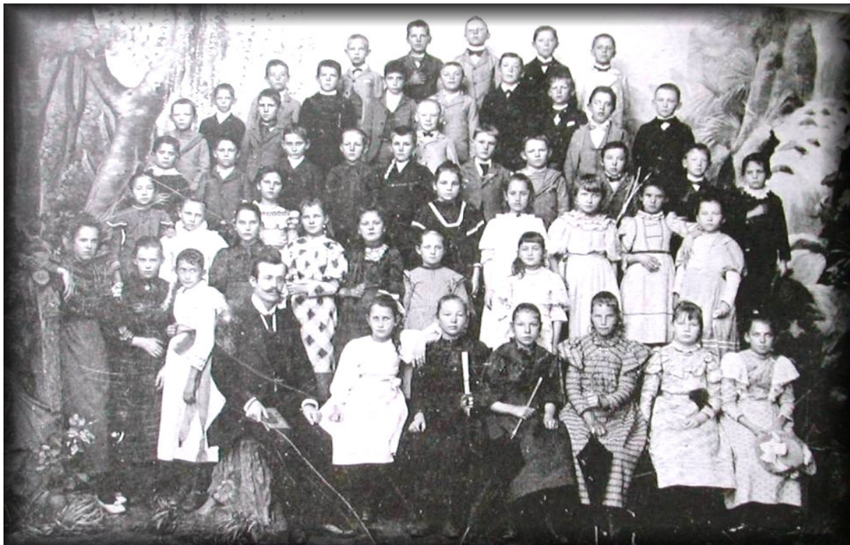
TURMA DE ALUNOS DA DEUTSCHE SCHULE – 1897