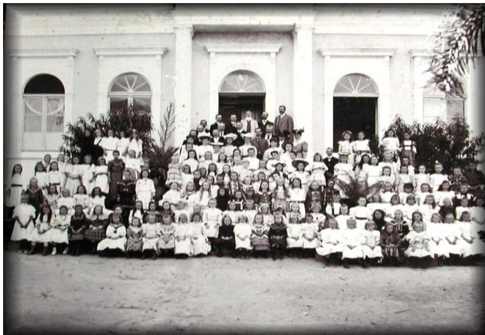
ALUNAS DA DEUTSCHE SCHULE, S/D.