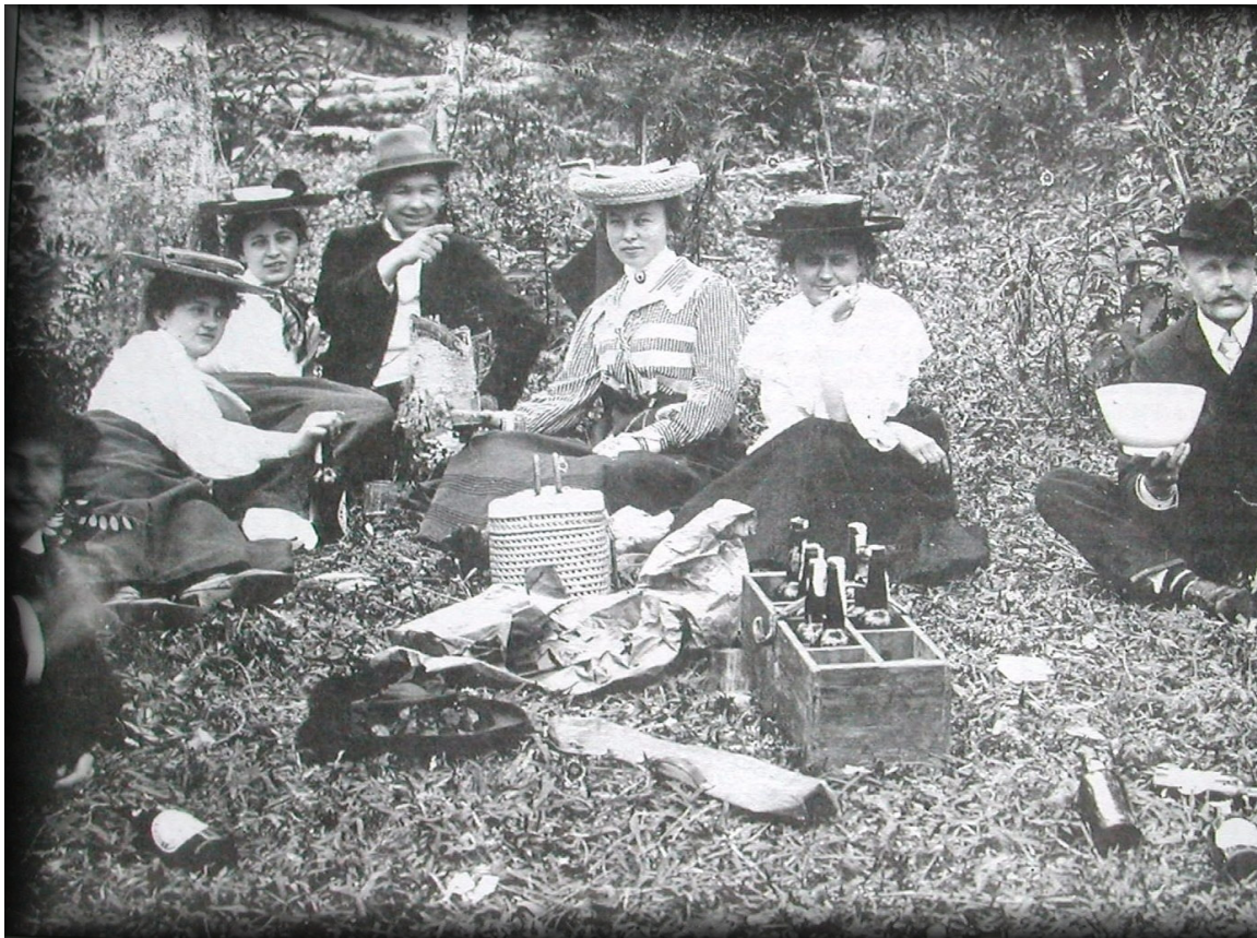
PIQUENIQUE DE MEMBROS DA COLÔNIA ALEMÃ, 1905