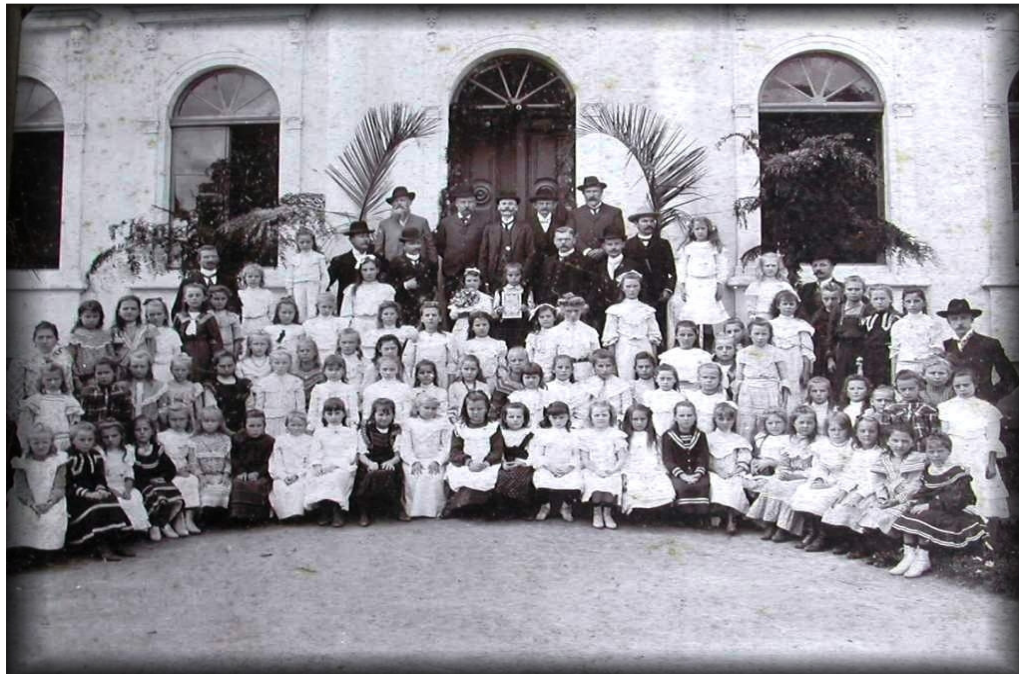
ALUNAS DA DEUTSCHE SCHULE , S/D.