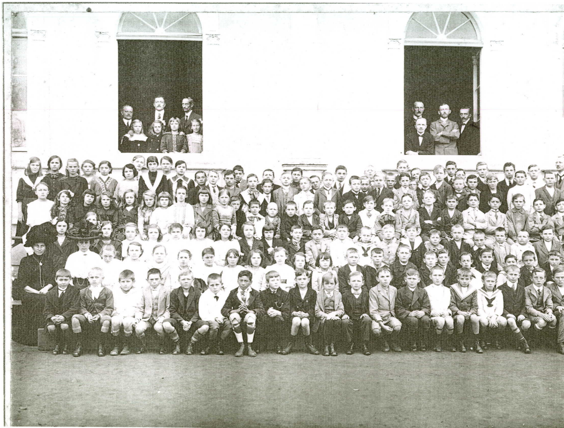
ALUNOS E ALUNAS DA DEUTSCHE SCHULE , 191[3].