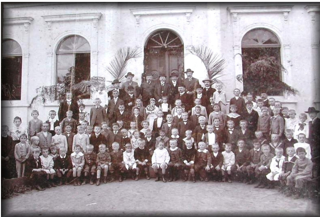
ALUNOS DA DEUTSCHE SCHULE , S/D.