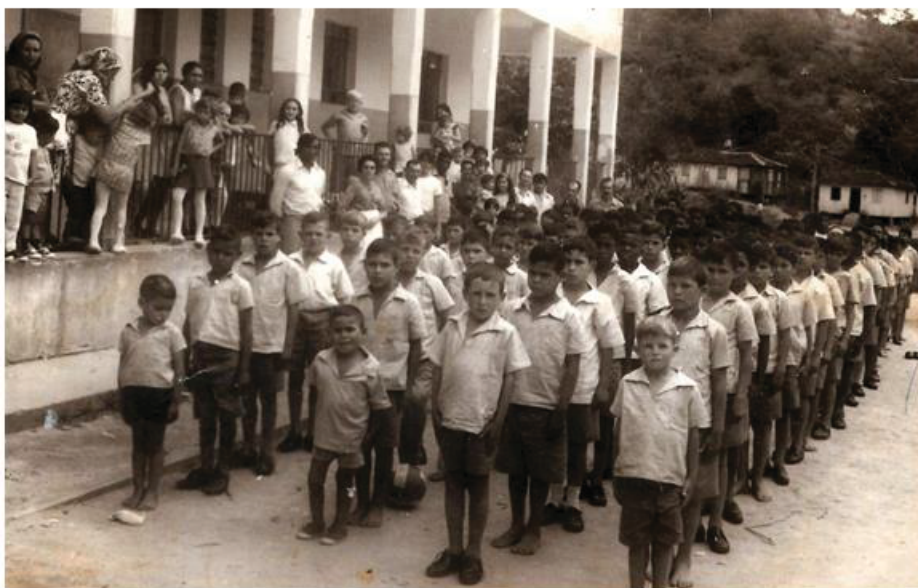
Figura 1: Alunos do Instituto São Francisco Xavier