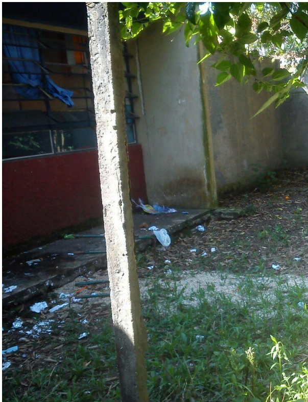
FOTOGRAFIA 02 – Área externa de uma sala de aula do Colégio Jayme Canet.

Considerando a realidade do Colégio Jayme Canet, é possível perceber em muitos alunos algumas atitudes que vão contra os princípios básicos da educação ambiental. Como exemplo destaca-se o destino do lixo em locais impróprios e certa resistência para o desenvolvimento de determinadas ações ambientais.