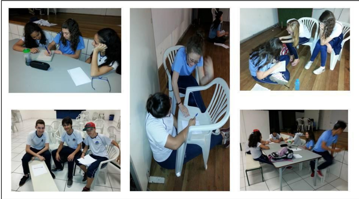
FOTOGRAFIA 06 – Participação dos alunos na construção do plano de ação ambiental para elaboração da Agenda XXI do Colégio Jayme Canet.

Após a formação efetiva do Grupo Ambiental do Colégio Jayme Canet, será elaborada de forma coletiva a Agenda XXI Escolar tomando como base a realidade do colégio e comunidade escolar. Dentre as ações que poderão ser implementadas pelo Grupo Ambiental, destacam-se: