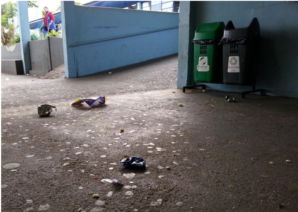
FOTOGRAFIA 01 – Aspecto do pátio escolar após o horário do intervalo.

Para tentar responder a esta indagação torna-se necessário identificar as maneiras que podem contribuir para o desenvolvimento das ações que resultarão na mudança de atitudes dos educandos. Neste contexto, o projeto parte de uma abordagem que tem o educando como agente de transformação, sendo assim, busca-se analisar suas ações e desenvolver outras, para que as mesmas contribuam na formação e transformação dos alunos em relação ao meio em que vivem. Neste sentido, espera-se encontrar um ponto passível de entendimento para sugerir uma possível resposta, satisfazendo a questão central e oferecendo uma parcela de contribuição aos estudos e trabalhos que contemplam a Educação Ambiental na escola.