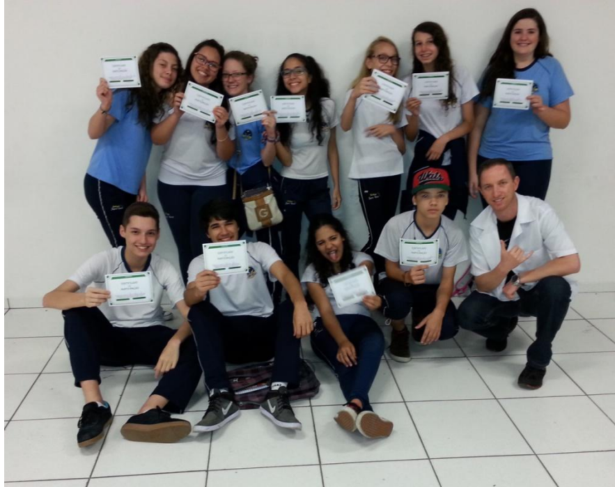
FOTOGRAFIA 07 – Grupo Ambiental “Unidos pela Natureza” do Colégio Estadual Jayme Canet.