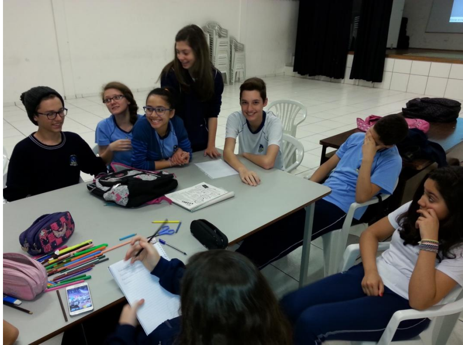
FOTOGRAFIA 04 – Escolha do nome e logotipo do grupo ambiental.

Após a formação do grupo ambiental, no encontro seguinte realizado no dia 16/09/2015, foi desenvolvida uma atividade de percepção ambiental nos espaços do colégio. Na ocasião, os alunos registraram por meio de fotos todos os espaços ociosos que há na escola e que podem ser revitalizados e aproveitados para atividades pedagógicas discentes, além de observar as ações ambientais que podem ser realizadas nos referidos espaços. Esta atividade teve como objetivo a prática da percepção bem como gerar subsídios para a construção da Agenda XXI do Colégio Jayme Canet.