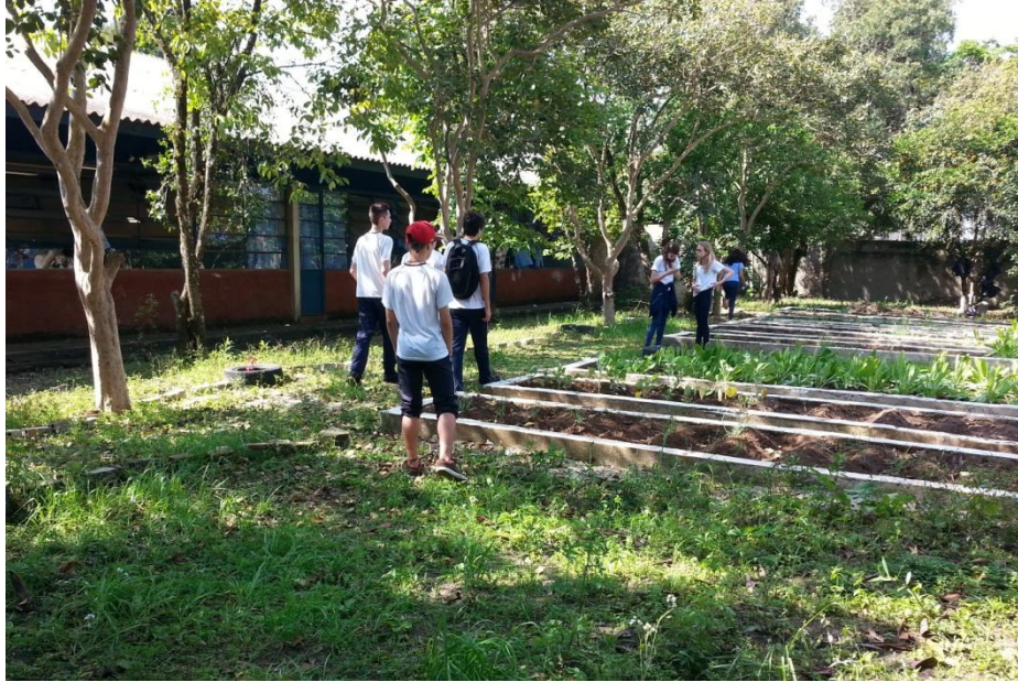
FOTOGRAFIA 05 – Participação dos alunos do grupo ambiental durante atividade de percepção ambiental nos espaços do colégio.

O último encontro do grupo aconteceu no dia 23/09/2015 e teve como objetivo discutir a atividade de percepção ambiental realizada no encontro anterior bem como construir um plano de ação ambiental constando os compromissos que farão parte da Agenda XXI do Colégio Jayme Canet.