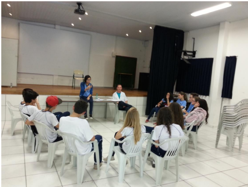
FOTOGRAFIA 03 – Apresentação do projeto e conceitos aos alunos inscritos. FONTE: O autor (2015).

Para a formação do referido grupo, fez-se necessário apresentar o conceito de grupo ambiental e as suas atribuições junto à comunidade escolar. Para isso, foi elaborada uma fundamentação teórica embasada em autores que abordam o tema bem como nas legislações pertinentes que regulamentam a Educação Ambiental no país e conseqüentemente apresentada aos alunos do colégio. A partir desta apresentação, foi aberto um período de inscrição a fim de verificar a quantidade de alunos com pretensão de ingressar no grupo ambiental. Visando a qualidade do trabalho e das ações a serem realizadas foram disponibilizadas 15 vagas e todas foram ligeiramente ocupadas.