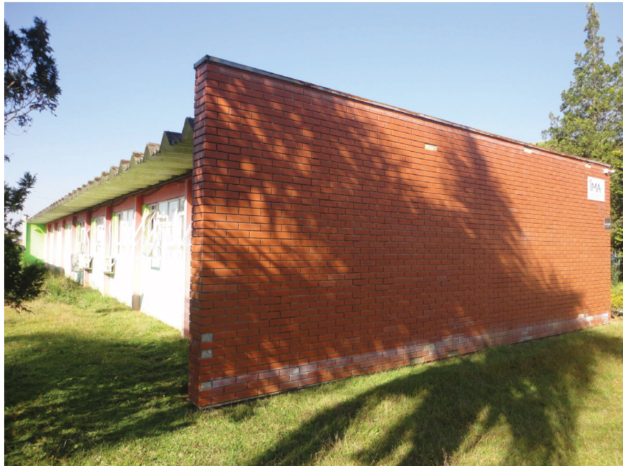
Figura 1. Fachada da regional de Mafra do Instituto de Meio Ambiente de Santa Catarina - IMA/SC

Trata-se de um estudo de caso, tomando por base o bloco da regional de Mafra do Instituto do Meio Ambiente de Santa Catarina (IMA/SC), o qual recebe direta radiação solar, principalmente nas faces leste e norte, e possui telhado de canaletão com forro interno de PVC, transmitindo muito calor ao ambiente interno e, desta maneira, comprometendo o conforto térmico, mesmo com o uso de equipamentos de climatização, bem como podendo afetar o ritmo de trabalho dos servidores.