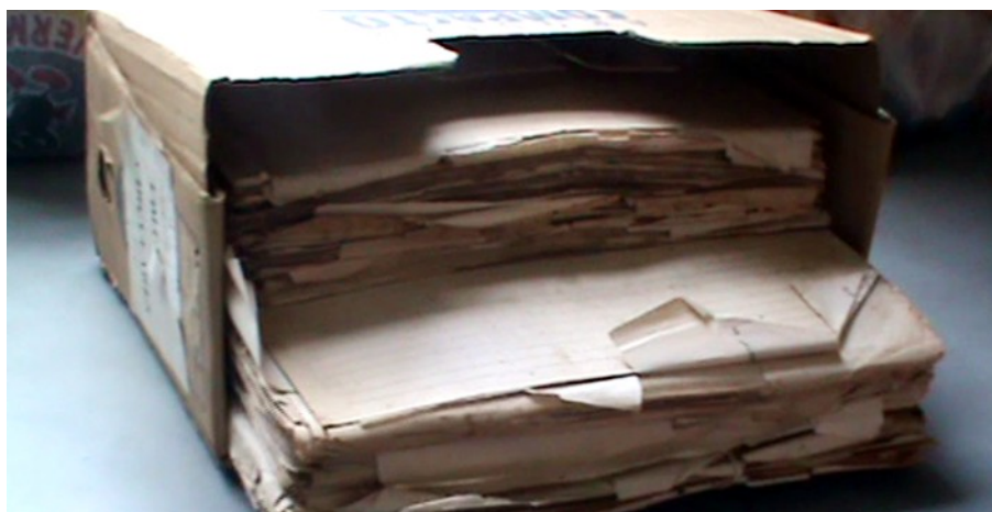
Figura 8: Caixa antiga.

Ao mexer com papéis há muito tempo “esquecidos”, acabou encontrando-se alguns muito antigos e em estado de conservação precário. As atas de 1954 e 1958, que estavam amarradas com barbante, exemplificam essa questão (cf. Figura 8 e Figura 9).