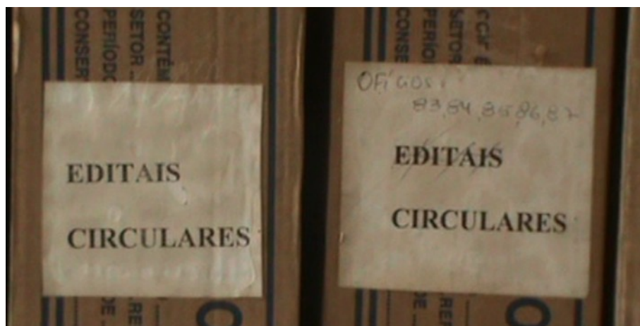
Figura 3: Reutilização de etiquetas.

Para dimensionar a quantidade de caixas e documentos, foram listadas as descrições contidas nas etiquetas das caixas-arquivos. Notou-se que os documentos armazenados não seguiam um padrão de organização. Em outras palavras, foram encontrados documentos que não estavam de acordo com o descrito na própria caixa-arquivo. Verificar que na figura 3 a descrição impressa na etiqueta fora substituída (riscada) pela informação descrita a caneta.