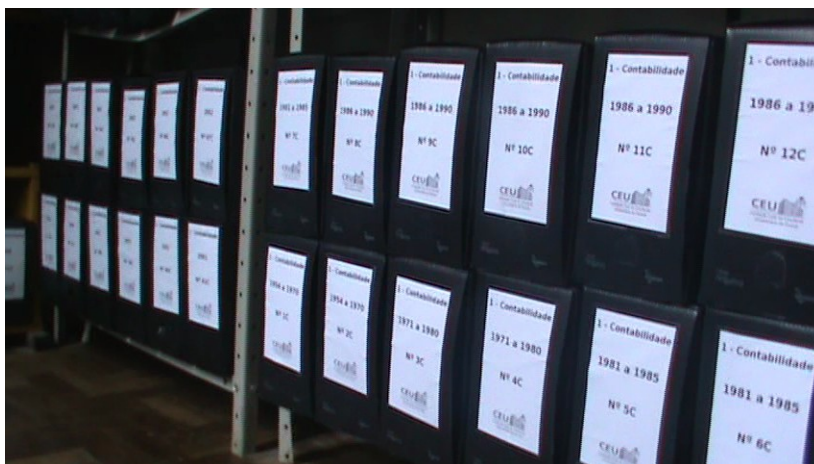
Figura 7: Estanterias organizadas.

Ao mexer com papéis há muito tempo “esquecidos”, acabou encontrando-se alguns muito antigos e em estado de conservação precário. As atas de 1954 e 1958, que estavam amarradas com barbante, exemplificam essa questão (cf. Figura 8 e Figura 9).