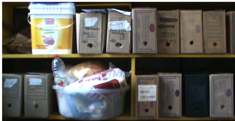
Figura 1: Alimentos e documentos.

As cortinas, a fim de evitar a direta incidência de luz solar sobre os produtos armazenados na sala, permanecem sempre fechadas. Esse fato, mesclado a falta de lâmpadas suficientes, deixa o lugar mal iluminado. É nesse sombrio ambiente que caixas-arquivos disputam espaço com alimentos e produtos de limpeza (cf. Fig. 1).