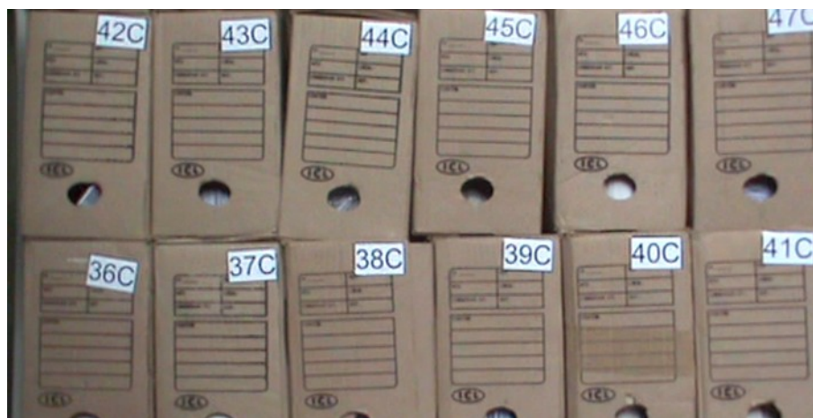
Figura 4: Etiquetas provisórias.

Para elaborar o plano de classificação documental foi necessário criar duas tabelas em Excel: uma destinada aos tipos documentais referentes a contabilidade (cf. Apêndice B) e outra referentes à Administração. Com este registro foi possível fazer o agrupamento e remanejamento dos documentos nas caixas-arquivos. Estas, foram etiquetadas provisoriamente com uma nova numeração seguida da letra “A” (administração) ou “C” (contabilidade) (cf. Figura 4).