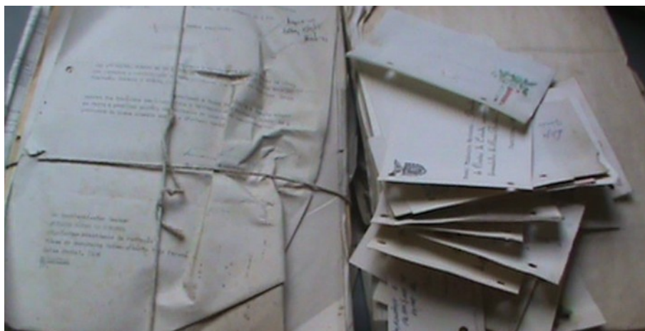
Figura 9: Documentos antigos.

Foram utilizadas luvas descartáveis plásticas para manusear os documentos de cunho histórico, conforme aconselha o Manual de Gestão de Documentos do Arquivo Público do Paraná (cf. Figura 10).