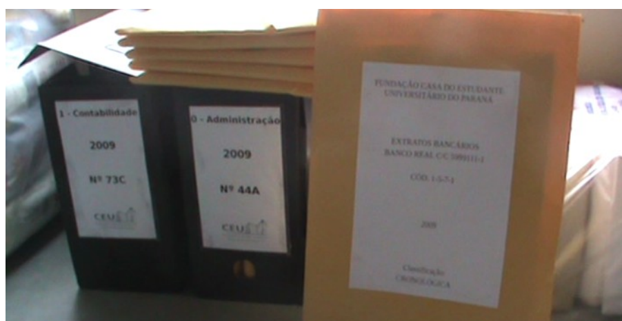
Figura 6: Pastas organizadas.