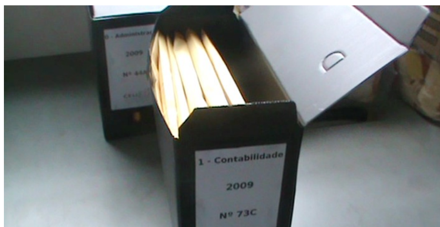
Figura 5: Caixas organizadas.

dos documentos arquivados. As caixas-arquivos de papelão, por exemplo, cederam espaço para as caixas-arquivos de polietileno, um material mais resistente e que confere melhor qualidade ao acondicionamento dos documentos. Outro exemplo de significativa mudança foi a substituição dos trilhos metálicos, em sua grande maioria enferrujados, por trilhos plásticos. Por fim, o uso de plásticos e envelopes no acondicionamento dos papéis conferiu-lhes melhor preservação (cf. Figuras 5, 6 e 7).