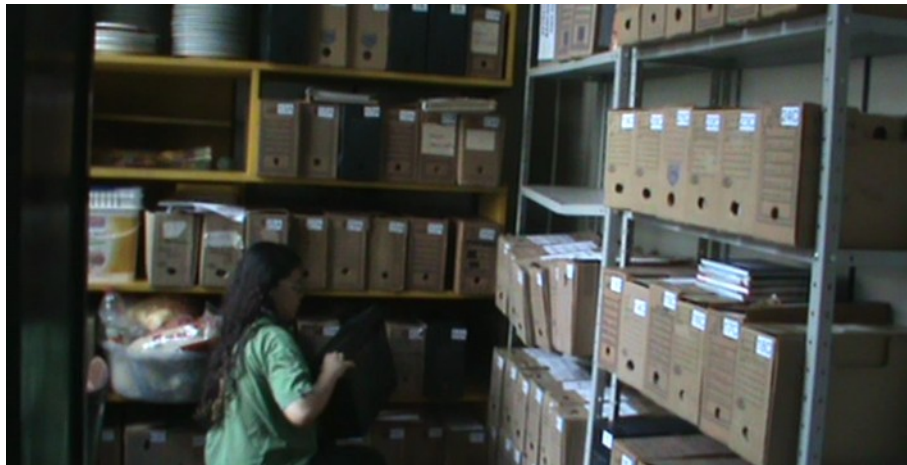
Figura 2: Estanterias.

Para dimensionar a quantidade de caixas e documentos, foram listadas as descrições contidas nas etiquetas das caixas-arquivos. Notou-se que os documentos armazenados não seguiam um padrão de organização. Em outras palavras, foram encontrados documentos que não estavam de acordo com o descrito na própria caixa-arquivo. Verificar que na figura 3 a descrição impressa na etiqueta fora substituída (riscada) pela informação descrita a caneta.