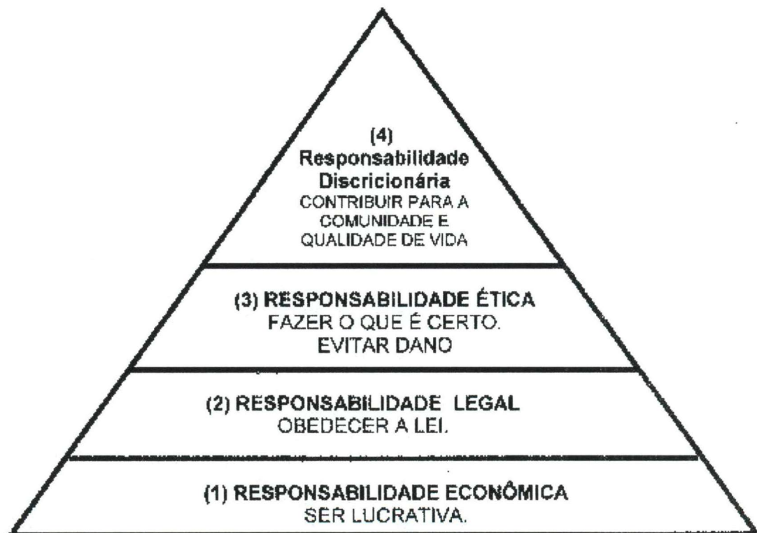
Figura 1 – Os quatro tipos de responsabilidade social Total Responsabilidade Social da Organização

De acordo com o modelo piramidal de Archie Carrol (citado em Daft, 1999) 8 , a responsabilidade social da empresa pode ser subdividida em quatro tipos: econômica, legal, ética e discricionária (ou filantrópica). A Figura 1 apresenta este modelo, onde "(...) as responsabilidades são ordenadas da base para o topo em função de sua magnitude relativa e da frequência dentro da qual os gerentes lidam com cada aspecto" (Daft, 1999, p90). A seguir são apresentados conceitos relativos a cada um dos quatro tipos: