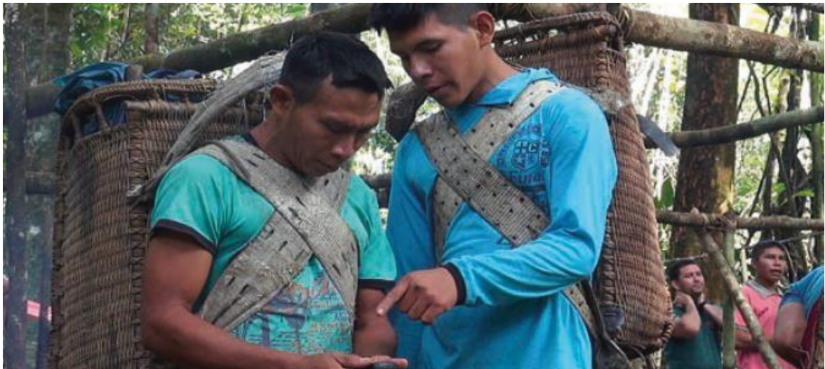
FIGURA 20 - MONITORAMENTO DA TRILHA

igarapés e brejos, possíveis momentos entre névoas, chuviscos ou tempestades e cuidados nos serviços prestados. Quanto ao traslado, os Yanomami são responsáveis a partir de São Gabriel da Cachoeira, onde recebem os visitantes nas canoas das comunidades para seguir viagem até o início da trilha, onde seguem a caminhada rumo ao Yariipo (Pico da Neblina). A hospedagem é feita em acampamento móvel (FIGURA 21), carregado e montado/desmontado pelos indígenas durante a expedição, e a alimentação é preparada ao longo do trajeto, com cardápio inspirado na cultura alimentar Yanomami, com os insumos adquiridos nas próprias comunidades. A venda de artesanato é responsabilidade da Associação das Mulheres Yanomami Kumiryoma.