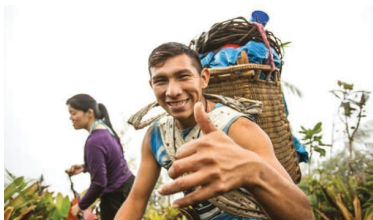
FIGURA 9 - CARREGADOR YANOMAMI NA EXPEDIÇÃO YARIPO