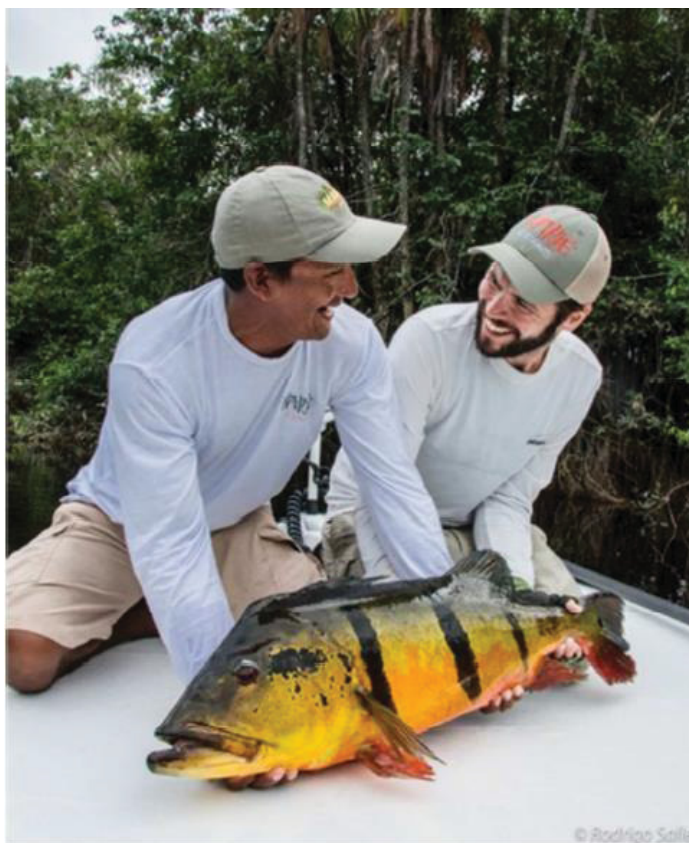
FIGURA 6 - PESCA ESPORTIVA RIO MARIÉ