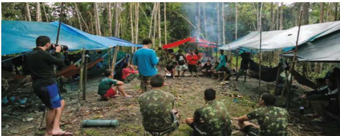
FIGURA 21 - ACAMPAMENTO MÓVEL