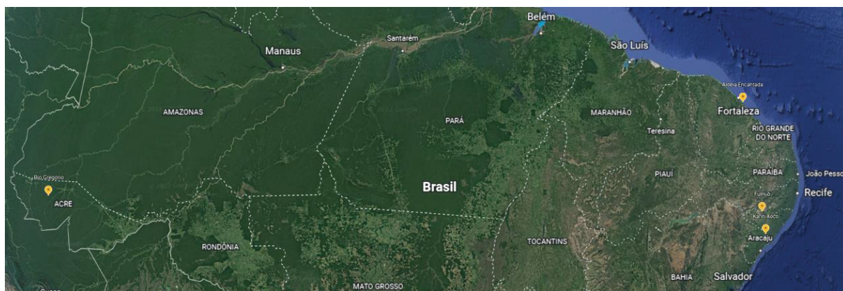
FIGURA 26 - MAPA NORTE E NORDESTE BRASILEIRO: ALDEIAS CAMPINA, LAGOA BONITA, FULNI-Ô E KARIRI XOCÓ