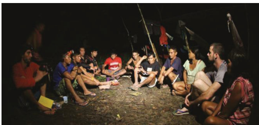
FIGURA 14 - RODA DE CONVERSA COM O PAJÉ YANOMAMI

populações vulnerabilizadas, que enfrentam sérios conflitos em seus territórios. Não considerando apenas a dimensão econômica, mas principalmente valorizar os elementos da história, cultura, sagrado, das relações interétnicas, políticas, etc (FIGURA 14). As comunidades mantêm o domínio do desenvolvimento sustentável sobre seu território, com planejamento e gestão participativos, de atividades baseadas nos patrimônios culturais e naturais do local, apresentando o modo de vida e o BV das comunidades MORAES et al , 2013; HALLACK et al , 2011).