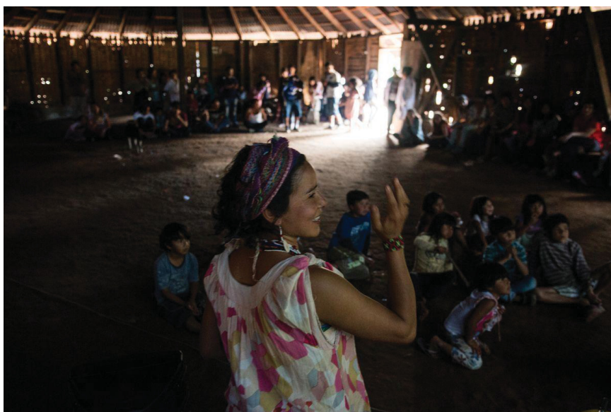
FIGURA 12 - CORAL MBYA GUARANI

informal e sem regulamentação na região, o que acarretou a urgência e a importância da aprovação do PV como uma ferramenta fundamental para regularizar e organizar as vivências no atual contexto do território (FIGURA 12), “tanto as que já ocorrem, como as que venham a ocorrer no futuro, garantindo que elas sejam realizadas com o mesmo respeito de quando se visita a casa de qualquer pessoa. Afinal, a Terra Indígena Tenondé Porã é nosso lar” (TENONDÉ PORÃ, 2018, p. 8).