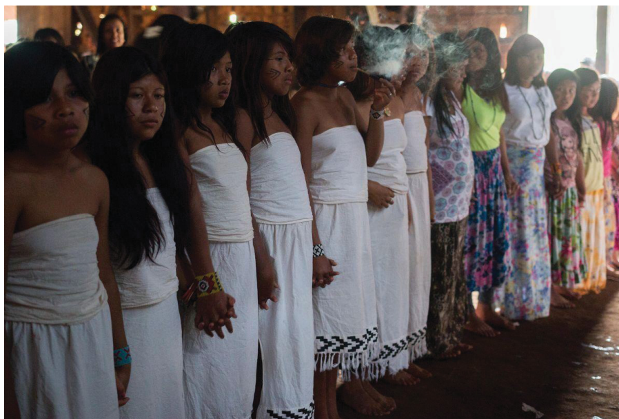
FIGURA 11 - CORAL MBYA GUARANI

quatro dias para grupos menores (entre 3 a 10 pessoas), que possibilita a participação em atividades do cotidiano da comunidade, mutirões agroecológicos, além das atividades oferecidas nos roteiros, incluindo alimentação e hospedagem em camping .