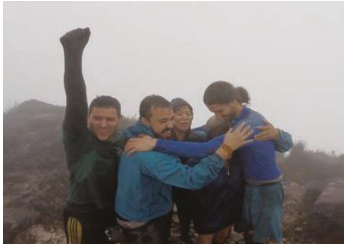
FIGURA 8 - EXPEDIÇÃO SUBIDA AO YARIPO (PICO DA NEBLINA)