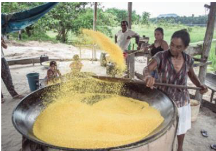
FIGURA 16 - RODA DE CONVERSA COM O PAJÉ YANOMAMI