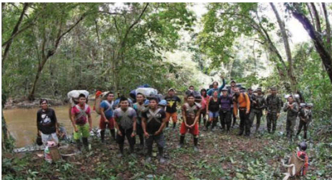
FIGURA 25 - EXPEDIÇÃO YARIPO

acontecem nas conversas e trocas durante os dias e atividades previstas nos roteiros, sem acesso e convívio direto aos ambientes das aldeias (SERRAS GERREIRAS, 2018; RIO MARIÉ, 2018; YARIPO, 2017; TENONDÉ PORÁ, 2019; MORAES, et al , 2013; HALLACK, et al , 2011; SANSOLO; BURSZTYN, 2009).