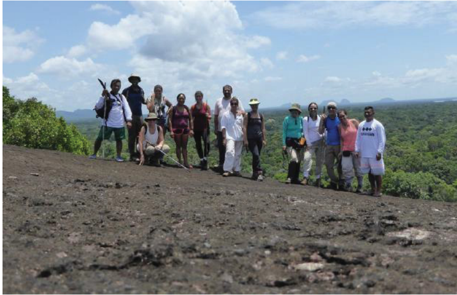
FIGURA 5 - EXPEDIÇÃO SERRAS GUERREIRAS TAPURUQUARA