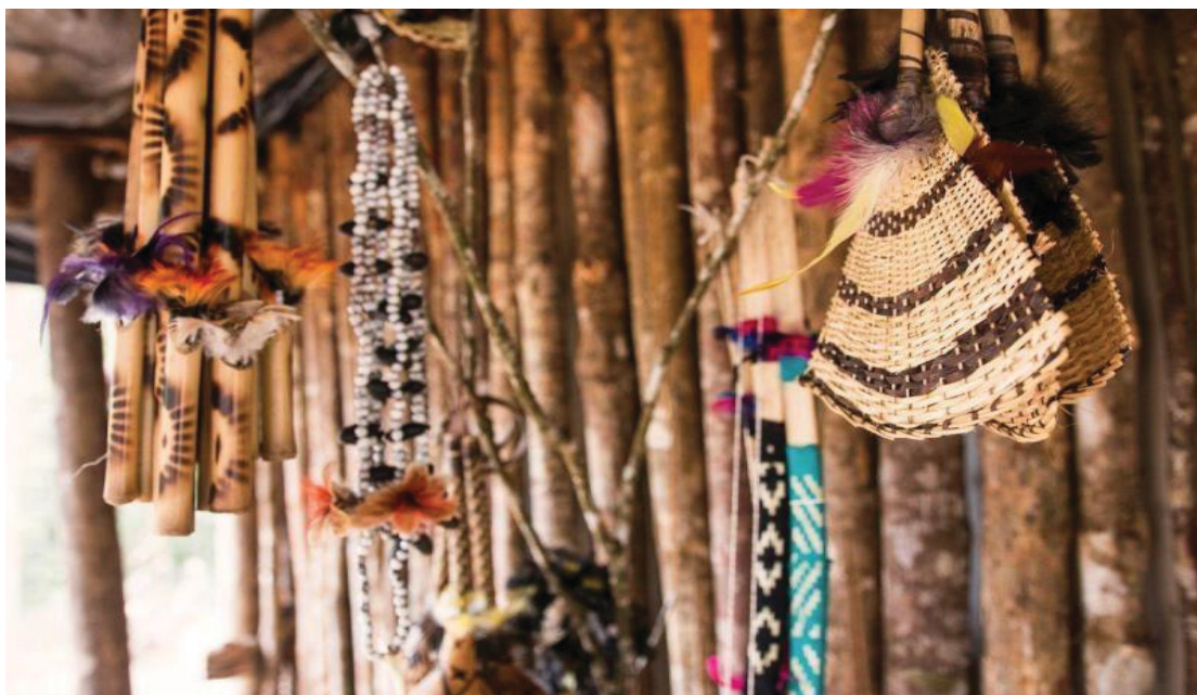
FIGURA 23 - COMERCIALIZAÇÃO DO ARTESANATO MBYA GUARANI