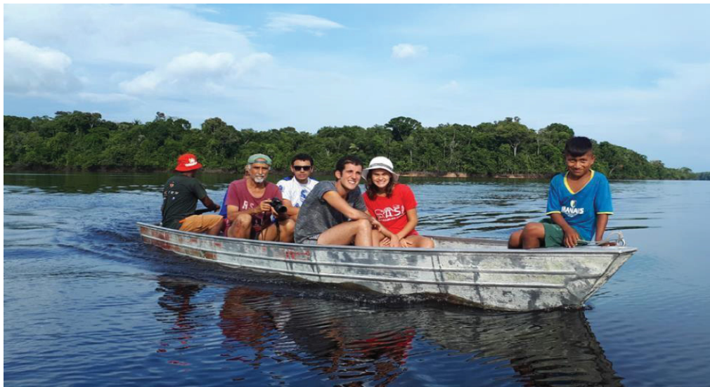
FIGURA 24 - ROTEIRO COM PASSEIO DE CANOA