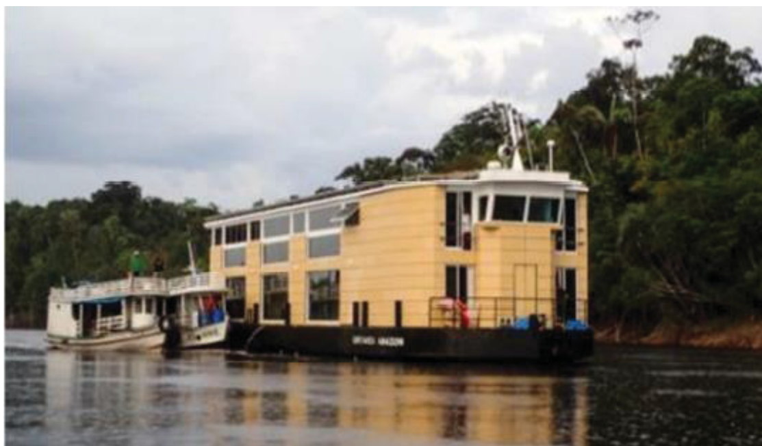
FIGURA 18 - BARCO-HOTEL