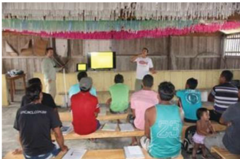
FIGURA 7 - REUNIÃO PV RIO MARIÉ

2018, p. 6). O plano de visitação foi realizado em parceria com a Associação das Comunidades Indígenas do Baixo Rio Negro (ACIBRN), a FOIRN e a empresa parceira e investidora Untamed Angling do Brasil (UAB), coordenado pela FUNAI, em parceria técnica com o IBAMA e o ISA (FIGURA 7), oferece pacotes de 7 dias para grupos de até 8 pessoas para prática de pesca esportiva (RIO MARIÉ, 2018).