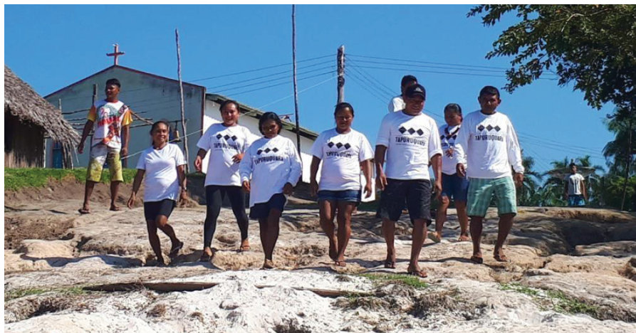
FIGURA 13 - COMUNIDADES PARTICIPANTES

FONTE: PV Serras Guerreiras do Tapuruquara (2018).