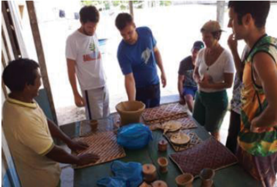
FIGURA 17 - COMERCIALIZAÇÃO DO ARTESANATO