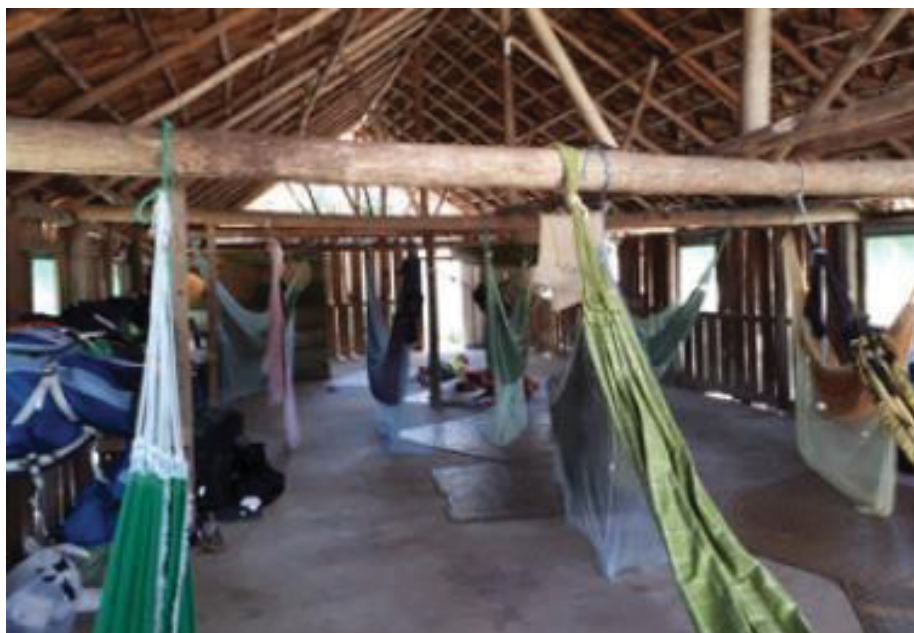
FIGURA 15 – ALOJAMENTO