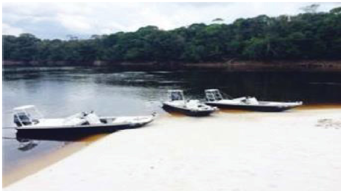
FIGURA 19 - EMBARCAÇÕES UTILIZADAS PARA PRÁTICA DE PESCA ESPORTIVA