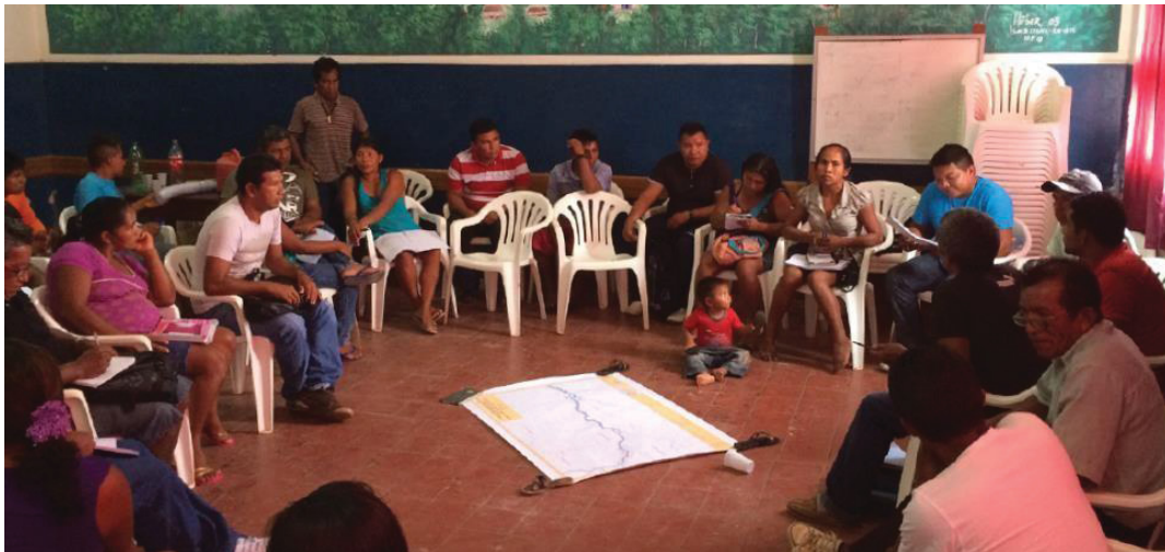
FIGURA 4 - REUNIÃO DAS COMUNIDADES PARTICIPANTES