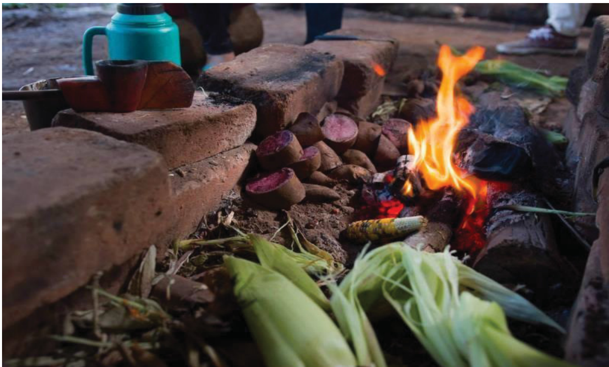
FIGURA 22 - CULTURA ALIMENTAR MBYA GUARANI

O PV Tenondé Porã tem uma proposta de roteiro e vivência diferente para cada aldeia envolvida, com características, condições de realização, roteiros e atividades desenvolvidas específicas para cada uma, mas também com atividades comuns para todas, como a apreciação da comida tradicional (FIGURA 22), a venda de artesanato (FIGURA 23), a apresentação do grupo de canto das crianças e o mboray e as rodas de conversa, com a história da aldeia, sua organização interna e os aspectos da cosmologia e do nhandereko (Tenondé Porã, 2018). O traslado é por conta do visitante, nos casos de pernoite, a hospedagem é oferecida em camping nas aldeias e a alimentação é inclusa nas vivências de mais de um dia, com alimentos provenientes das comunidades, que fazem parte da cultura alimentar Mbya Guarani .