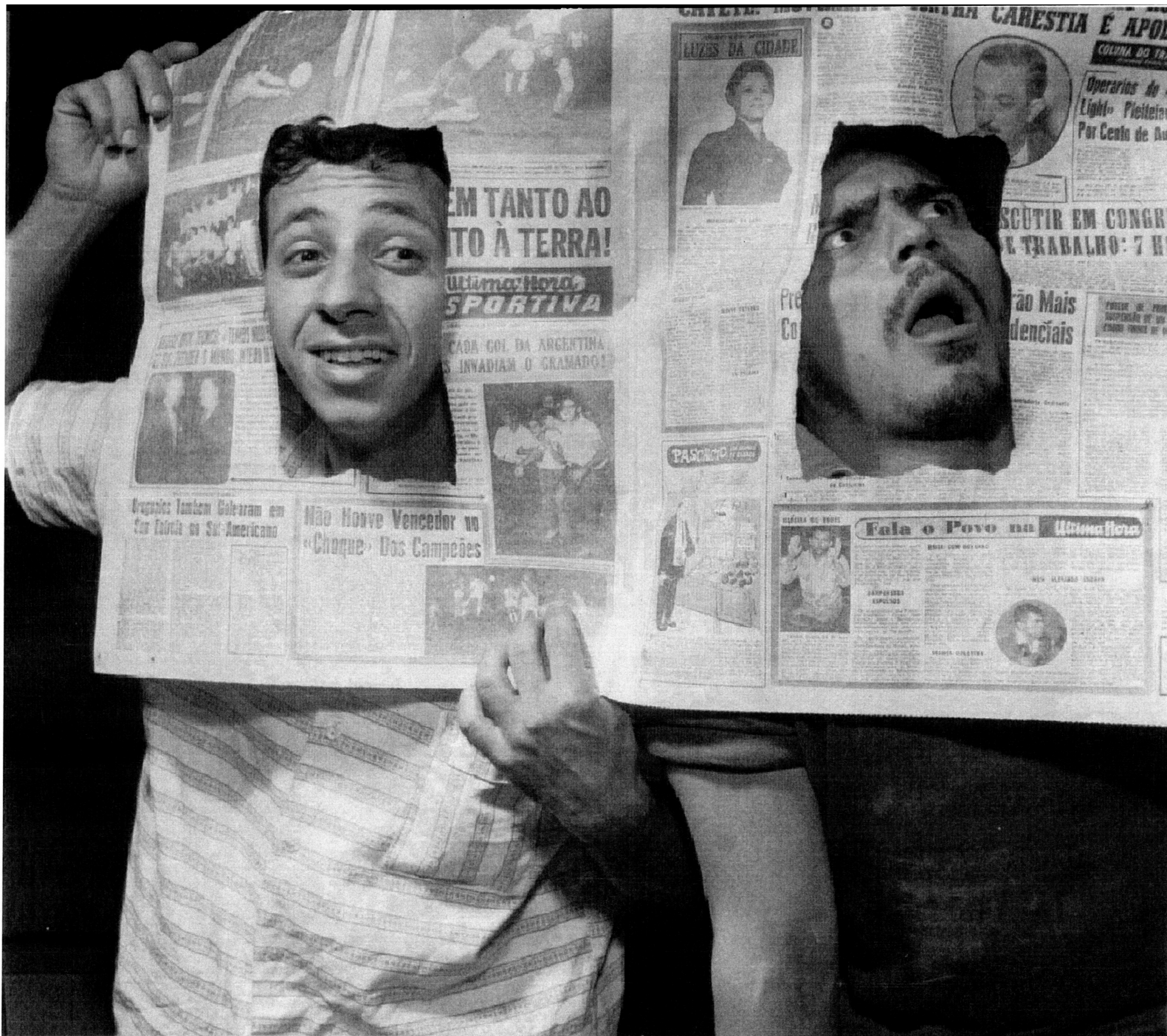
CHAPETUBA FUTEBOL CLUBE. TEATRO DE ARENA/SP/1968