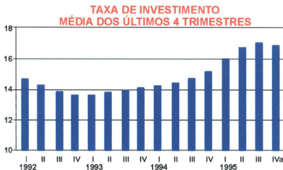
GRÁFICO 2 – TAXA DE INVESTIMENTO MÉDIA DOS ÚLTIMOS 4 TRIMESTRES